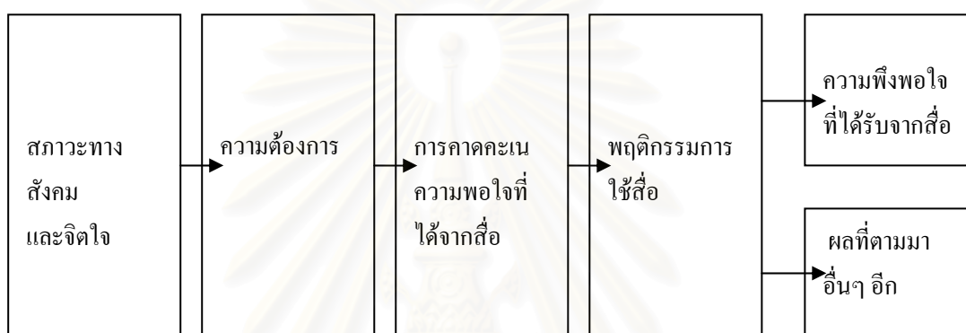
ภาพที่ 2.1 แสดงแบบจำลองการใช้สื่อและความพึงพอใจของ Danis Mcquail (2528)

จากข้อสรุปดังกล่าว สามารถแสดงในรูปของแบบจำลอง ได้ดังนี้ (Danis Mcquail, 2528 : 149)