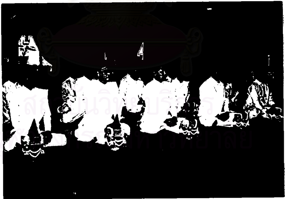
ภาพ ผู้ประกอบพิธีทั้ง 5 ท่าน ที่ทรงพระกรุณาโปรดเกล้าฯ ครอบพระราชนิพนธ์ ให้เป็นผู้ประกอบพิธี เมื่อ พ.ศ.2527