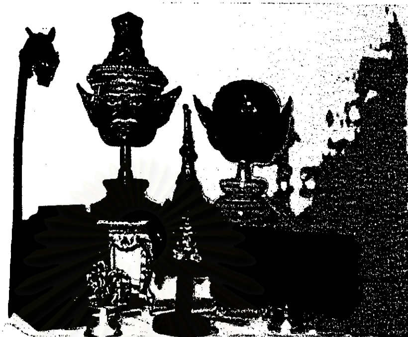
ภาพ ศิระษะพระภรตฤษี พระพิราพ เทริด พระตำรา ไม้เท้า เทวรูป ของพระยานัฏกานูรักษ์ที่คณหญิงนัฏกานูรักษ์ มอบให้นายอาคม สายาคม