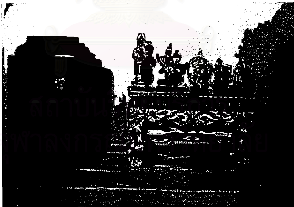
ภาพ เทวรูปพร้อมตู้ของพระยานัฏกานูรักษ์