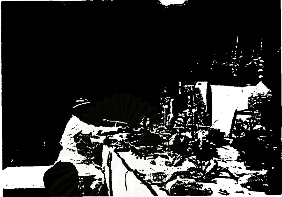
ภาพ ม.ร.ว.จรรยาวัธต์ ศุขสวัสดิ์ ผู้ประกอบพิธี พ.ศ.2525 - พ.ศ.2527