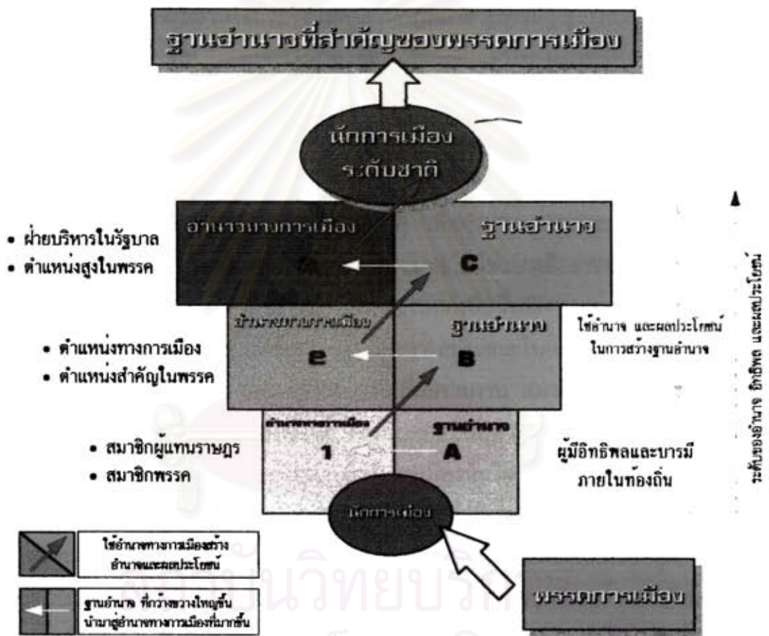
แผนภาพที่ 5.2 : แสดงการสร้างฐานอำนาจของพรรคการเมือง โดยนักการเมือง

ในการพิจารณาถึงการสร้างฐานอำนาจ * ของพรรคการเมือง โดยอาศัยการเมืองท้องถิ่นนั้น ในกรณีศึกษานี้ เป็นตัวอย่างให้เห็นถึงความชัดเจนที่พรรคการเมืองได้สร้างฐานอำนาจโดยใช้การเมืองท้องถิ่น และยังแสดงให้เห็นถึงความต่อเนื่องและการแผ่ขยายฐานอำนาจกว้างออกไป โดยมีความสัมพันธ์ระหว่างฐานอำนาจกับอำนาจทางการเมือง ** ในลักษณะของการใช้อำนาจเพื่อสร้างกันและกัน ดังแผนภาพที่ 5.2