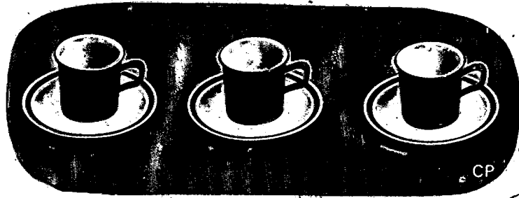
ภาชนะเมลามีน ชนิดสองชั้น