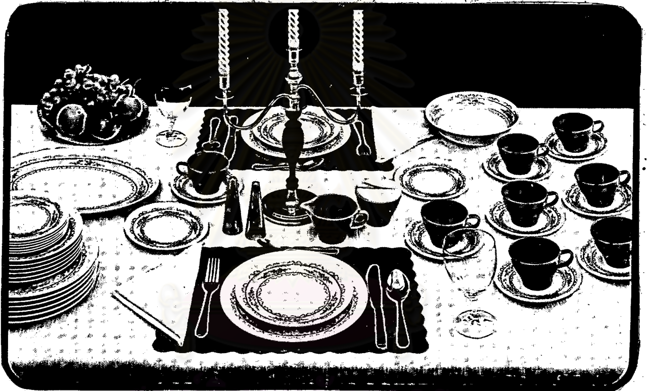
ภาชนะเมลามีนชนิดสองชั้น