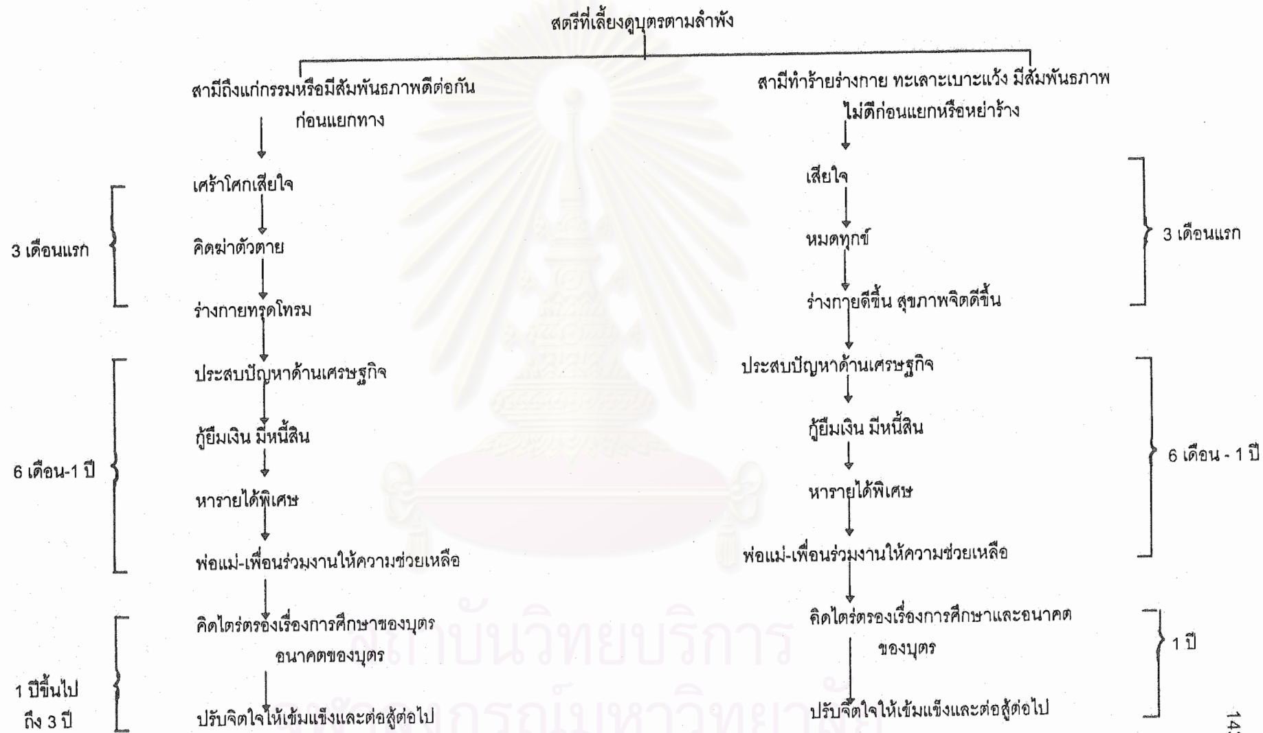
แผนภูมิที่ 1 กรอบแนวคิดการปรับตัวของสตรีที่เลี้ยงดูบุตรตามลำพัง