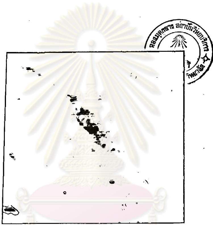
รูปที่ 1 แสดงภาพถ่ายของ Trichomonas vaginalis (5,000X) จากผู้ป่วย