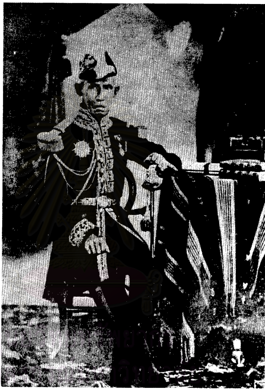
พระบวรฉายาลักษณ์พระบาทสมเด็จพระปิ่นเกล้าเจ้าอยู่หัว