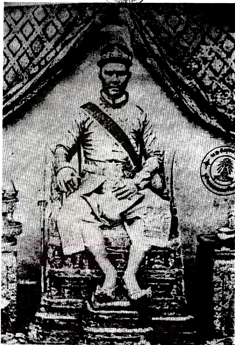
พระนายาตลักษณ์กรมพระราชวังบวรวิชัยชาญ