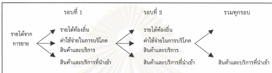
แผนภูมิ 2.2 แสดงรอบการใช้จ่ายในท้องถิ่น

ที่มา : ปรับปรุงมาจาก M.J. Emerson และ F.C. Lamphear (1975)