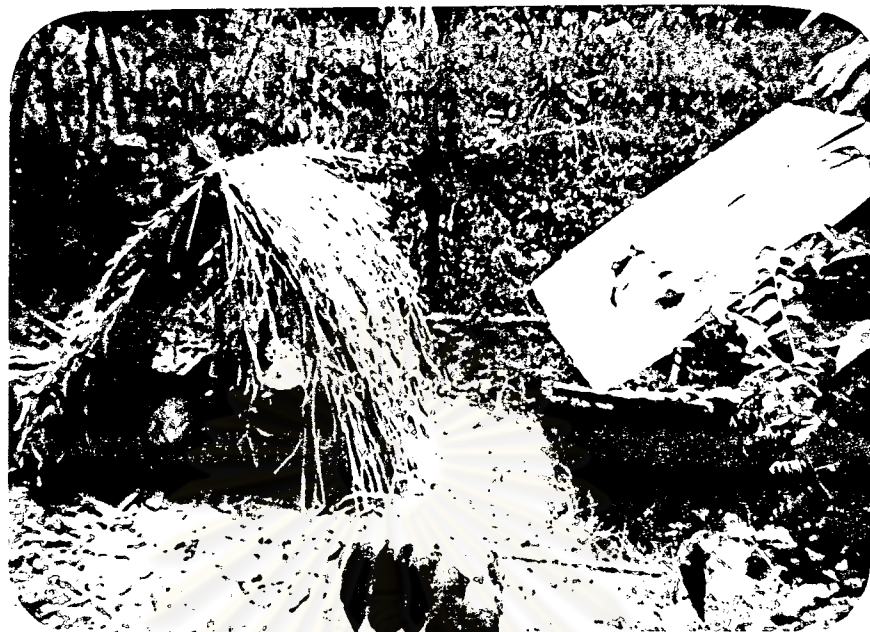
ภาพที่ 16 ซากเพชชะงูในพืชร่มหรือป่าหนาทนพืชร่ม