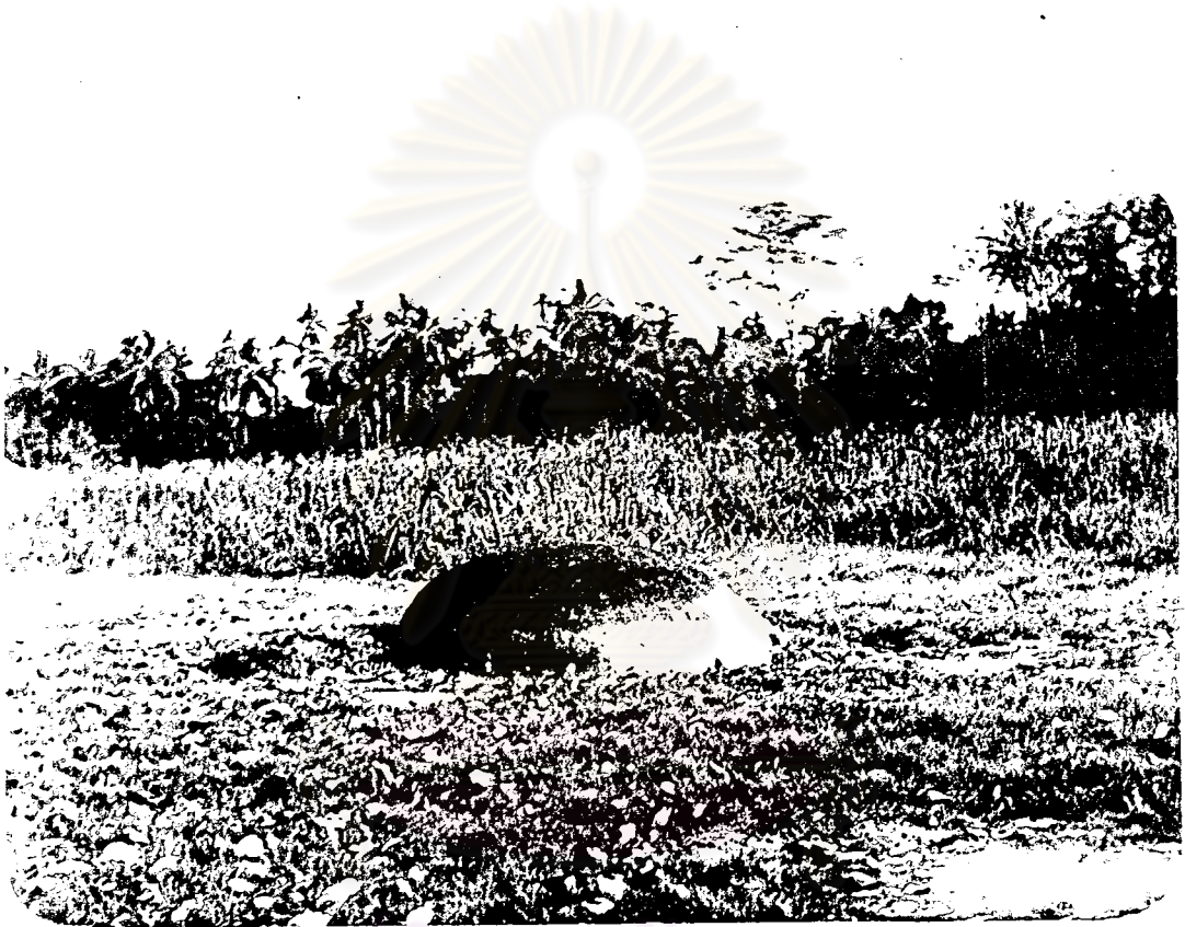
ศูนย์วิทยทรัพยากร ภาพที่ ๗ ลกคฉั ตามลพวงคฉั จุฬาลงกรณ์มหาวิทยาลัย