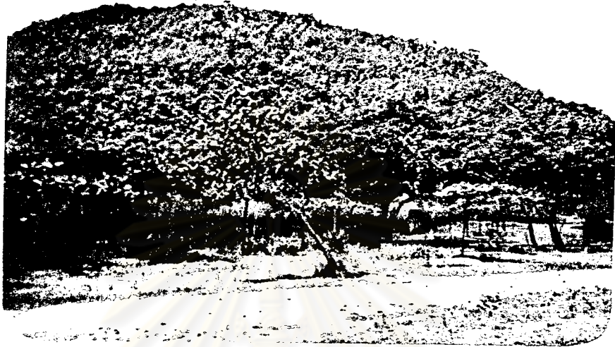
ภาพที่ 14 ซากหลุมเมืองราชบุรี เป็นซากที่พบสมัยทวารวดีที่เมืองราชบุรี