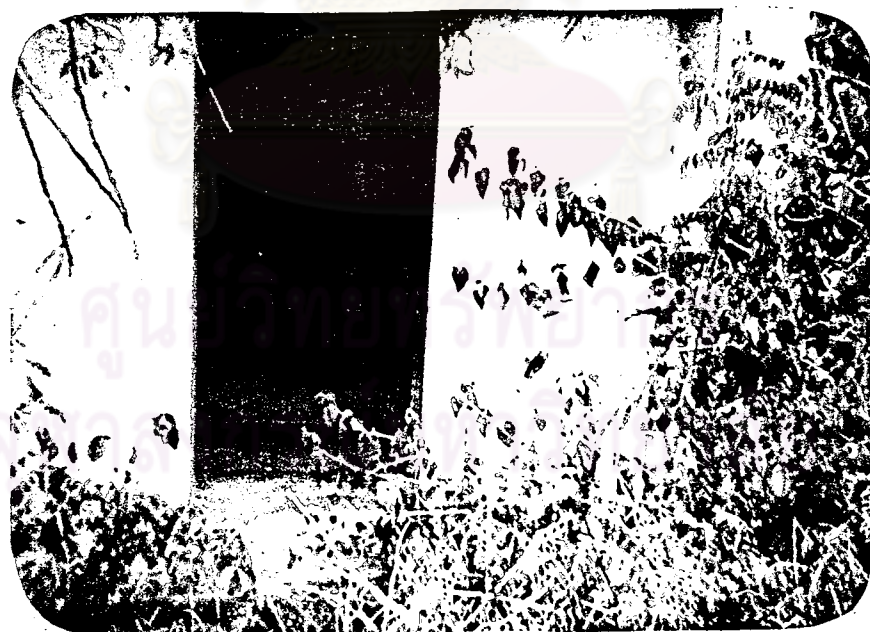
ภาพที่ 17 ศาลเจ้าแม่พืชร่ม (ศาลเจ้าแม่อาแม่)