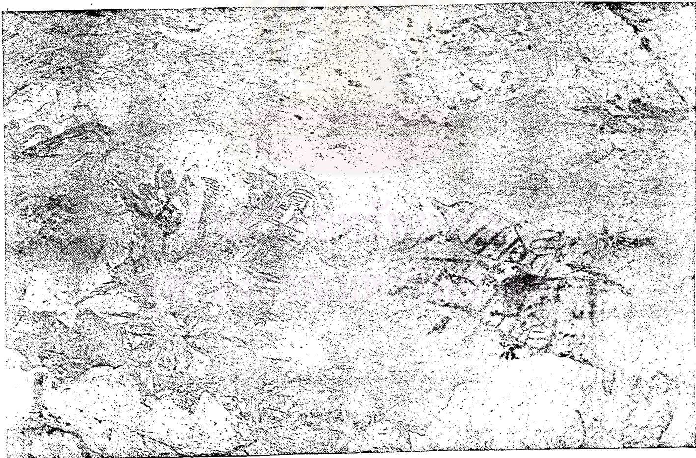
ภาพที่ ๕ ภาพเขียนบนหน้าผาที่เขายี่ลุ่ม ตำบลเกาะป็นหย