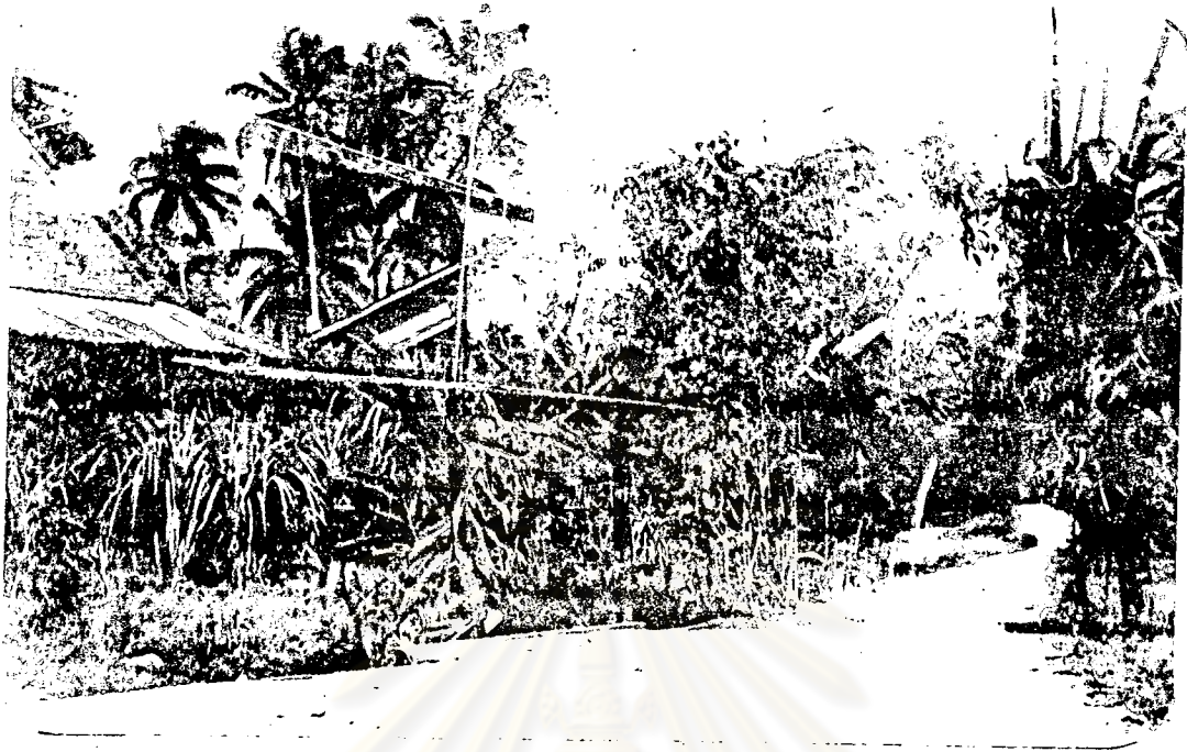
ภาพที่ 5 บ้านด้าย ตำบลนาทราย (ด้ายพระอินทร์)