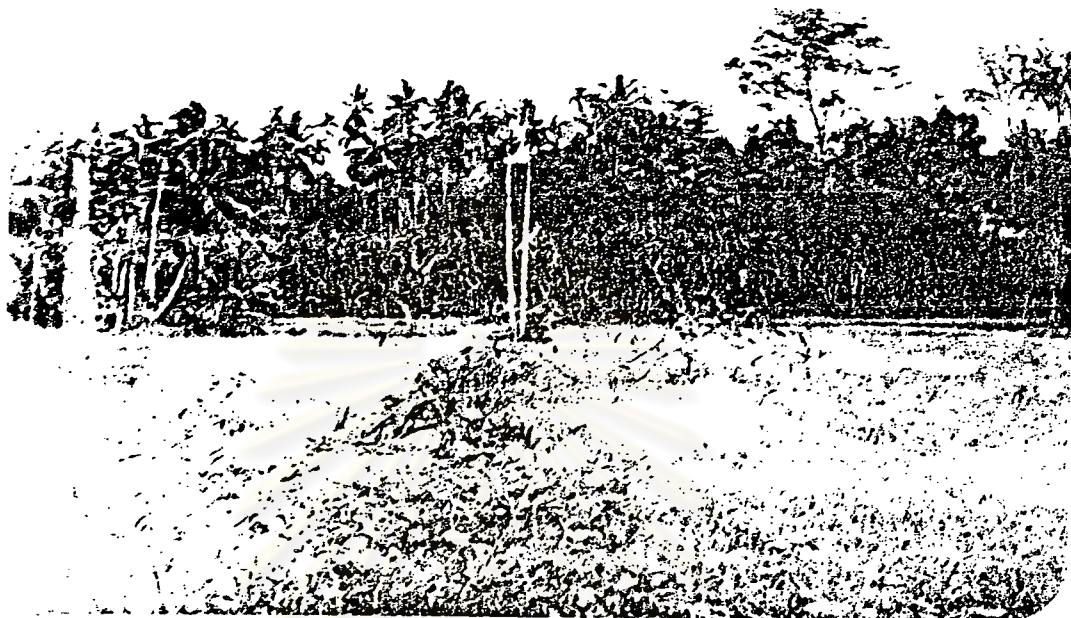
ภาพที่ 3 ไม้ผลายหา ค้ำคมนาดี (ที่อยู่ของพนาภิรมย์เจ้าพระ)