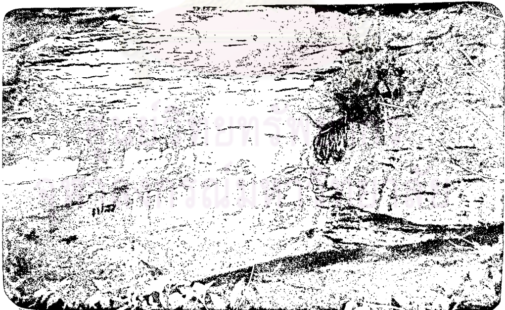
ภาพที่ 13 ยอดเขาทางฝั่งซ้าย ซึ่งเป็นที่บรรจุกระดูกทางฝั่งซ้าย กำบลำน้ำแดน อำเภอบรรพตพิสัย