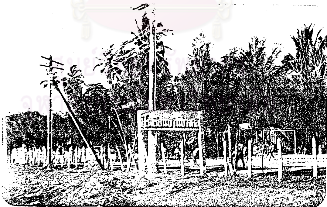
ภาพที่ 4 ลิภาพบ้านบางดัดปัจจุบัน