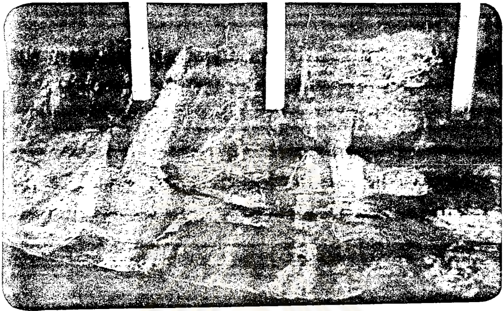
ภาพที่ 12 หน้าเขาเชิงเขาทางฝั่งซ้าย ซึ่งเป็นที่เขื่อนตาตาเรียกเนื้อเรียกปลา กำบลำน้ำแดน อำเภอบรรพตพิสัย