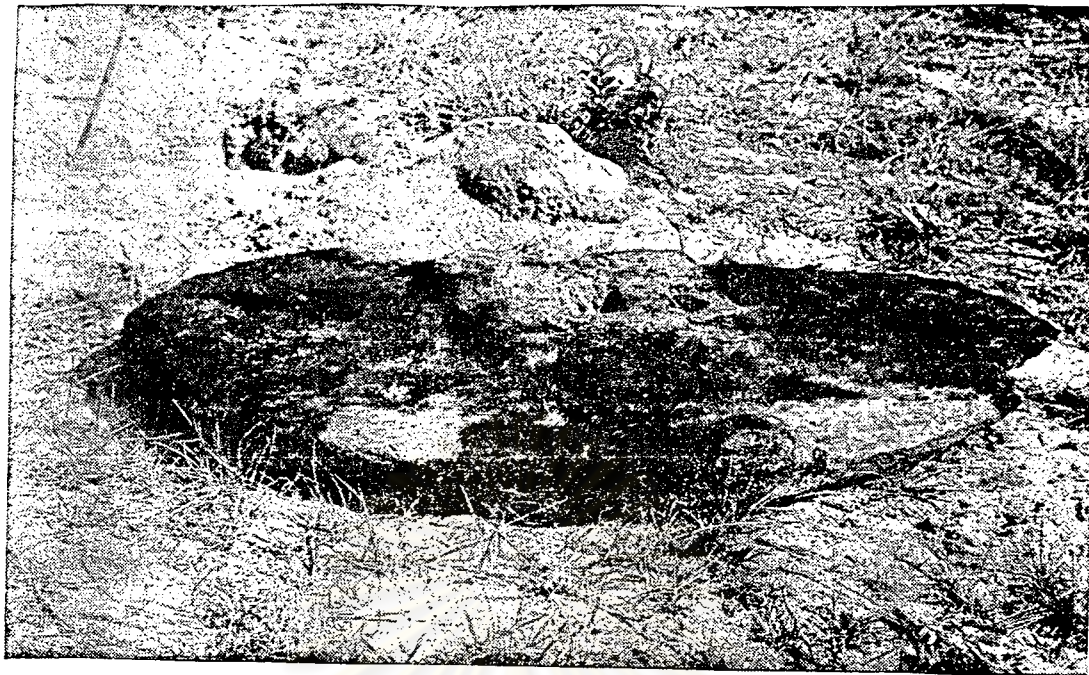
ภาพที่ 1 แท่นหินล่อนของศิลปะยุคทวารวดีที่วัดเกาะคอเขา ทรงพรางาเชื่อว่าเดิมเมืองยี่ลุ่ม