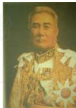
เจ้าแก้วนารัฐ

ที่มา : วงศ์ศักดิ์ ณ เชียงใหม่. เจ้าหลวงเชียงใหม่ (เชียงใหม่: สำนักส่งเสริมศิลปวัฒนธรรมมหาวิทยาลัยเชียงใหม่, 2539), หน้า 29.