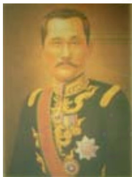
เจ้าอินทวโรสุริยวงศ์