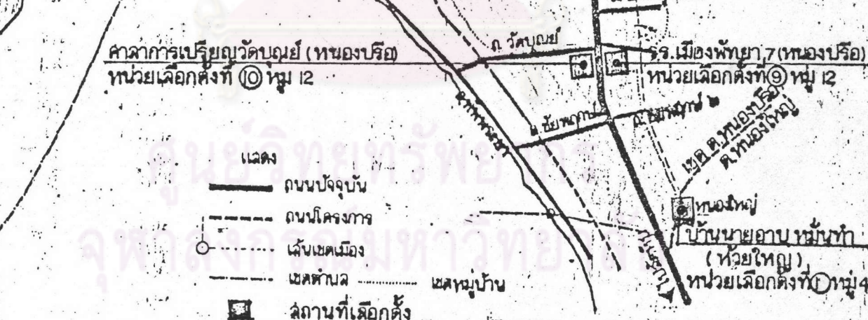
แผนภาพที่ ๕