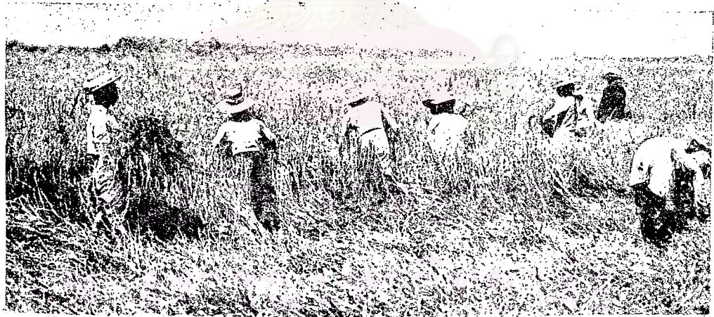
การเก็บเกี่ยวข้าวของชาวนา

Arnold Wright And Oliver T. Breakspear Twentieth Century Impression of Siam . London : The Gresham Press, 1908.