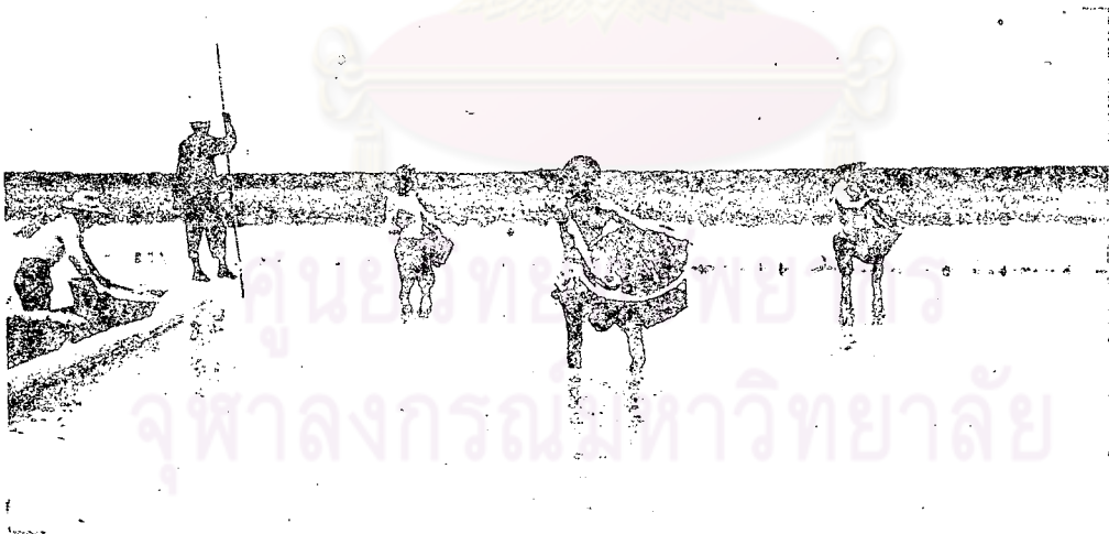
การทอผ้าฝ้ายของชาวสุโขทัย

13817 Arnold Wright and Olover. T. Breakspear Twentieth Century Impression of Siam. London : The Gresham Press, 1908.