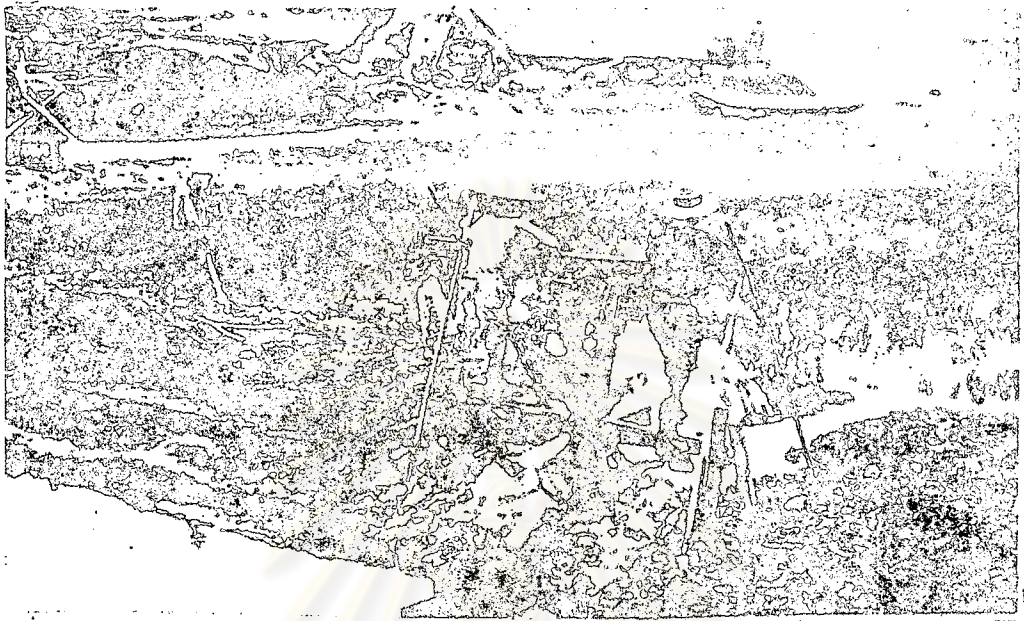
การวิดน้ำเขานาควยแรงงานของชาวนา