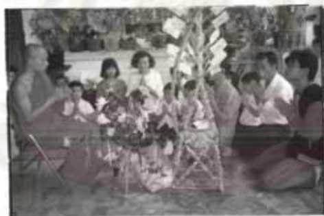
ภาพที่ 44 การทำบุญตานสลากภัตต์

การทำพิธีเช่นบวงสรวงเจ้าที่ และมีการทำพิธีลงเจ้านาย ซึ่งเป็นความเชื่อว่าจะต้องมีพิธีการลงเจ้านายให้มาเช่าร่างผู้เป็นเจ้าเข้าทรง มีเจ้านายที่เข้ามาลง (สิง) จำนวน 7-9 เจ้า ซึ่งการทำพิธีนี้จะมีช่างชอมาขับกล่อมระหว่างมีพิธีลงเจ้านายด้วย