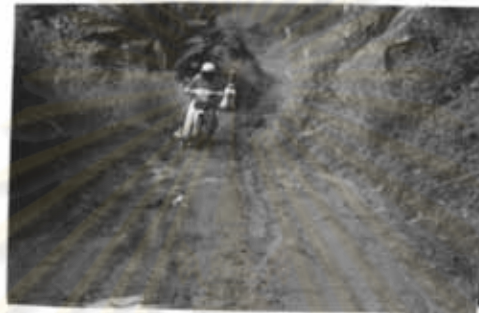
ภาพที่ 4 การเร่งเครื่องมอเตอร์ไซด์ขึ้นดอย

จากสภาพการคมนาคม ดังภาพ จะเห็นได้ว่า สภาพการเดินทางจากอำเภอไปหมู่บ้านแม่ปะ จะมีความยากลำบากมากกว่า สภาพการเดินทางไปหมู่บ้านแม่ชาน ซึ่งเป็นเหตุให้การติดต่อกัน หรือการพัฒนาไปถึง ได้ลำบาก ยิ่งเป็นฤดูฝนด้วยแล้วการเดินทางไปหมู่บ้านแม่ปะ จะลำบากมาก บางครั้งจะต้องมีการลากรถ หรือจูงรถมอเตอร์ไซด์ขึ้นเขาลงเขา