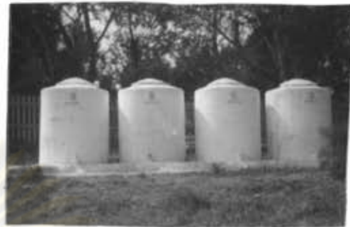
ภาพที่ 36 แท็งค์น้ำใช้ในหมู่บ้านแม่ชาน

ทางด้านสาธารณสุข จะมีเจ้าหน้าที่สาธารณสุข ให้บริการประชาชนในหมู่บ้าน เหมือนกับทุกหมู่บ้าน