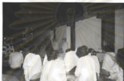
ภาพที่ 40 การทำบุญทุกวันพระและวันสำคัญ

โดยปกติทั่วไปแล้ว ประชาชนในชนบทมักจะมีความเชื่อทางขนบธรรมเนียมประเพณี วัฒนธรรม โดยยึดเอาพุทธศาสนาเป็นที่พึ่ง และมักจะมีประเพณีที่ถือปฏิบัติต่อกันมาช้านานแล้ว ลักษณะของการปฏิบัติจะถ่ายทอดต่อกันมา รุ่นปู่ย่าตายาย จนถึงรุ่นลูกหลาน และเหลน