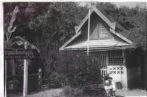
ภาพที่ 14 ที่อ่านหนังสือพิมพ์หมู่บ้านแม่ปะ ภาพที่ 14 ที่อ่านหนังสือพิมพ์หมู่บ้านแม่ชาน

จากสภาพชุมชนโดยทั่วไปของหมู่บ้านทั้งสองจะเห็นได้ว่า ไม่ค่อยมีความแตกต่างกันมากนัก นอกจากสภาพของชุมชนแม่ปะจะอยู่ในส่วนของเขตที่สูง - ต่ำ มีความต่างระดับของพื้นที่มากกว่าแม่ชาน และสภาพวัดของแม่ปะจะมีความสมบูรณ์น้อยกว่าแม่ชาน และแม้แต่ที่อ่านหนังสือพิมพ์ก็ขาดคนสนใจดูแล