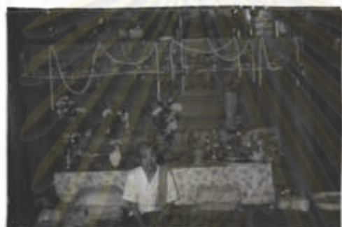
ภาพที่ 46 คนที่ให้เจ้านายเข้าสิงจะเป็นที่ เคารพนับถือของประชาชนในหมู่บ้าน