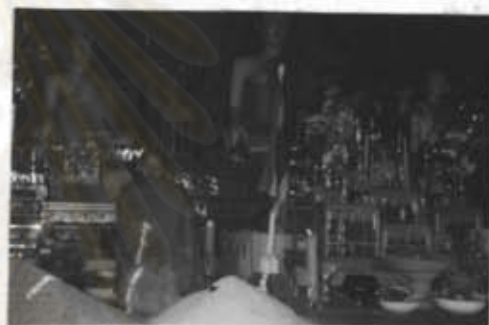
ภาพที่ 10 ภายในโบสถ์วัดแม่ฮาน