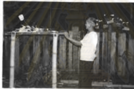
ภาพที่ 49 การปิดเป่าและขอขมาลาโทษ

ส่วนการเช่นบวงสรวงเจ้าที่ ที่มีบุคคลได้เข้าไปลวงเกินให้เจ้าที่โกรธจนทำให้คน คนนั้นเจ็บป่วย หรืออาจมีสติไม่สมประกอบไปนั้นจะต้องมีการทำพิธีขอขมาลาโทษ ปิดเป่า โดยมีพิธีทางสงฆ์เข้าร่วม