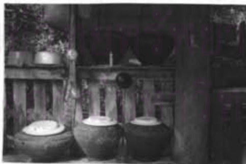
ภาพที่ 21 หม้อน้ำรับแขกอยู่หน้าบ้าน

อีกทั้งยังมีการต้อนรับขับสู้ผู้ที่ไปมาหาสู่ โดยการสังเวยได้จากทุกบ้านจะมีหม้อน้ำ ต้มไว้หน้าบ้าน และยังมีการนำเมี่ยง และบุหรี่ไว้ให้ผู้มาเยือนได้ขบเคี้ยว หรือสูบบุหรี่ชนิดมวนใบตองเป็นพวกยาเส้น