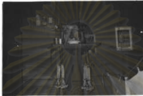
ภาพที่ 15 จะมีห้องบูชาพระ

ที่อยู่อาศัยของประชาชน โดยทั่วไปแล้วไม่มีความแตกต่างกันมากนัก ด้วยเพราะประชาชนส่วนใหญ่จะเป็นคนพื้นเมืองทั้งสองหมู่บ้าน ไม่มีชาวเขาเลย ภายในบ้านจึงมีสภาพเหมือนๆ กัน คือ