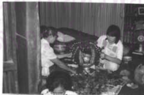
ภาพที่ 50 การทำขันผูกมือ (บายศรี)

และพิธีกรรมที่ถือเป็นวัฒนธรรมของประชาชน คือ การแต่งงาน โดยมีการทำพิธี บายศรี ผูกข้อมือ (มัดมือ) คู่บ่าวสาวด้วยบุคคลที่เป็นที่นับหน้าถือตา