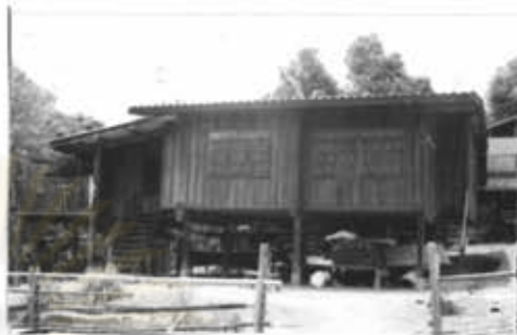
ภาพที่ 24 บ้านประชาชนในหมู่บ้านแม่ชาน