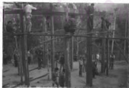
ภาพที่ 31 การขึ้นเสาเอกจะมีประชาชนมาช่วย

ในส่วนของการนำไม้มาใช้เพื่อปลูกสร้างบ้านอยู่อาศัย หรือการช่วยเหลือกันสร้างโรงครัว หรือกุฏิให้พระจะ ไม่มีการซื้อขายไม้ ผู้ที่สร้างบ้านอยู่เองจะไปตัดไม้ในป่ามาสร้างบ้านตนเอง สำหรับงานที่เป็นไปเพื่อส่วนรวมแล้ว จะร่วมกันทุกบ้าน ร่วมกันนำไม้มาช่วย โดยจะตกลงแบ่งเป็นหมวดในหมู่บ้าน หมวดละประมาณ 10 หลังคาเรือน รวบรวมไม้มาช่วยตามความต้องการของลักษณะการสร้างงาน