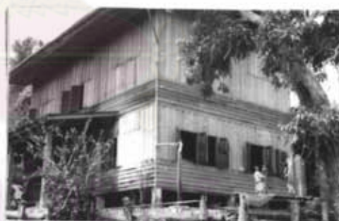
ภาพที่ 23 บ้านพ่อหลวง (ผู้ใหญ่บ้าน) แม่ปะ