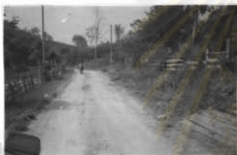
ภาพที่ 7 ทางเข้าหมู่บ้านแม่ปะ