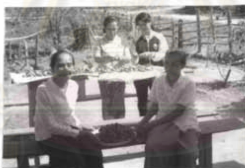
ภาพที่ 33 ผู้สูงอายุจะมีกิจกรรมอยู่ภายในบ้าน (แกะมะชาม)

ประชาชนที่สูงอายุก็จะมีกิจกรรมอยู่ภายในบ้าน โดยปล่อยให้พวกที่อยู่ในวัยเจริญ ได้ออกไปทำงานในไร่นา