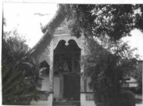
ภาพที่ 9 วัดแม่ฮาน