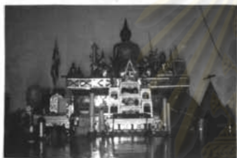
ภาพที่ 10 ภายในโบสถ์วัดแม่ปะ