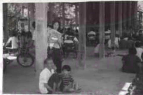
ภาพที่ 39 การมาประชุมของประชาชนอย่างพร้อมเพรียง

นอกจากนี้แล้วถ้าเป็นเรื่องด่วนและจำเป็นแล้ว จะมีการเรียกประชุมประชาชนใน หมู่บ้านตามความเหมาะสม