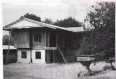
ภาพที่ 11 กุฏิวัดแม่ปะ