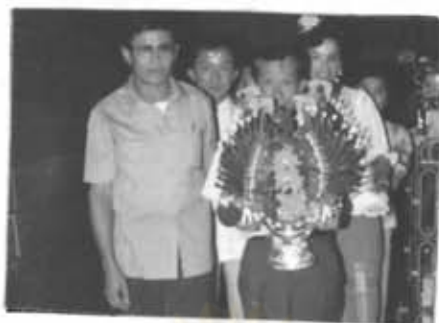
ภาพที่ 51 การแห่ขันหมาก