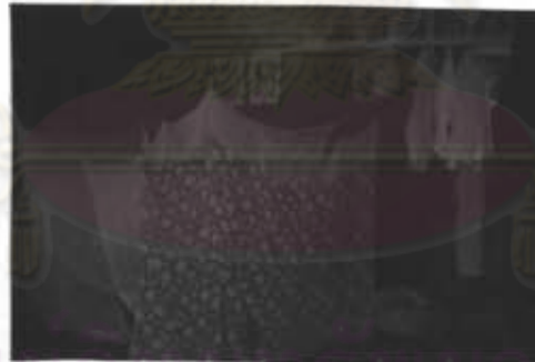
ภาพที่ 16 กางมุ้งนอนทั้งไว้ตลอดปีและ บางบ้าน ไม่มีการกางมุ้งนอน