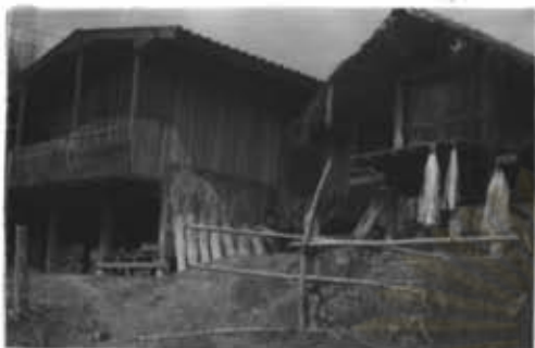
ภาพที่ 24 บ้านประชาชนในหมู่บ้านแม่ปะ