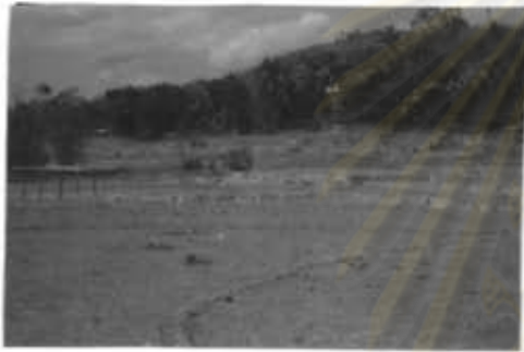
ภาพที่ 26 ความแห้งแล้ง ไม่มีน้ำใช้ ทำการเกษตรในฤดูแล้ง