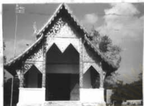
ภาพที่ 9 วัดแม่ปะ