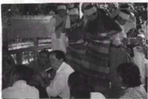
ภาพที่ 47 คนที่ร่วมในพิธีให้เจ้านายเข้าสิง