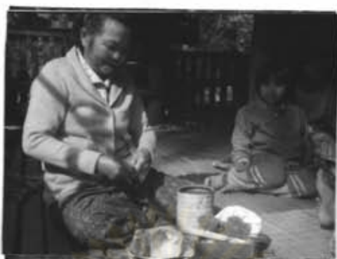
ภาพที่ 22 มีเมียงและบุตรีให้ดูมาเย็บมได้ทานและสูบ

นอกจากนี้ ผู้วิจัยสังเกตเห็นว่า สภาพของบ้านเรือนที่ปลูกของหมู่บ้านทั้งสองยังมีความแตกต่างกันอยู่มาก กล่าวคือ หมู่บ้านแม่ปะ สภาพของบ้านจะมีขนาดเล็ก แม้ว่าจะใช้ไม้สักปลูกเหมือนกัน แต่ของหมู่บ้านแม่ชานจะมีขนาดใหญ่กว่ามาก