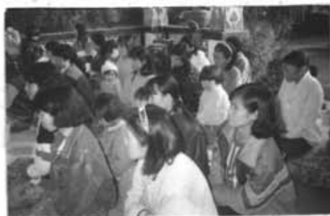
ภาพที่ 42 การมาประชุมที่วัด