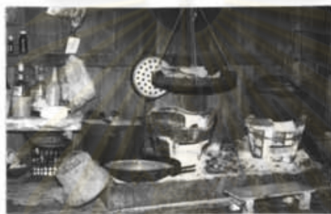
ภาพที่ 20 คริวไฟ

อีกทั้งยังมีการต้อนรับขับสู้ผู้ที่ไปมาหาสู่ โดยการสังเวยได้จากทุกบ้านจะมีหม้อน้ำ ต้มไว้หน้าบ้าน และยังมีการนำเมี่ยง และบุหรี่ไว้ให้ผู้มาเยือนได้ขบเคี้ยว หรือสูบบุหรี่ชนิดมวนใบตองเป็นพวกยาเส้น