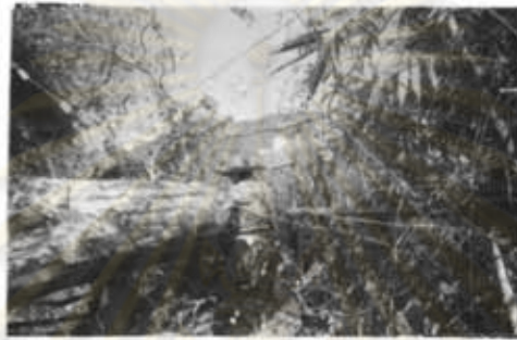
ภาพที่ 30 การตัดไม้เนื้อแข็ง

รายได้ของหมู่บ้านแม่ปะที่พบอีกอย่าง คือ การตัดไม้ขายหรือมาใช้ในครัวเรือน