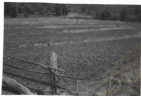
ภาพที่ 28 การปลูกพืชจะเป็น พวกถั่วแต่มันน้อย