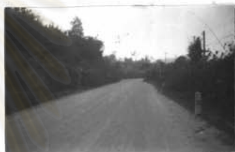
ภาพที่ 7 ทางเข้าหมู่บ้านแม่ชาน