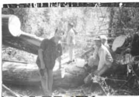
ภาพที่ 19 การนำไม้มาทำเป็นเชื้อเพลิง