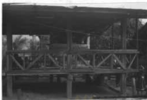
ภาพที่ 45 สถานที่จะทำพิธีส่งเจ้านาย