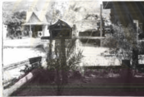
ภาพที่ 18 มีความเชื่อทางผีสงฆ์และเจ้าที่เจ้าทาง

และในส่วนองชีวิตความเป็นอยู่ที่ต้องอาศัยธรรมชาติ และขาดเสียไม่ได้ คือการ อาศัยไม้เป็นส่วนช่วยการหุงหาอาหารเพื่อยังชีพ