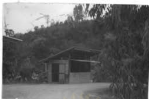
ภาพที่ 34 มีปิ่นแกม่น

หมู่บ้านแม่ปะ เฟ็งจะมีไฟฟ้าเข้าเมื่อเดือนตุลาคม 2534 แต่ของหมู่บ้านแม่ชาน ใช้ไฟฟ้ามาได้หลายปีมาแล้ว