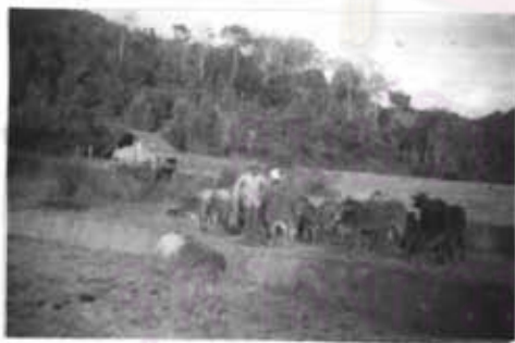
ภาพที่ 27 ชาวแม่ปะจะนิยม เลี้ยงวัวมาก