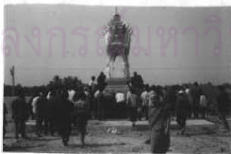
ภาพที่ 53 การแห่ปราสาทผู้ตายก่อนนำไปเผา

สำหรับพิธีกรรมที่จัดให้กับบุคคลในชั้นสุดท้ายของชีวิตที่ไม่สามารถเห็นพັນคือ พิธีงานศพถ้ามีงานศพในบ้านได้ก็ตามประชาชนทุกคนเมื่อทราบข่าวจะไปร่วมพิธีนี้ เพื่อแสดงความเสียใจให้กับผู้เป็นญาติมิตร อีกทั้งยังเป็นการขอขมาลาโทษผู้ตายที่ได้กระทำล่วงเกินใด ๆ ไปอีกด้วย