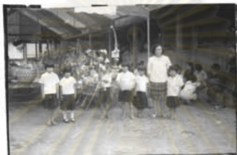
ภาพที่ 43 การทำบุญเนื่องในงานปอย