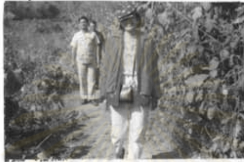
ภาพที่ 5 การเดินทางด้วยเท้าเปล่า

นอกจากนี้ยังต้องอาศัยการเดินทางด้วยเท้าในทั้งสองหมู่บ้าน ซึ่งบางแห่งที่ช่วยให้เกิดการเดินลัดได้สะดวก และเร็วขึ้นกว่าการเดินทางด้วยรถ และเป็นทางอ้อมมาก