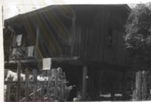
ภาพที่ 25 บ้านพักครูโรงเรียนแม่ชาน

จากสภาพที่อยู่อาศัยของหมู่บ้านแม่ปะ และหมู่บ้านแม่ชาน จะพบว่าความแตกต่างอยู่ตรงขนาดของบ้าน ซึ่งมีขนาดที่แตกต่างกันมาก ทั้งนี้ผู้วิจัยได้เคยสอบถามประชาชนในหมู่บ้าน ก็ทราบมาว่า หมู่บ้านแม่ปะมีการตัดไม้สักมาสร้างกันแล้ว พอสักกระยะหนึ่ง 7 หรือ 10 ปี ขึ้นไป ก็จะมีการขายบ้านเป็นหลังให้กับผู้ที่สนใจมาซื้อ แล้วจะเลื่อยไม้มาสร้างบ้านใหม่ แต่จำนวนไม้สักซึ่งปัจจุบันมีน้อย จึงได้บ้านขนาดไม่ใหญ่มากนัก อีกทั้งยังหาไม้สักเหลืออยู่นั้นแทบจะไม่มีเหลือแล้วในปัจจุบัน ซึ่งตรงข้ามกับหมู่บ้านแม่ชาน บ้านจะมีขนาดของบ้านหลังใหญ่ มีการปลูกแล้วจะไม่มีการขาย และสภาพป่าสักยังมีความอุดมสมบูรณ์อยู่อีกมาก อีกทั้งหมู่บ้านแม่ปะ ได้ชื่อว่าเป็นหมู่บ้านที่ครอบครัวมีการแยกครัวเรือนกันมาก ซึ่งสร้างบ้านหลังเล็กๆ อยู่ แต่หมู่บ้านแม่ชานเป็นหมู่บ้านที่มีครอบครัวขยายใหญ่ ไม่แยกครอบครัวมักจะอยู่กันในบ้านหลังเดียวกัน 2-3 ครอบครัวคือลูกหลานแต่งงานแล้วก็อยู่รวมกันกับพ่อแม่ไม่แยกไปตั้งครอบครัวใหม่เหมือนหมู่บ้านแม่ปะ