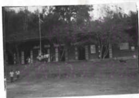
ภาพที่ 8 โรงเรียนแม่ปะ