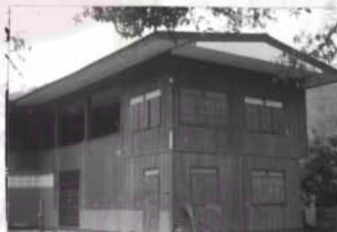
ภาพที่ 11 กุฏิวัดแม่ฮาน