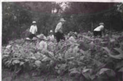
ภาพที่ 29 การรับจ้างปลูกป่าสักของหมู่บ้านแม่ปะ

การประกอบอาชีพของประชาชน ดังกล่าว จะพบว่าประชาชนในหมู่บ้านแม่ปะจะไม่ค่อยมีอาชีพในช่วงฤดูแล้ง จึงทำให้เกิดการว่างงาน รายได้ที่หมุนเวียนน้อยลง นอกจากนี้จะมีรายได้เสริมที่ตกมาจากการเร่งรัดพัฒนาของรัฐ เช่น การฟื้นฟูสภาพป่าสัก และมีการจ้างแรงงานเป็นรายวันให้กับประชาชน ได้ประมาณ 45-50 บาทต่อวัน