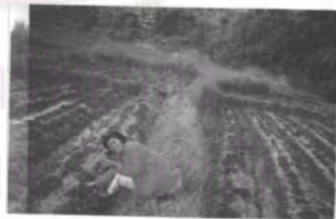
ภาพที่ 27 รายได้จะมาจาก การขายสัตว์ปลอดสารเคมี