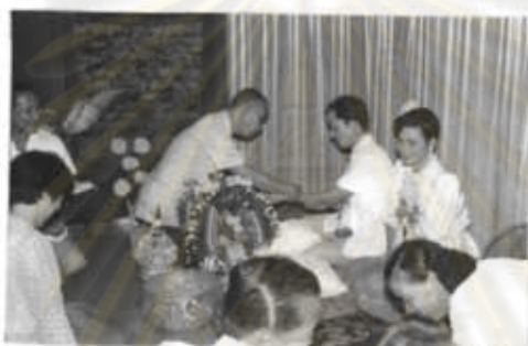
ภาพที่ 52 การผูกข้อมือ

สำหรับพิธีกรรมที่จัดให้กับบุคคลในชั้นสุดท้ายของชีวิตที่ไม่สามารถเห็นพັນคือ พิธีงานศพถ้ามีงานศพในบ้านได้ก็ตามประชาชนทุกคนเมื่อทราบข่าวจะไปร่วมพิธีนี้ เพื่อแสดงความเสียใจให้กับผู้เป็นญาติมิตร อีกทั้งยังเป็นการขอขมาลาโทษผู้ตายที่ได้กระทำล่วงเกินใด ๆ ไปอีกด้วย