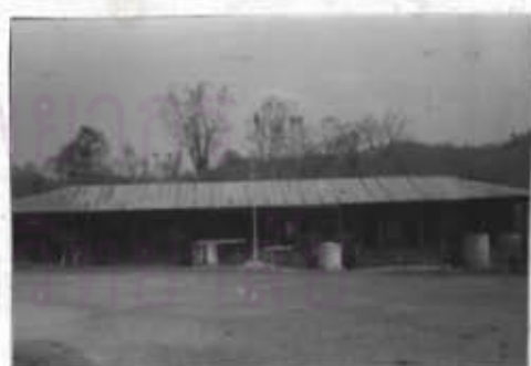
ภาพที่ 8 โรงเรียนแม่ชาน