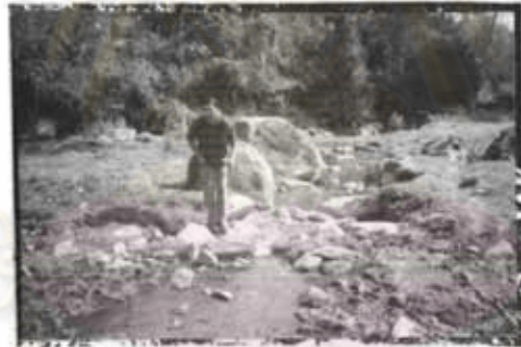
ภาพที่ 6 ต้องเดินข้ามน้ำ

ศูนย์วิจัยทรัพยากร จุฬาลงกรณ์มหาวิทยาลัย