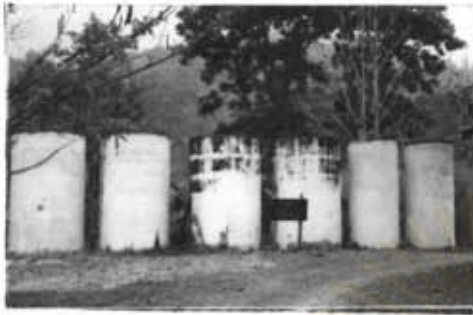
ภาพที่ 36 แท็งค์น้ำใช้ในหมู่บ้านแม่ปะ