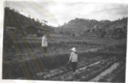
ภาพที่ 26 มีน้ำเพียงพอที่จะทำไร่นา ไร่นาปลอดสารเคมี