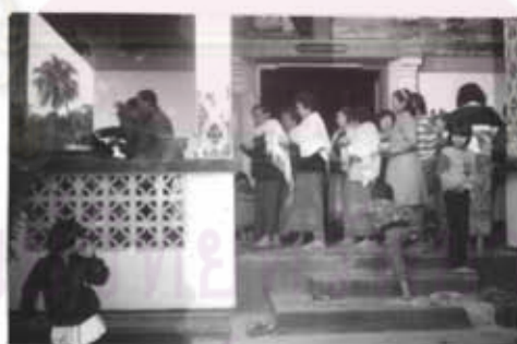
ภาพที่ 41 การทำทานข้าวใหม่