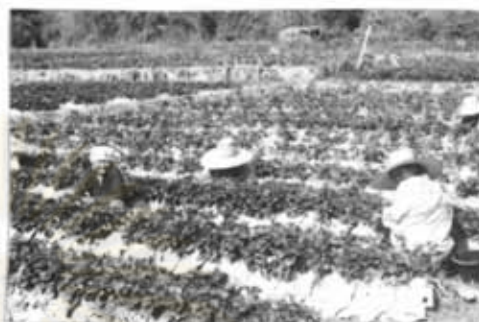
ภาพที่ 28 จะปลูกแต้สเตอร์เบอร์รี่ ทุกครัวเรือน

การประกอบอาชีพของประชาชน ดังกล่าว จะพบว่าประชาชนในหมู่บ้านแม่ปะจะไม่ค่อยมีอาชีพในช่วงฤดูแล้ง จึงทำให้เกิดการว่างงาน รายได้ที่หมุนเวียนน้อยลง นอกจากนี้จะมีรายได้เสริมที่ตกมาจากการเร่งรัดพัฒนาของรัฐ เช่น การฟื้นฟูสภาพป่าสัก และมีการจ้างแรงงานเป็นรายวันให้กับประชาชน ได้ประมาณ 45-50 บาทต่อวัน