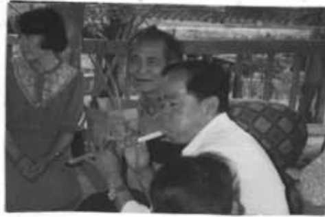
ภาพที่ 48 ช่างซ่อมจะชักกลุ่มขณะเจ้านายเข้าสิง

ส่วนการเช่นบวงสรวงเจ้าที่ ที่มีบุคคลได้เข้าไปลวงเกินให้เจ้าที่โกรธจนทำให้คน คนนั้นเจ็บป่วย หรืออาจมีสติไม่สมประกอบไปนั้นจะต้องมีการทำพิธีขอขมาลาโทษ ปิดเป่า โดยมีพิธีทางสงฆ์เข้าร่วม