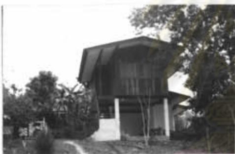
ภาพที่ 25 บ้านพักครูโรงเรียนแม่ปะ