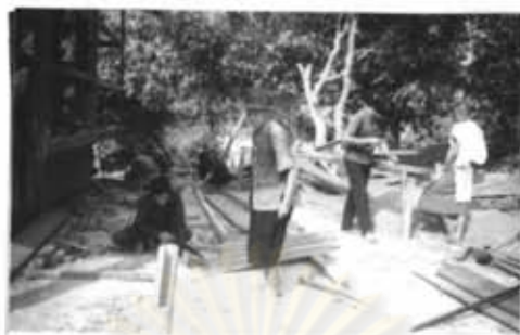
ภาพที่ 32 เกี่ยวกับทางวัดจะแบ่งกันมาช่วยตามความสามารถ

ประชาชนที่สูงอายุก็จะมีกิจกรรมอยู่ภายในบ้าน โดยปล่อยให้พวกที่อยู่ในวัยเจริญ ได้ออกไปทำงานในไร่นา