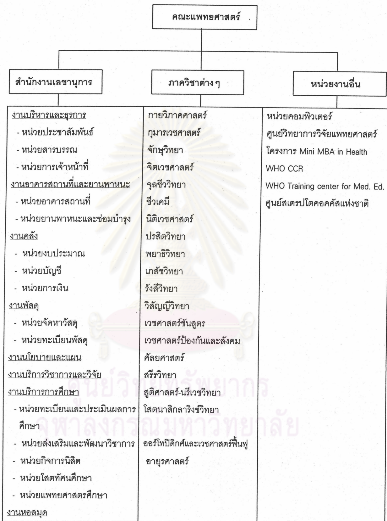
แผนภูมิที่ 2.2 แสดงโครงสร้างการจัดองค์กรของคณะแพทยศาสตร์ จุฬาลงกรณ์มหาวิทยาลัย