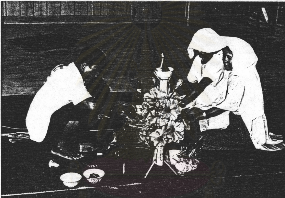
รูปที่ 3 คู่บ่าวสาวชาวชอง ขณะประกอบพิธีแต่งงาน

หลังจากเสร็จพิธีแต่งงานแล้ว คู่บ่าวสาวจะต้องไหว้เถ้าแก่ของทั้งสองฝ่าย เครื่องไหว้ ได้แก่ เนื้อหมู ไหว้หมอบทำพิธี โดยใช้ชาหมูเป็นเครื่องไหว้ แล้วส่งคู่บ่าว-สาวเข้าหอ 39