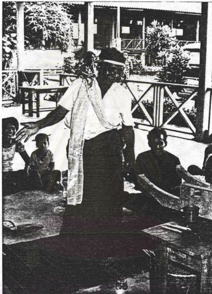
รูปที่ 5 การเล่นเชิฐตีหึ่งของชาวช่อง

ถึงต้นกระเบาใบตก (ซ้ำ) ถึงต้นกระบกกระแบกใหญ่ 49