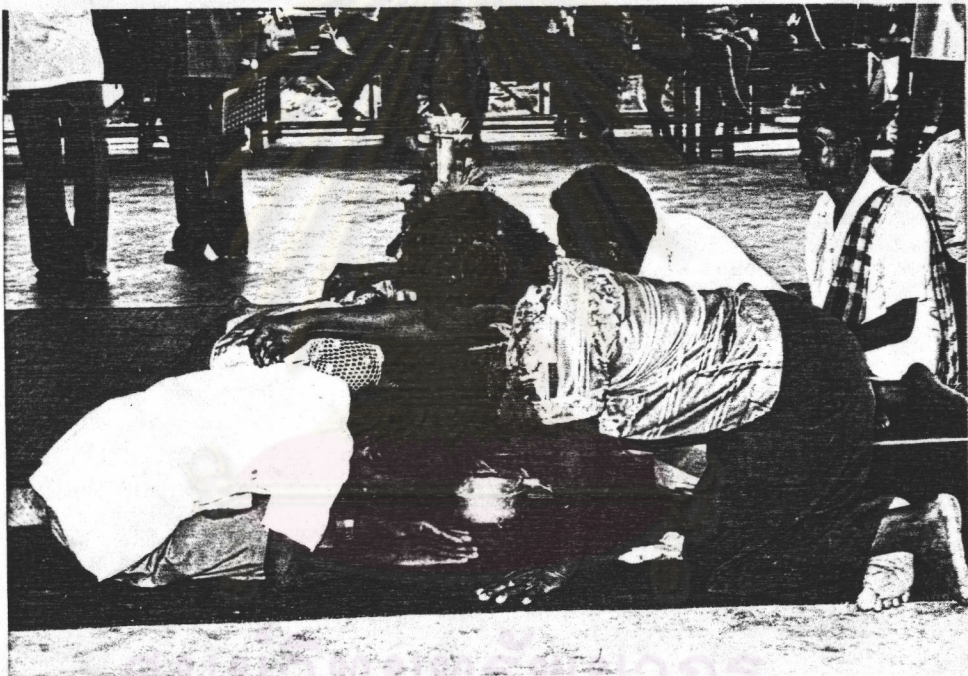
รูปที่ 2 ญาติผู้ใหญ่เอาข้าวสารมาวางไว้ที่หลังคู่บ่าวสาว

การแต่งงานของชาวซองเป็นประเพณีสำคัญที่แตกต่างกับชาวไทย มีการบูชาวิญญาณที่ศักดิ์สิทธิ์ ให้สิ่งศักดิ์สิทธิ์รับรู้ในการแต่งงานนอกจากญาติพี่น้อง จะมีญาติผู้ใหญ่เอาข้าวสารมาวางไว้ที่หลังของเจ้าบ่าวและเจ้าสาวโดยมีความหมายว่า ให้อยู่ดีกินดี ทำมาหากินรุ่งเรืองเหมือนข้าวสารที่เลี้ยงชีวิต มีความก้าวหน้าในการประกอบอาชีพ 34