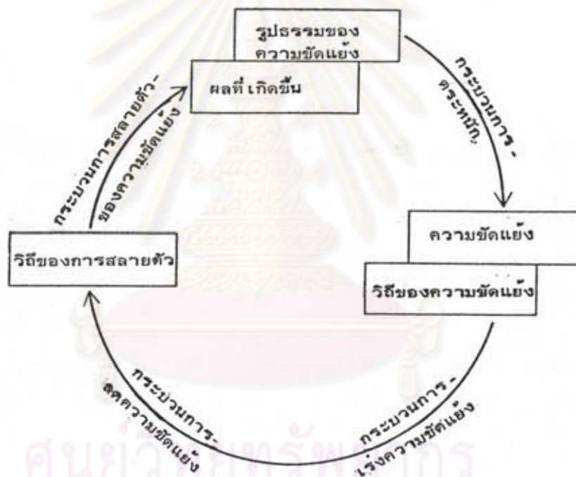
ภาพที่ 1 (วัฏจักรความขัดแย้ง)

จาก Louis Kriesberg, The Sociology of Social Conflict (Englewood Cliffs, N.J. : Prentice Hall, 1973), P. 19.