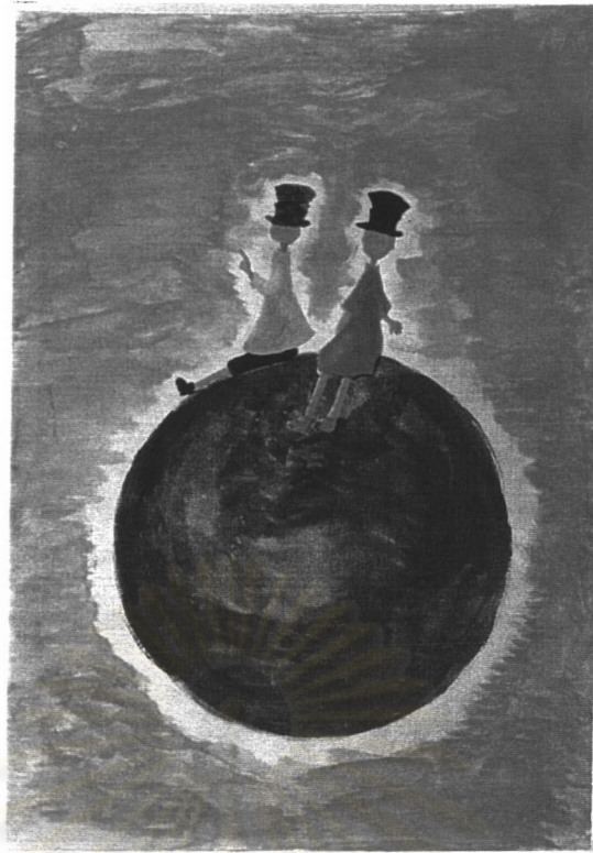
ภาพที่ 6 ลักษณะการใช้สีของเด็กญี่ปุ่นในประเทศญี่ปุ่น ชั้นประถมศึกษาปีที่ 6 เพศหญิง อายุ 11 ปี แสดงลักษณะการผสมสีและระบายสีเพื่อแสดงมิติ เช่น การลงสีแสงเงา การลงสีไล่น้ำหนัก