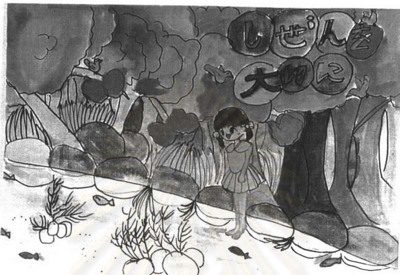
ภาพที่ 2 ลักษณะการวาดภาพคนของเด็กญี่ปุ่นในประเทศญี่ปุ่น ชั้นประถมศึกษาปีที่ 3 เพศหญิง อายุ 9 ปี มีลักษณะของการเน้นความแตกต่างระหว่างเพศด้วยเสื้อผ้า เครื่องแต่งกาย และรายละเอียดอื่น ๆ เช่น ทรงผม เป็นต้น