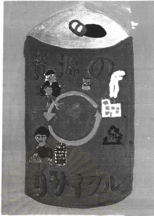
ภาพที่ 8 ลักษณะการออกแบบของเด็กญี่ปุ่นในประเทศญี่ปุ่น ชั้นประถมศึกษาปีที่ 4 เพศชาย อายุ 10 ปี แสดงลักษณะของการรู้จักรูปแบบซึ่งเป็นลักษณะเฉพาะของสิ่งต่าง ๆ และเลือกนำมาเป็นสื่อแสดงเรื่องราวสะท้อนสังคมและสิ่งแวดล้อม