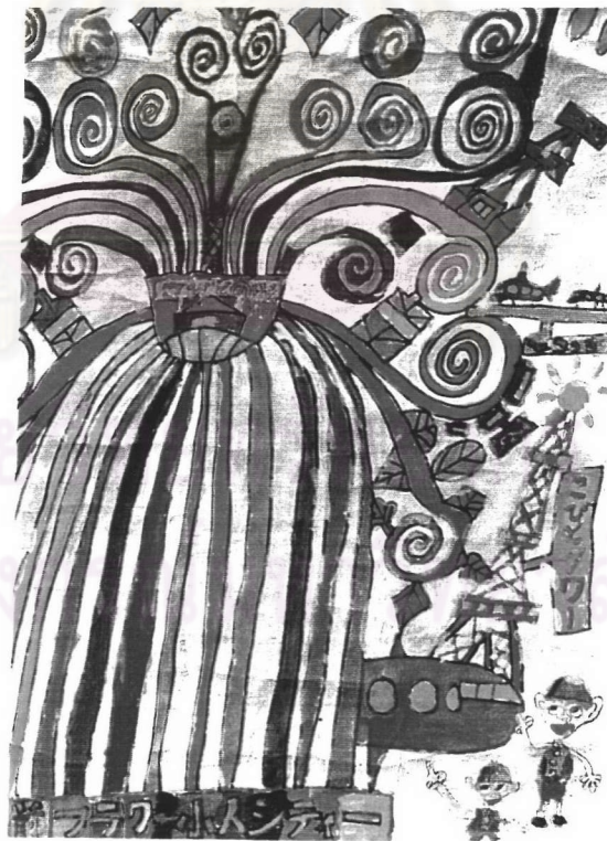
ภาพที่ 9 ลักษณะการออกแบบของเด็กญี่ปุ่นในประเทศไทย ชั้นประถมศึกษาปีที่ 4 เพศชาย อายุ 9 ปี แสดงลักษณะของการประดิษฐ์ตกแต่งรายละเอียดส่วนประกอบในภาพ และมีการใช้จินตนาการ ความคิดสร้างสรรค์ ในการออกแบบเรื่องราวในภาพ