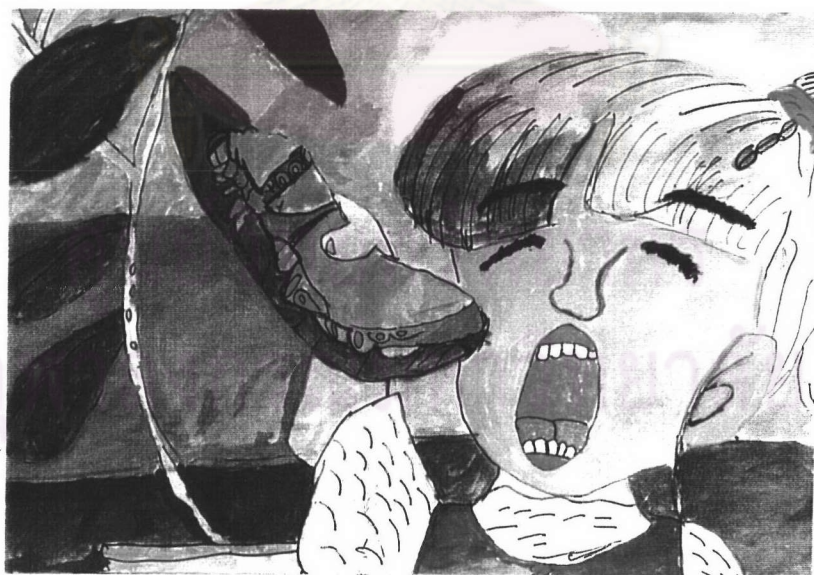
ภาพที่ 3 ลักษณะการวาดภาพคนของเด็กญี่ปุ่นในประเทศไทย ชั้นประถมศึกษาปีที่ 4 เพศหญิง อายุ 10 ปี มีลักษณะของการใช้เส้นต่าง ๆ เพิ่มเติม เพื่อแสดงรายละเอียดของภาพคนและแสดงส่วนต่าง ๆ ของร่างกายให้มีลักษณะคล้ายความเป็นจริงมากขึ้น