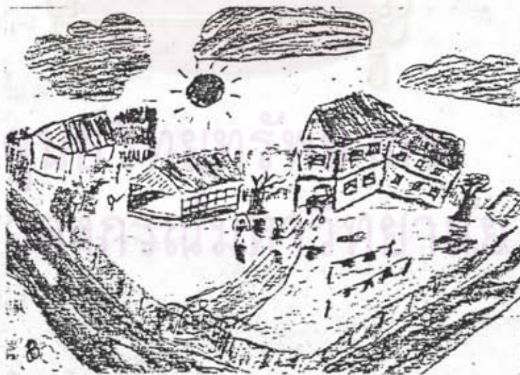
ภาพที่ 18 ลักษณะการใช้พื้นที่ว่างของนักเรียนชั้นประถมศึกษาปีที่ 4 เพศชาย อายุ 10 ปี แสดงลักษณะสามมิติในภาพ