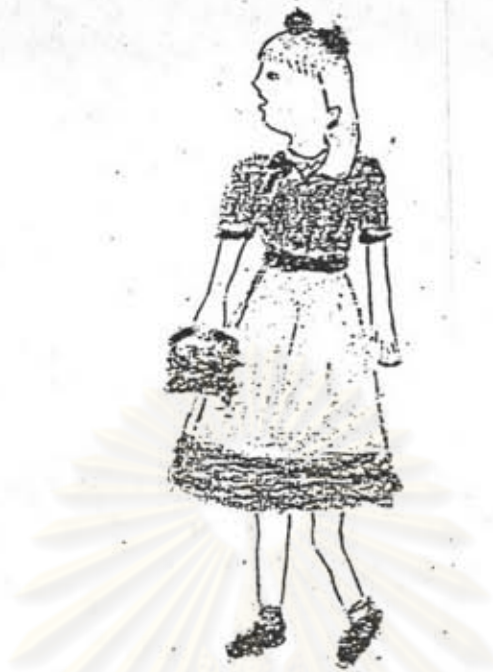
ภาพที่ 17 ลักษณะการวาดภาพคนของนักเรียนชั้นประถมศึกษาปีที่ 4 เพศหญิง อายุ 10 ปี 10 เดือน แสดงลักษณะการเคลื่อนไหวของร่างกาย แต่ยังผิดธรรมชาติและท่าทางแข็งกระด้าง