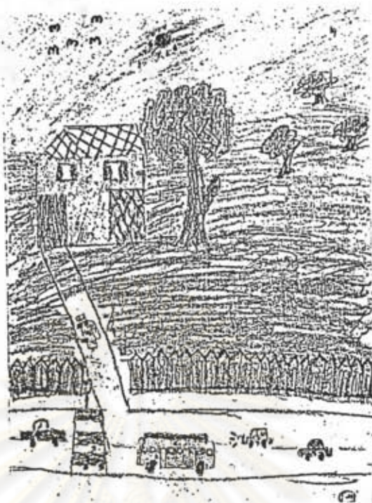
ภาพที่ 21 ลักษณะการออกแบบของนักเรียนชั้นประถมศึกษาปีที่ 4 เพศหญิง อายุ 10 ปี แสดงรายละเอียดการตกแต่งสิ่งต่าง ๆ ในภาพให้สมบูรณ์ยิ่งขึ้น