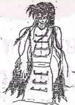
ภาพที่ 16 ลักษณะการวาดภาพคนของนักเรียนชั้นประถมศึกษาปีที่ 4 เพศชาย อายุ 9 ปี มีลักษณะคล้ายภาพการ์ตูนในภาพยนตร์โทรทัศน์