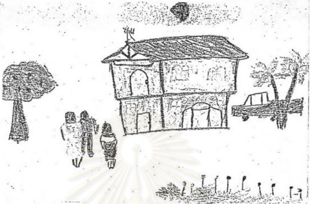
ภาพที่ 19 ลักษณะการไร้พื้นที่ว่างของนักเรียนชั้นประถมศึกษาปีที่ 4 เพศหญิง อายุ 10 ปี แสดงลักษณะการจัดวางภาพโดยทำให้ซ้อนเหลื่อมกัน