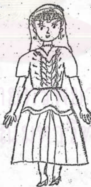
ภาพที่ 22 ลักษณะการออกแบบของนักเรียนชั้นประถมศึกษาปีที่ 4 เพศหญิง อายุ 10 ปี แสดงรายละเอียดการตกแต่งเสื้อผ้า เครื่องแต่งกาย และเครื่องประดับ