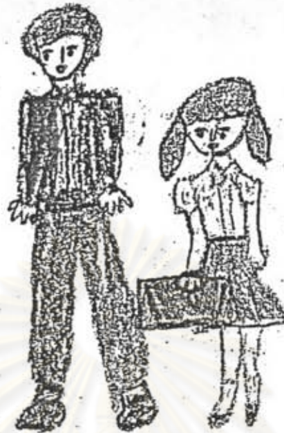
ภาพที่ 15 ลักษณะการวาดภาพคนของนักเรียนชั้นประถมศึกษาปีที่ 4 เพศหญิง อายุ 11 ปี 3 เดือน มีลักษณะแข็งทื่อ