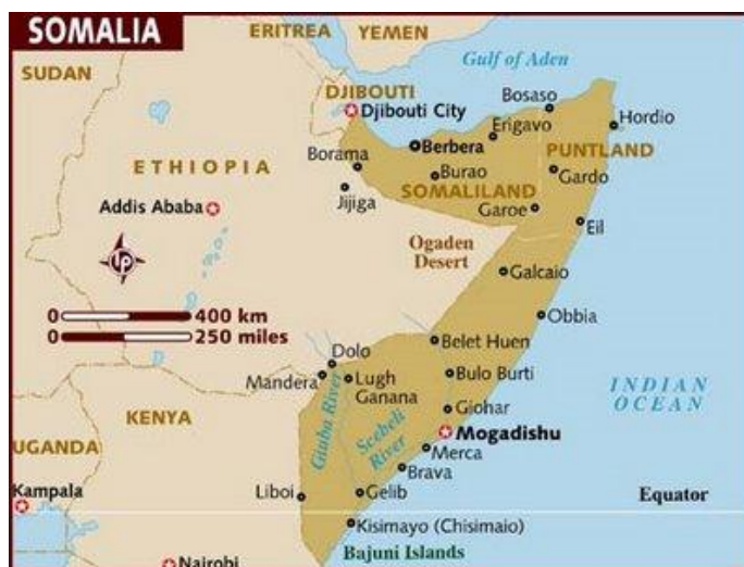
ภาพที่ 1 แผนที่ประเทศโซมาเลีย 1

สามารถที่จะยุติปัญหาดังกล่าวที่เกิดขึ้นได้ เนื่องจากยังไม่มีศักยภาพในการปกครองประเทศอย่าง เต็ดขาดและขาดกองกำลังที่เข้มแข็งพอที่จะรวมประเทศได้