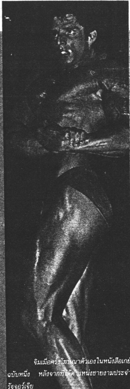
จิมเมื่อครั้งไม่ใช่นาตัวเองในหนังสือเกย์ฉบับหนึ่ง หลังจากที่เขาได้ตำแหน่งชายงามประจำรัฐจอร์เจีย