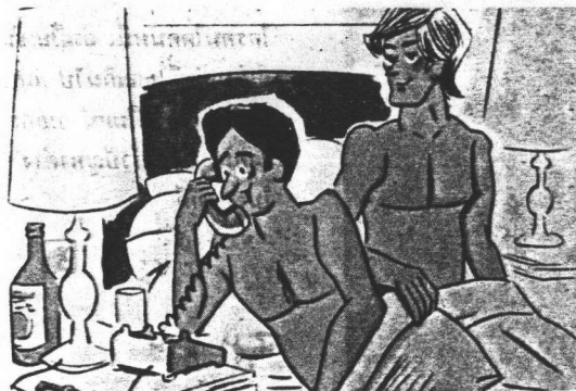
ภาพที่ 7 และ 8 แสดงภาพการ์ตูนในสื่อสิ่งพิมพ์สำหรับชายรักร่วมเพศ

เมื่อไปถึงก็ประมาณบ่ายมากแล้วคนงานที่เขาไปรับจ้างทำไร่ก็เริ่มทยอยกลับที่พักกันซึ่งก็มีหนุ่ม 5-6 คนเดินมาทางเดียวกับผมในจำนวนนั้นก็มีเขาคนนั้นด้วย ซึ่งผมแอบชอบอยู่ในใจแต่แลเห็นเลยทีเดียว แต่ก็ได้แต่ชอบเพราะไม่รู้ว่าเป็นใคร แต่พอมาถึงบ้านพี่สาวจึงได้รู้ว่าหนุ่มพวกนั้นเป็นคนงานในไร่ของพี่สาวผมนี่เอง ผมก็เลยแอบปลื้มใจมาก พอดตกค่ำ