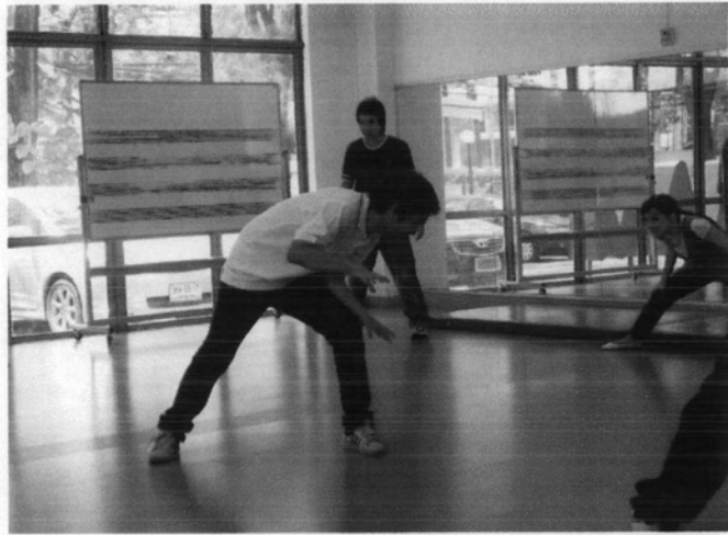
การทำแบบฝึกหัดเพื่อละลายพฤติกรรมในการเรียนการแสดง