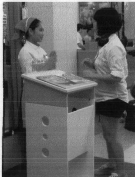
การให้คำแนะนำทางการแสดงกับนักแสดงในวันที่มีการถ่ายทำจริง