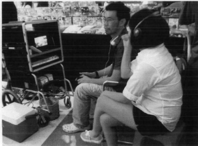
การปรึกษาร่วมกับผู้กำกับในขณะที่มีการถ่ายทำจริง

ประมวลภาพจากการสังเกตการณ์ในการฝึกสอนการแสดงในขั้นตอนของการดูแลและแก้ปัญหา ทางการแสดง ณ วันที่มีการถ่ายทำจริง