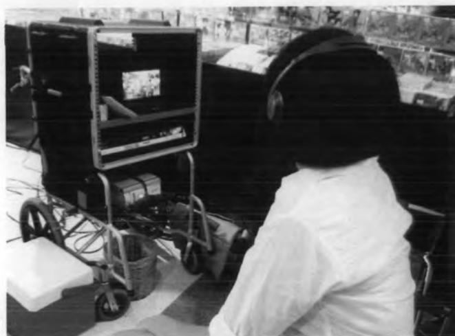
การสังเกตการณ์ในขณะที่นักแสดงกำลังแสดงผ่านจอมอนิเตอร์