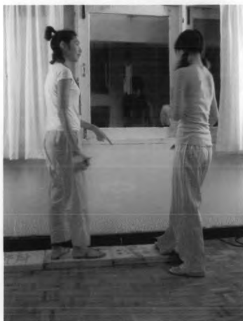
การให้คำแนะนำทางการแสดงกับนักแสดง ในวันที่มีการถ่ายทำจริง