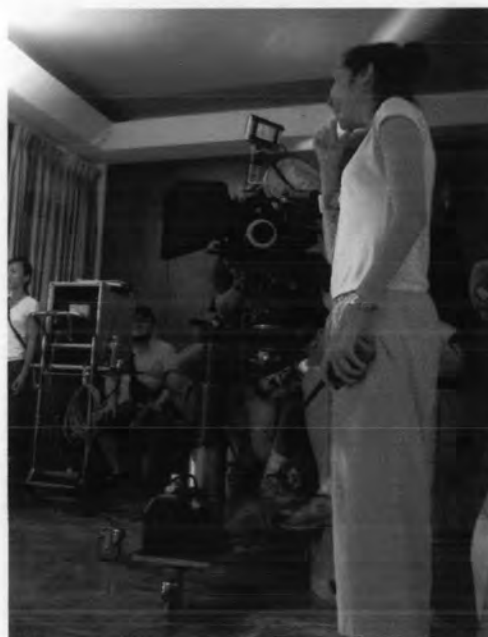
การสังเกตการณ์ในขณะที่นักแสดงกำลังแสดง อยู่