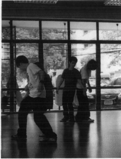
การทำแบบฝึกหัดเพื่อฝึกการสื่อสารทางร่างกายของนักแสดง