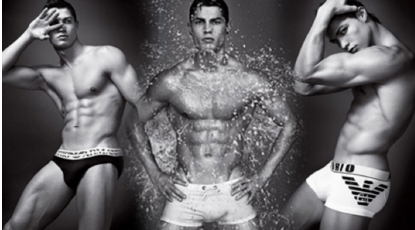
ภาพที่ 2 ตัวอย่างภาพนิวมैनแบบ 'หลงตัว'