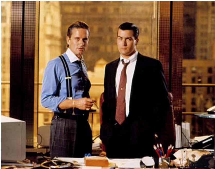
ภาพที่ 3 ตัวอย่างภาพนิวมैनแบบ 'หลงตัว'