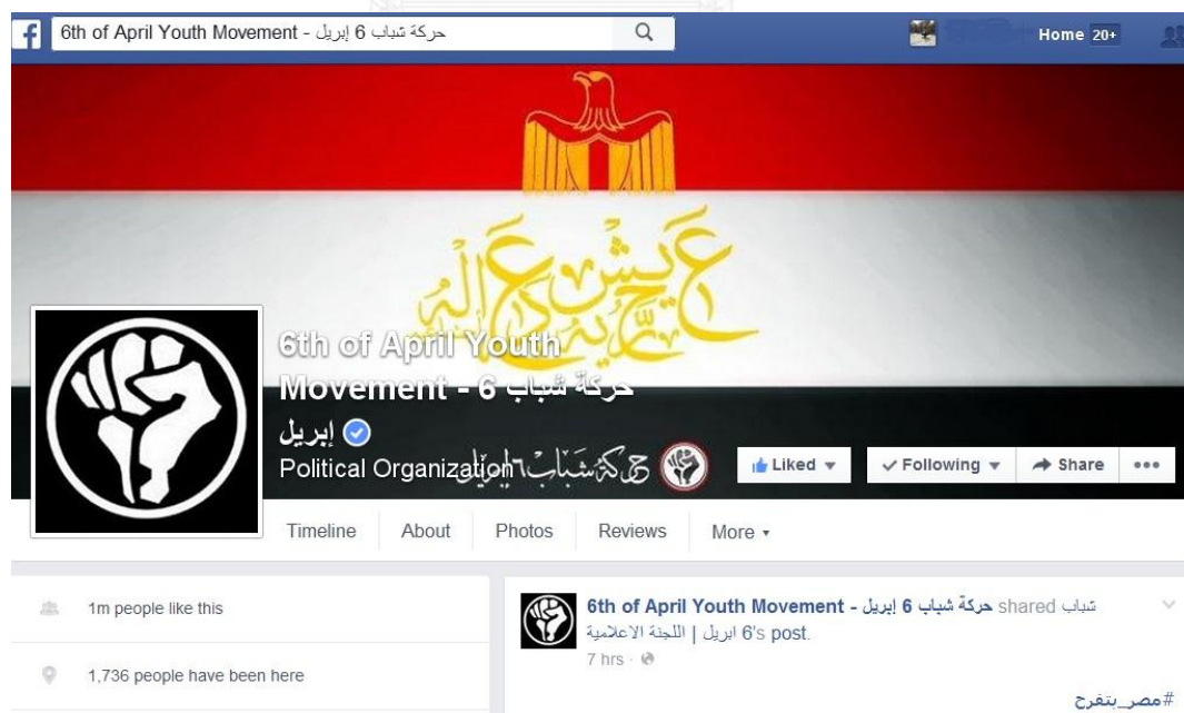
ภาพที่ 2: Facebook Page ของขบวนการเยาวชน 6 เมษายน “6 th of April Youth”