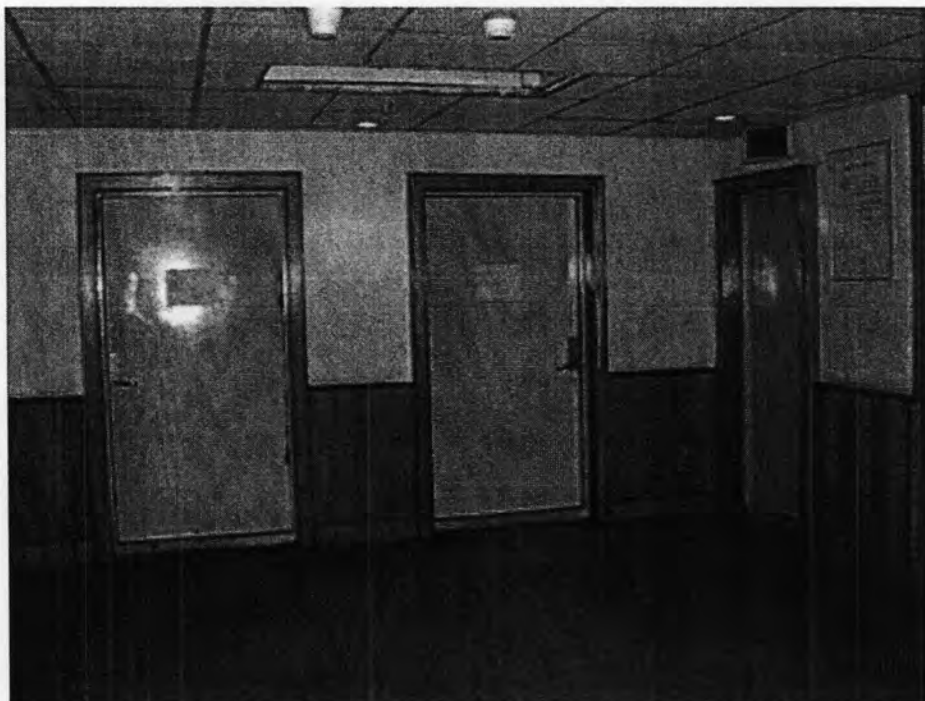
ห้องจัดรายการที่แต่ละสถานีภาคภาษาของศูนย์เอเชีย 2 สามารถมาลงชื่อใช้ได้