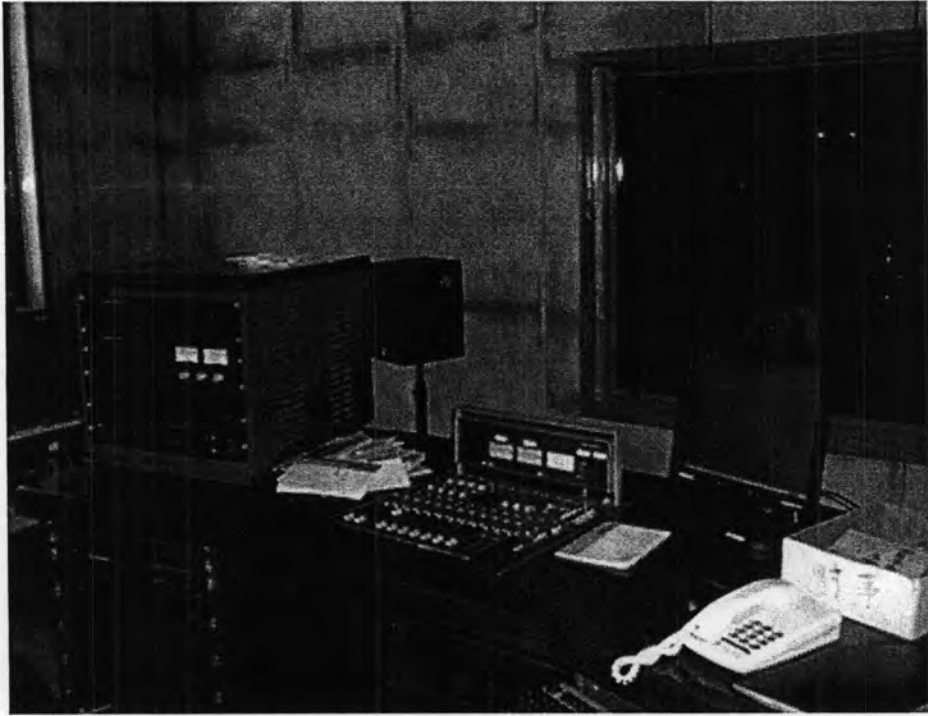
ภายในห้องอัดรายการ