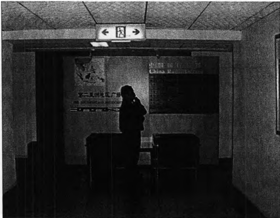
บริเวณด้านหน้าศูนย์เอเชีย 2