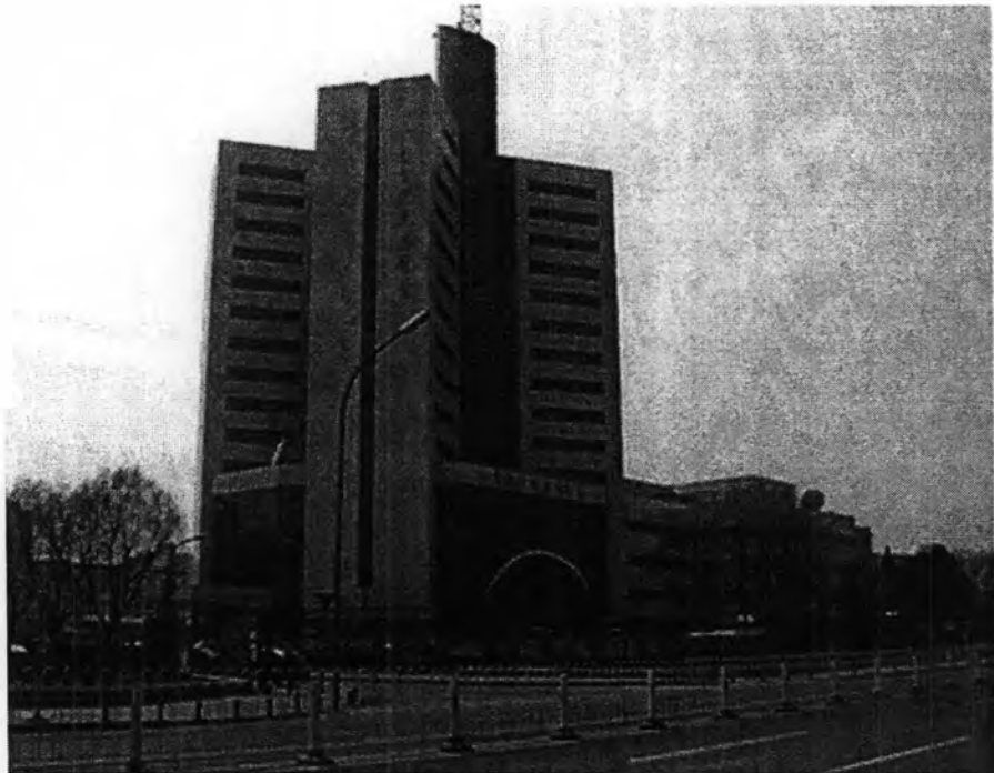
สถานีวิทยุซีอาร์ไอ