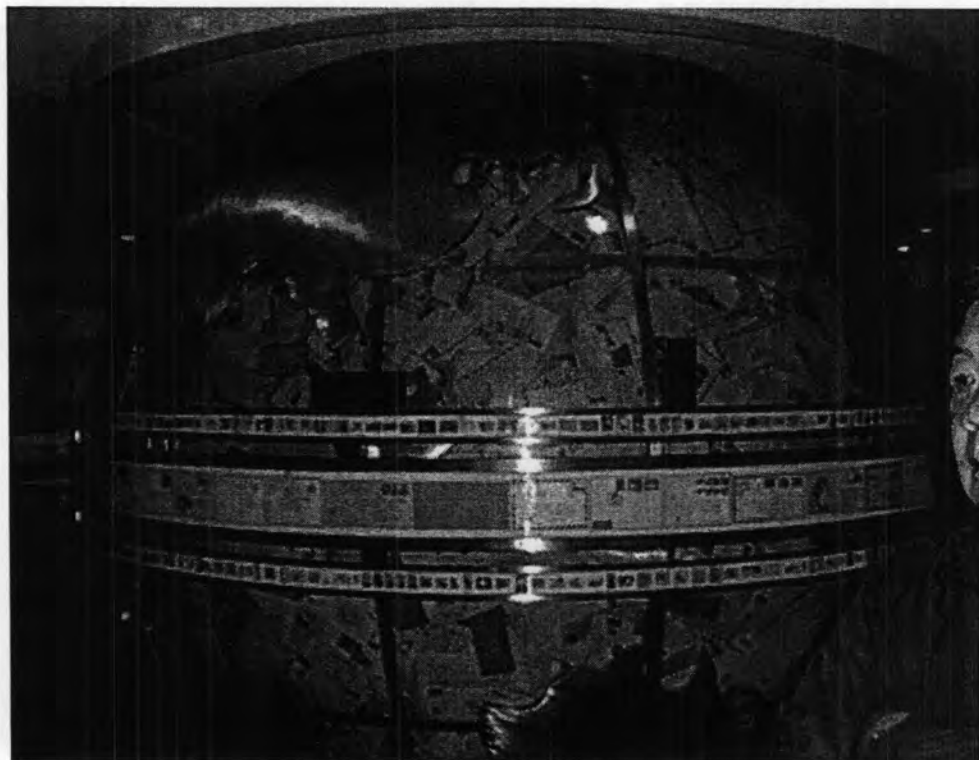
จดหมายจากผู้ฟังทั่วโลก