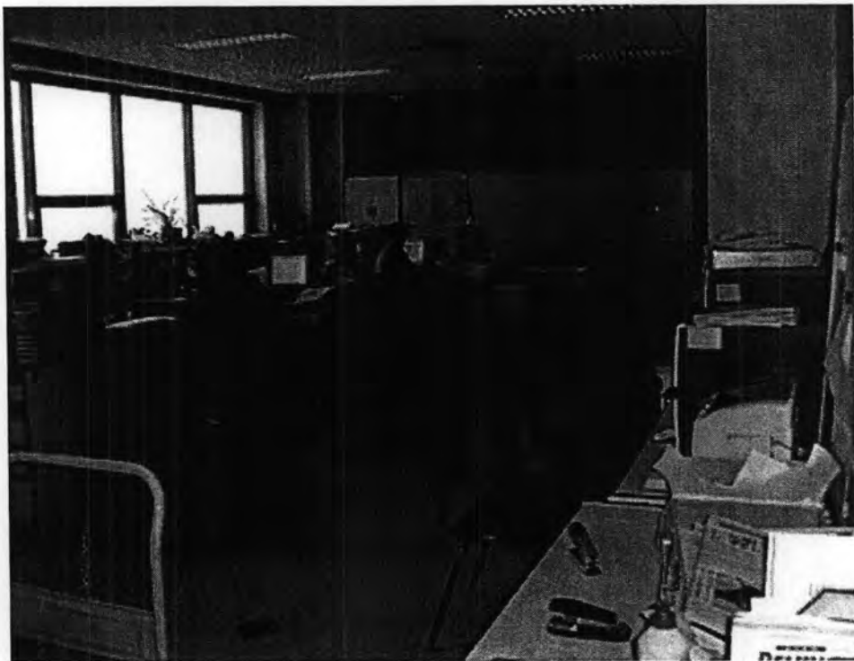
สำนักงานของสถานีภาคภาษาไทย