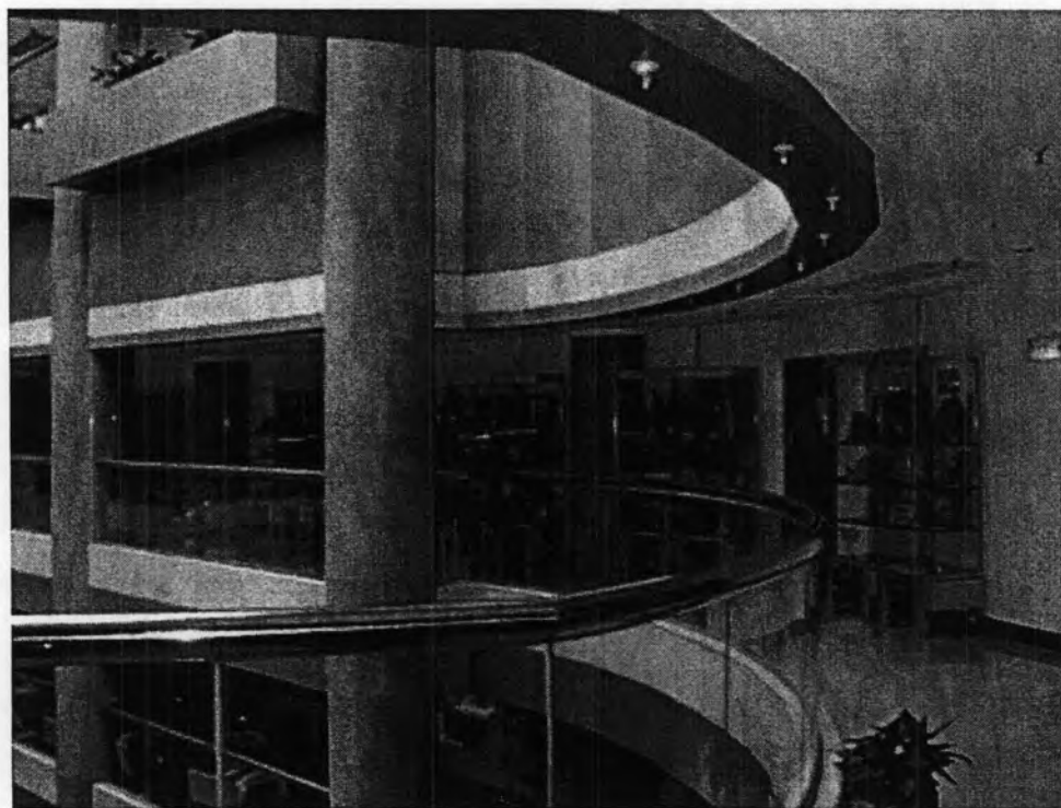
ที่จัดแสดงของที่ระลึกจากผู้ฟังสถานีภาคภาษาต่างๆ