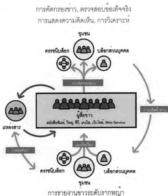
ภาพที่ 3 แสดงการเกิดขึ้นของระบบสื่อ (The Emerging of media ecosystem)

Hiler, J. (อ้างถึงใน Bowman และ Willis, อ้างแล้ว)