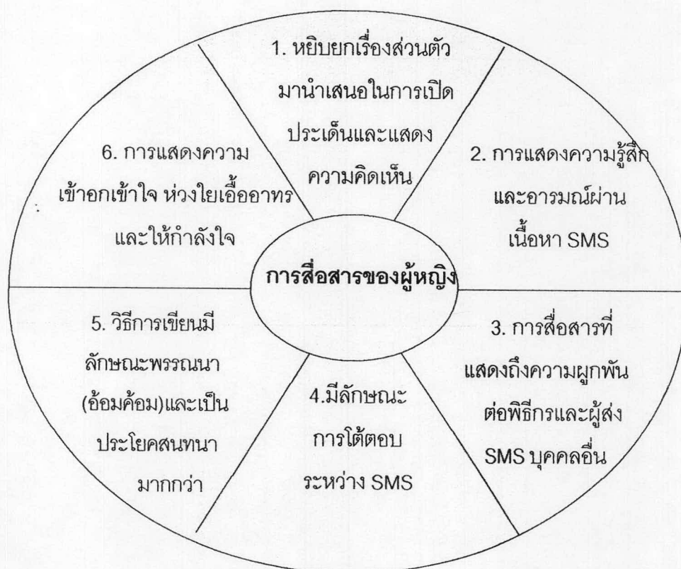
รูปภาพที่ 19 แสดงคุณลักษณะวิธีการสื่อสารของเพศหญิงในรายการเล่าข่าวสำหรับสตรี

ทั้งนี้ สามารถแยกคุณลักษณะวิธีการสื่อสารของเพศหญิง ได้ดังนี้