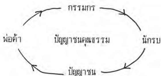
ภาพแสดงวัฏจักรสังคม

วัฏจักรสังคมนั้น จะมีการหมุนเวียนเปลี่ยนไป คนกลุ่มหนึ่งๆ จะ ผลัดกันเป็นผู้นำสังคม และเมื่อผู้นำในแต่ละยุคเริ่มที่จะเอาเปรียบและมีความเห็นแก่ตัวกัน มากขึ้น การปฏิวัติเปลี่ยนแปลงการปกครองก็จะเป็นสิ่งที่หลีกเลี่ยงไม่ได้ การปฏิวัติของ ชนชั้นแรงงานนั้นจะเกิดขึ้นเมื่อ กลุ่มนักรบและกลุ่มปัญญาชนเริ่มทนต่อสภาพของสังคมและ สถานการณ์ในการเป็นกรรมกรจำยอม ภายใต้ความบีบคั้นทางด้านเศรษฐกิจของชนชั้นพ่อ- ค้าต่อไปไม่ได้ อำนาจของความมั่งคั่ง จะไม่สามารถสยบนักรบและปัญญาชนที่ไม่มี ธรรมชาติดแบบกรรมกรได้ตลอดไป เมื่อความขัดแย้งในใจของกลุ่มกรรมกรจำยอมเกิดขึ้น อย่างเต็มที่ ก็จะนำไปให้เกิดการปฏิวัติของชนชั้นกรรมาชีพขึ้น (Shudra Revolution) แล้ววัฏจักรสังคมก็จะเริ่มรอบใหม่ ยุคสมัยของสังคมนั้นมีการหมุนเวียนเปลี่ยนแปลงไป เรื่อยในประวัติศาสตร์มนุษย์ ดังภาพต่อไปนี้คือ