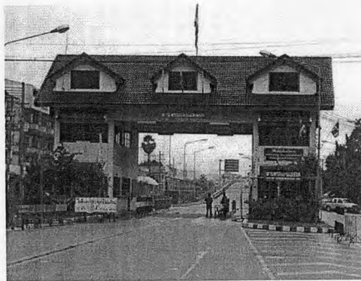
รูปภาพที่ 3.1 ด้านพรมแดนแม่สอดปัจจุบัน

นับเป็นระยะเวลาที่เนิ่นนานแล้วที่บริเวณที่เป็นอำเภอแม่สอดในปัจจุบันนั้นได้รับการลงความเห็นว่าเป็นพื้นที่ที่มีความสำคัญเป็นอย่างมาก ในอดีตบริเวณดังกล่าวถือได้ว่าเป็นพื้นที่สำคัญทางเศรษฐกิจ (Trading emporium) และเป็นเส้นทางการค้าขายที่สำคัญแห่งหนึ่งของบรรดาพ่อค้าชาวอินเดียและจีน ที่นำสินค้าเข้ามาขายผ่านทางประเทศพม่า จนกระทั่งแม้ในปัจจุบันบริเวณดังกล่าวจะมีชื่อเรียกอย่างเป็นทางการว่า "เมืองแม่สอด" หากแต่แม่สอด ก็ยังคงมีความสำคัญทางเศรษฐกิจดั้งเดิมมิเปลี่ยนแปลง และที่มากไปกว่านั้น คือ แม่สอด ยังเพิ่มบทบาทความสำคัญทางการเมืองและทางสังคมขึ้นในฐานะเป็นเมืองชายแดนทางด้านตะวันตกของประเทศไทยอีกเมืองหนึ่ง จึงทำให้แม่สอดได้รับความสนใจทั้งจากนักธุรกิจ นักปกครอง นักวิชาการ รวมไปถึงนักท่องเที่ยวที่หลงใหลในเสน่ห์แห่งเมืองที่เต็มไปด้วยความหลากหลายทางสังคมและวัฒนธรรมแห่งนี้