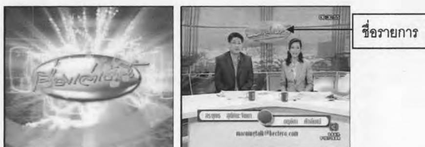
ภาพที่ 1.1 ภาพไตเติ้ลเปิดรายการ เรื่องเล่าเช้านี้

Peritext นั้นคือตำแหน่งที่อยู่ ‘รอบๆ’ ตัวบท ซึ่งมีโครงสร้างหรือลักษณะการนำเสนอที่มากกว่าหรือแตกต่างไปจากตัวบทธรรมดาทั่วไป ได้แก่ ชื่อเรื่อง ชื่อบท คำนำ บรรยายภาพหรือเชิงอรรถ นอกจากนี้ยังครอบคลุมถึงคำอุทิศ รูปประกอบ คำอ้างอิงตอนต้นเรื่อง ซึ่งเป็นสิ่งที่ Genette บอกว่า สิ่งเหล่านี้ส่งผลอย่างมากต่อการตีความตัวบท ส่วน Epitext นั้นคือสิ่งที่ปรากฏอยู่รอบนอก ไกลออกไปจากตัวบท มีบทบาทในการเข้าถึงตัวบทหรือเพื่อกระตุ้นผู้อ่านให้เกิดความสนใจในตัวบท Epitext มาในรูปของความคิดเห็นเกี่ยวกับหนังสือ คำวิจารณ์ บทสัมภาษณ์ การกล่าวถึงผลงานที่ผ่านมาของผู้เขียนหนังสือเล่มนี้ จุดหมาย หรือบทวิพากษ์วิจารณ์เกี่ยวกับงานเขียนชิ้นนั้นๆ เป็นต้น ผู้วิจัยเห็นว่า ลักษณะของตัวบท เช่น ชื่อเรื่อง ก็น่าจะเทียบเท่ากับไตเติ้ลชื่อรายการในงานสื่อโทรทัศน์