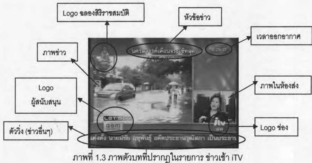
ภาพที่ 1.3 ภาพตัวบทที่ปรากฏในรายการ ข่าวเช้า iTV

ในการวิจัยครั้งนี้ ผู้วิจัยเลือกศึกษารายการเล่าข่าวเช้า 4 รายการจาก 4 สถานี คือ รายการ เรื่องเล่าเช้านี้ ออกอากาศทางสถานีโทรทัศน์ไทยทีวีสีช่อง 3 อ.ส.ม.ท. ทุกวันจันทร์-ศุกร์ เวลา 6.30-8.45 น., รายการ สถานีสนามเป้า ออกอากาศทางสถานีวิทยุโทรทัศน์กองทัพบกช่อง 5 ทุกวันจันทร์-ศุกร์ เวลา 7.40-9.00 น., รายการ จมูกมด ออกอากาศทางสถานีวิทยุโทรทัศน์สี กองทัพบกช่อง 7 ทุกวันจันทร์-ศุกร์ เวลา 6.30-8.45 น. และรายการ ข่าวเช้า iTV ออกอากาศทาง สถานีโทรทัศน์ iTV ทุกวันจันทร์-ศุกร์ เวลา 6.15-7.30 น. ส่วนอีก 2 สถานี คือ สถานีโทรทัศน์ โมเดิร์นไนน์ทีวี (ช่อง 9) และสถานีโทรทัศน์กรมประชาสัมพันธ์ช่อง 11 รายการข่าวเช้าจะเป็น รายการข่าวที่มีลักษณะของการรายงานข่าว ไม่ใช่การเล่าข่าว ดังนั้น ผู้วิจัยจึงไม่นำมาวิเคราะห์ในงานวิจัยนี้