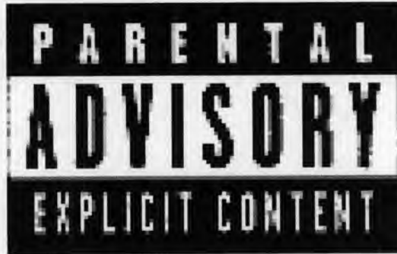
ภาพที่ 1.2 ภาพ Parental Advisory Explicit Content

โดยส่วนใหญ่เนื้อหาเพลงฮิปฮอปในต่างประเทศนั้นจะเน้นไปที่ ชีวิตอันธพาลข้างถนน (Gang Violent), เกียดผู้หญิง (Misogyny), เกียดกะเทย (Homophobia), ต่อต้านระบบ (Anti-Semitism) และ โจมตีกฎหมาย (Nihilism) แต่ระยะหลังเริ่มรุนแรงน้อยลง มีเนื้อหาทั่วไปที่ไม่คำทอ กระตุ้นความเกลียดชังระหว่างมนุษย์มากอย่างเดิม แต่ปรับเป็นเพลงเพื่อปาร์ตี้ เฮฮาสนุกสนานเข้ามามากขึ้น ขณะเดียวกันก็เกิดแร็ป ลามก พุดเรื่องการร่วมเพศมากขึ้น