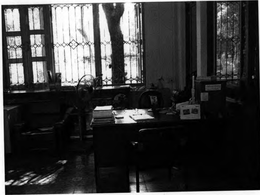
โต๊ะให้คำปรึกษาของเจ้าหน้าที่ประจำศูนย์