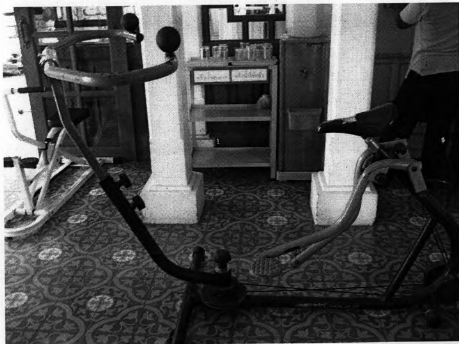
เครื่องออกกำลัง