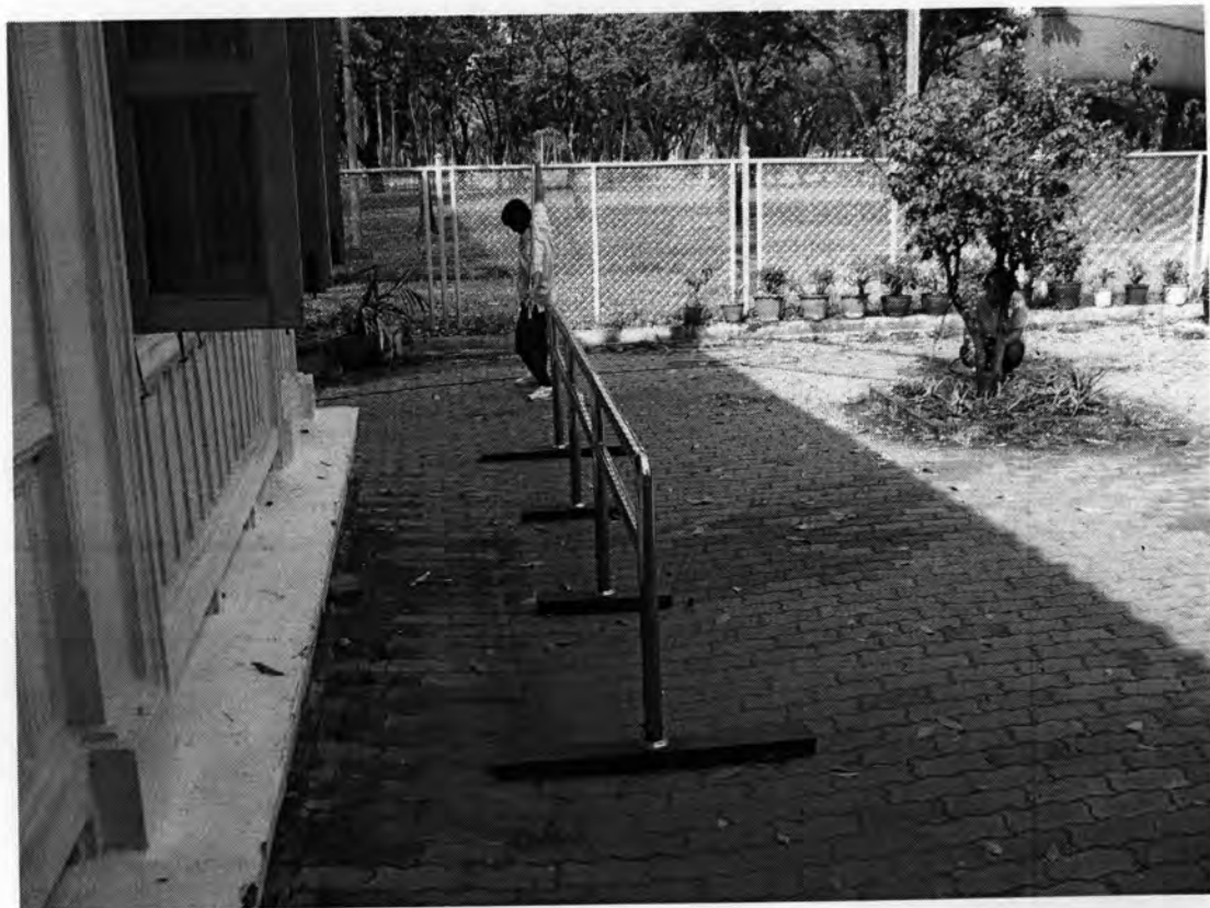
ราวจับออกกำลังกาย