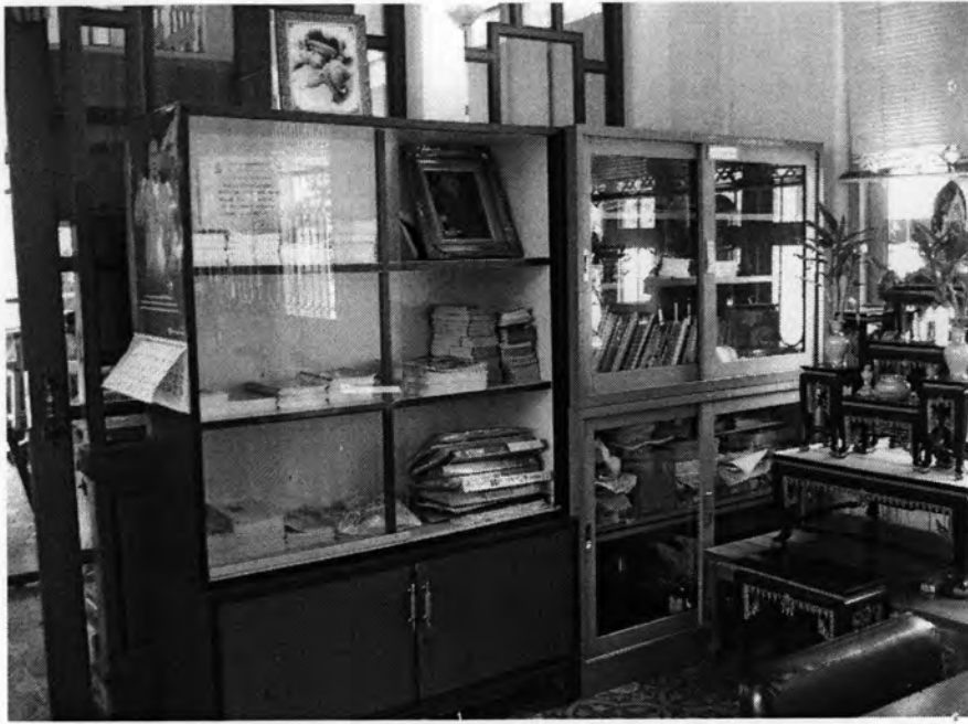
ตู้หนังสือ