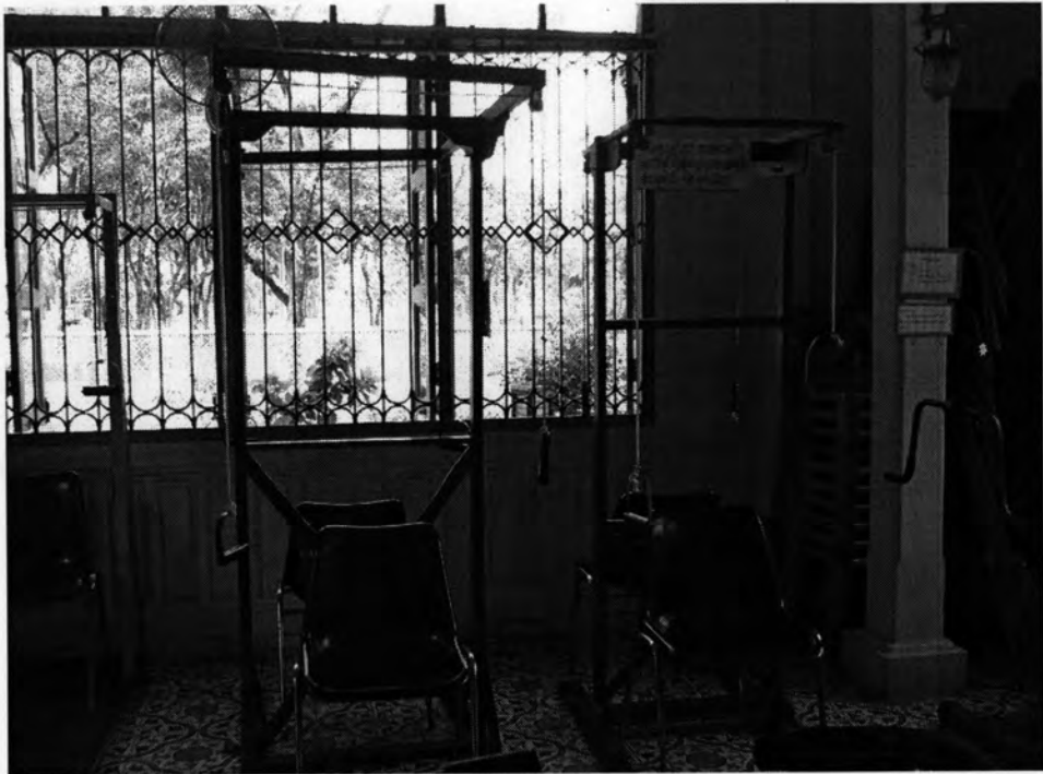
ที่ชั่งแขน