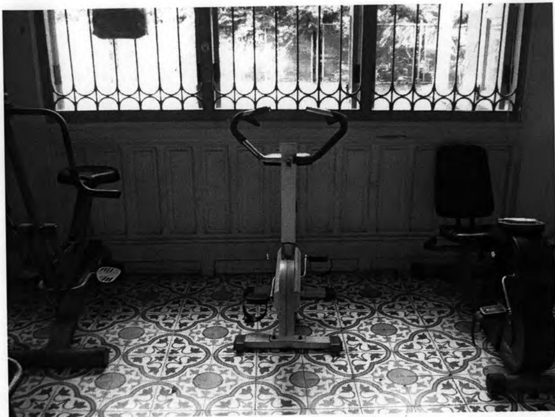
เครื่องปั่นจักรยาน