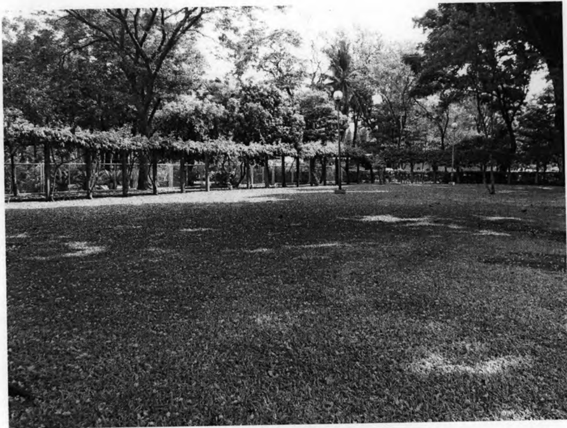
สนามหญ้าสำหรับซิ่ง ว่ายน้ำต๋นกง รำกระบอง