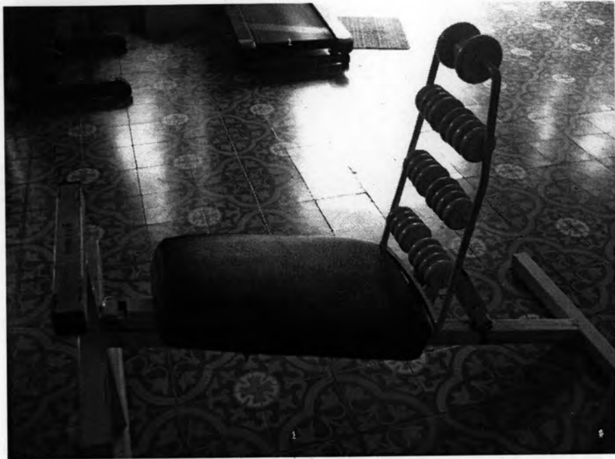
เครื่องนวดหลัง