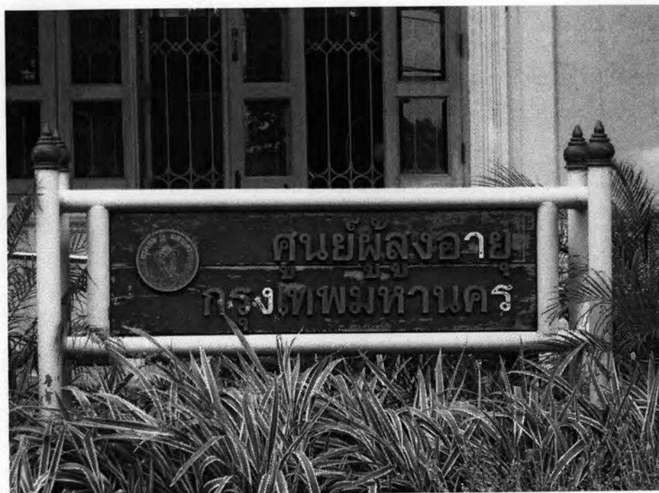
ศูนย์สุขภาพผู้สูงอายุกรุงเทพมหานคร สวนลุมพินี