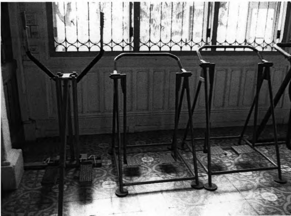
เครื่องแกว่งเท้า