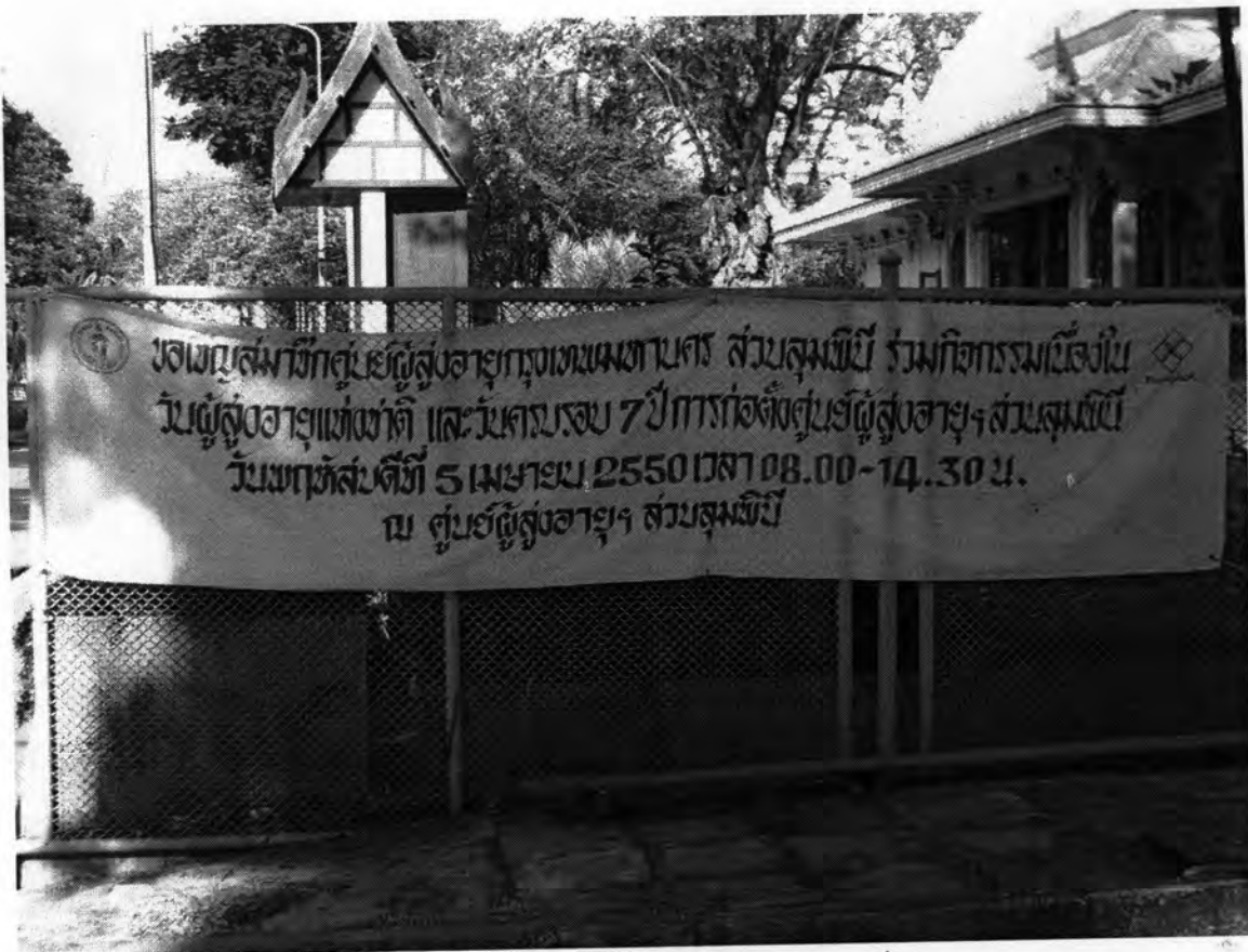
งานประจำปีครบรอบการก่อตั้งศูนย์ผู้สูงอายุกรุงเทพมหานคร สวณดุสิต