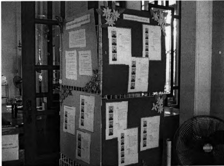
บอร์ดอธิบายการออกกำลังกาย