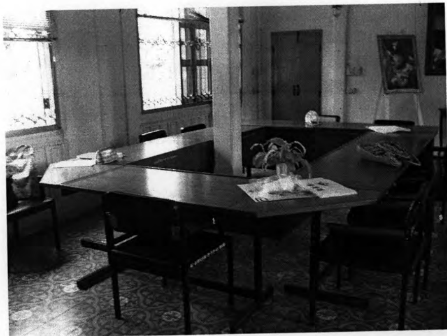
โต๊ะอ่านหนังสือของผู้สูงอายุ