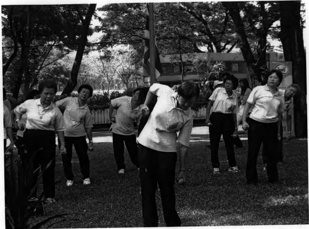
การแสดงท่าการออกกำลังกายประกอบดัมเบลขวดน้ำ