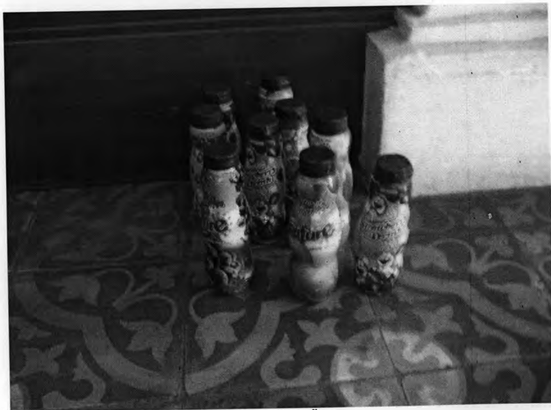
ดัมเบลขวดน้ำ