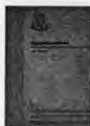
รูปที่ 9 ภาพหนังสือ เรียนดนตรีอย่างไรถึงจะดี จัดพิมพ์เมื่อ พ.ศ.2532

ผลงานการเป็นนักวิชาการด้านดนตรีของครูสมภพ ข้าประเสริฐ