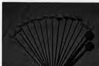
รูปที่ 13 ภาพไม้ตีระนาดเอก,ระนาดทุ้มและไม้ตีฆ้องวงที่ครูสมภพ ข้าประเสริฐได้ผลิตขึ้น

นอกจากครูสมภพ ข้าประเสริฐ จะมีความสามารถในการทำไม้ตีเครื่องเป่าพาทย์ชนิดต่างๆ แล้ว ท่านและภรรยาของท่าน ครูประจิต ข้าประเสริฐ ยังมีความสามารถในการเป็นช่างเย็บปักเครื่องโขนละคร สามารถประกอบเป็นอาชีพเสริม สร้างรายได้ให้กับครอบครัวได้อีกทางหนึ่ง และ