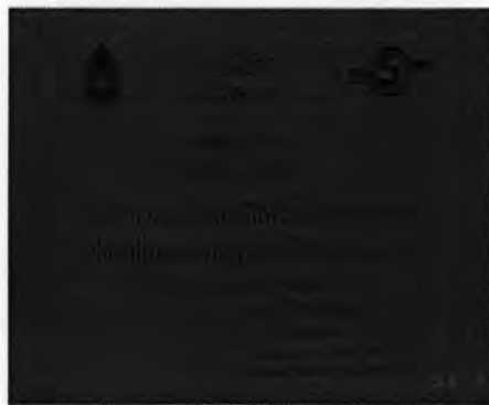
รูปที่ 10 ภาพเกียรติบัตรของครูสมภพ ขำประเสริฐ เมื่อได้รับเชิญให้ไปเป็นกรรมการตัดสินการประกวดดนตรีไทย

6.4 เป็นกรรมการตัดสินในการประกวดดนตรีไทยเพื่อความมั่นคงของชาติ เนื่องในโอกาสสมโภชกรุงรัตนโกสินทร์ 200 ปี