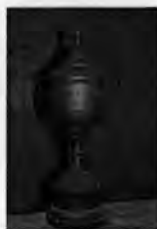
รูปที่ 7 ภาพถ้วยรางวัลชนะเลิศปี่พาทย์ประชันวง ในงานพิธีไหว้ครูของสมาคมสงเคราะห์สหายศิลปิน (วัดพระพิเรนทร์) เมื่อ พ.ศ. 2517