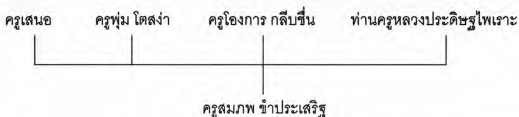
รูปที่ 6 ภาพแผนภูมิแสดงสายการศึกษาดนตรีของครูสมภพ ข้าประเสริฐ

พ.ศ. 2489 ขณะอายุได้ 21 ปี เรียนเปียโนกับท่านครูหลวงประดิษฐไพเราะ