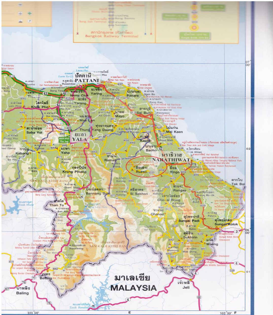
ภาพที่ 2: แผนที่แสดงเขตเทือกเขา (พื้นที่สีน้ำตาล) ในพื้นที่จังหวัดชายแดนภาคใต้ซึ่งมักเป็นฐานที่มั่นของกองกำลังติดอาวุธต่อต้านรัฐในขณะนั้น

ที่มา: เรืองเดียวกัน. (ในวงสีแดงคือที่ตั้งของเทือกเขาบูโด ซึ่งต่อมารัฐบาลได้จัดตั้งเป็นอุทยานแห่งชาติบูโด)