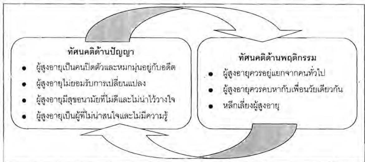
รูปภาพที่ 6.1 ความสัมพันธ์ระหว่างปัจจัยทั้ง 7 ด้านของทัศนคติที่มีต่อผู้สูงอายุ

รูปภาพที่ 6.1 แสดงความสัมพันธ์ระหว่างทัศนคติด้านพฤติกรรมและทัศนคติด้านปัญญา โดยทัศนคติด้านปัญหาส่งผลต่อทัศนคติด้านพฤติกรรม และในทางกลับกันทัศนคติด้านพฤติกรรมก็ส่งผลต่อทัศนคติด้านปัญญา ดังนั้น แนวทางในการแก้ไขจึงควรเริ่มต้นจากการปรับพฤติกรรมของผู้สูงอายุก่อน โดยอาศัยการสร้าง ความเข้าใจให้แก่ตัวผู้สูงอายุเอง เช่น การอบรมและให้ความรู้เกี่ยวกับลักษณะของผู้สูงอายุที่พึงประสงค์ของคนทั่วไป แล้วจึงส่งเสริมให้ผู้สูงอายุมีโอกาสในการเข้าร่วมกิจกรรมสังคมมากขึ้น