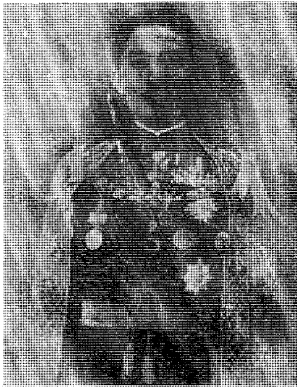
เจ้าพระยาสุรเสหวิชัยภูศกต