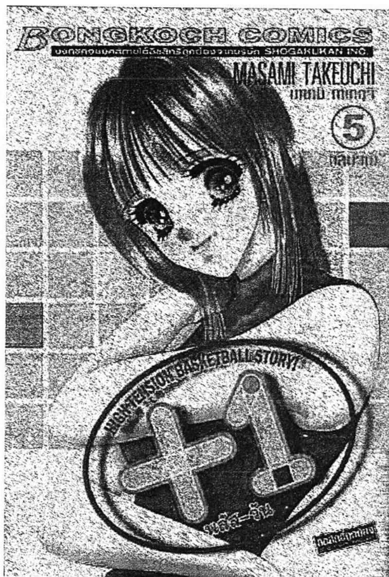
3. การ์ตูนเรื่อง “พลัสวัน” (+1)