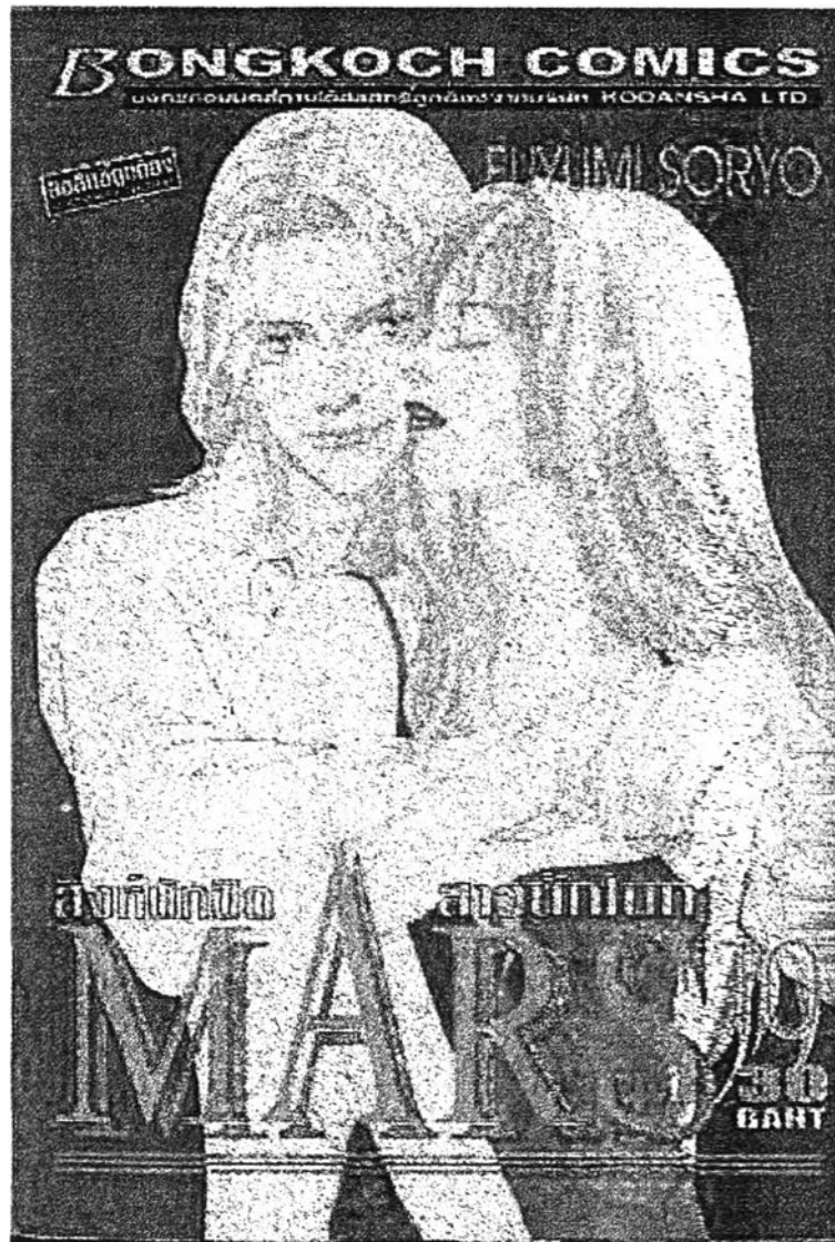
1. การ์ตูนเรื่อง "สิงห์นักบิด สาวนักโบก" (Mars)

ตัวอย่างการ์ตูนทั้ง 6 เรื่องที่นำมาศึกษาวิจัย