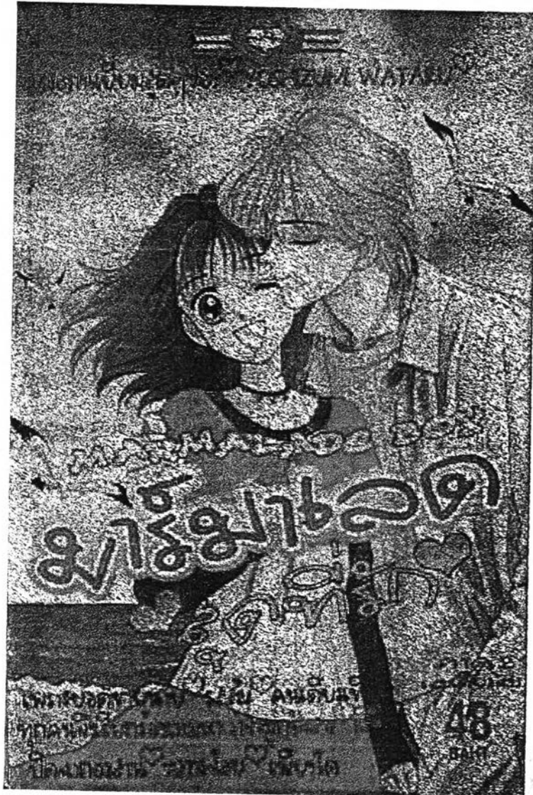
4. การ์ตูนเรื่อง "มาร์มาเลตสุดที่รัก" (Marmalade Boy)