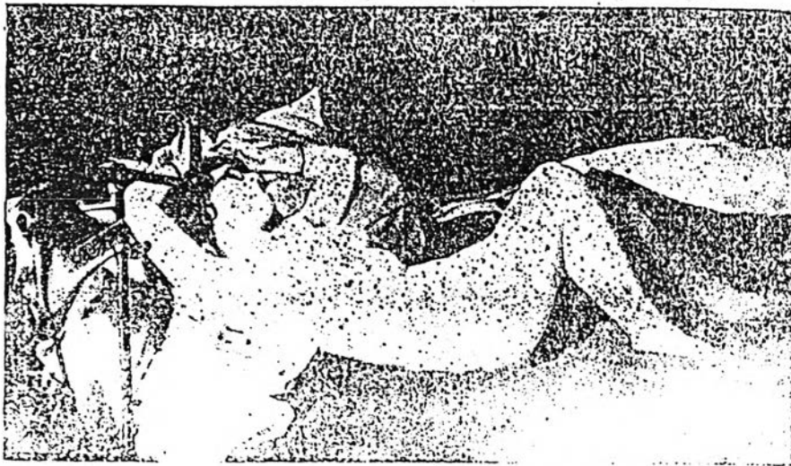
ถ้าเป็น... คำนวณและของรางวัลที่กลลกลามา จะตั้งรับใน... ที่สักกัจเจต...