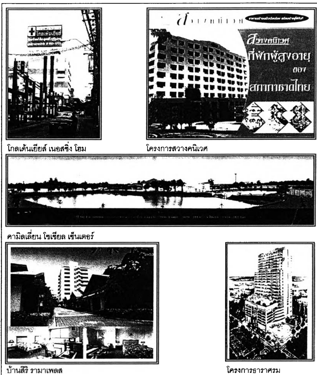
ภาพที่ 1-2 แสดงรูปแบบที่อยู่อาศัยประเภทต่าง ๆ สำหรับผู้สูงอายุในประเทศไทย

แต่ในประเทศไทยนั้น แม้จะเกิดแนวความคิดในการพัฒนาที่อยู่อาศัยสำหรับผู้สูงอายุอย่างมากมาย แต่การพัฒนาที่อยู่อาศัยสำหรับผู้สูงอายุโดยเฉพาะโดยภาคเอกชนยังเกิดขึ้นไม่มากนัก ส่วนใหญ่การพัฒนายังเป็นลักษณะของสถานพยาบาล เช่น โรงพยาบาลกล้วยน้ำไท 2 บนถนนสุขุมวิท 68 และ โกลเด้นเวิลด์ เนอสซิ่ง โฮม บนถนนสุทธิสาร นอกนั้นจะเป็นโครงการกึ่งสังคมสงเคราะห์ เช่น คามิลเลียน โซเซียล เซ็นเตอร์ ที่นครปฐม และจันทบุรี โครงการสวางคนิเวศ ของสภาอากาศไทย ที่สมุทรปราการ หรือโครงการลักษณะโรงแรมรีสอร์ท เช่น บ้านสิริราม่า เฟลส บนถนนพัฒนาการ แต่ลักษณะที่เป็นชุมชนที่พักอาศัยสำหรับผู้สูงอายุที่สร้างขึ้นโดยเฉพาะสำหรับผู้สูงอายุที่ยังมีสุขภาพแข็งแรงคล้ายของต่างประเทศยังไม่มี ซึ่งปรากฏการณ์ดังกล่าวอาจบ่งบอกถึงลักษณะของผู้สูงอายุไทยที่มีความแตกต่างจากผู้สูงอายุต่างชาติ