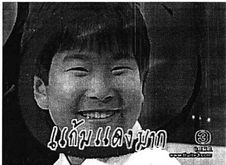
ภาพที่ 7 การใช้เทคนิคในการตัดต่อและใช้คอมพิวเตอร์กราฟิก

รายการสมาคมชมดาวเป็นรายการสนทนาบันเทิงที่มีการใช้เทคนิคการตัดต่อและคอมพิวเตอร์กราฟิกมาก เพื่อดึงดูดใจและสร้างความแปลกใหม่ให้กับรายการ และเพื่อเน้นความรู้สึก สร้างความสนุกสนาน เช่น สัปดาหที่น้องพลับมาร่วมรายการ มีการเชิญทยา โรเจอร์ ซึ่งเป็นดาราคณโปรดของน้องพลับออกมา และใช้เอฟเฟคหยุดภาพและใช้วงกลมสีแดงวงหนำน้องพลับ พร้อมกับขึ้นตัวหนังสือว่า "แค้นแดงมาก !!! "