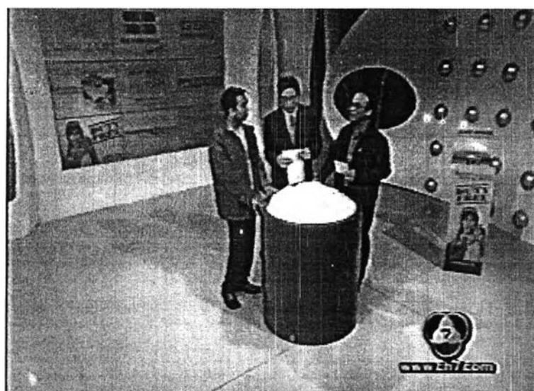
ภาพที่ 21 ช่วงสัมภาษณ์หาโชค

จะเป็นการอ่านจดหมายจากผู้ชมทางบ้านเขียนเข้ามาในรายการ มีการจับรางวัลให้กับผู้ โชคดีทางบ้าน