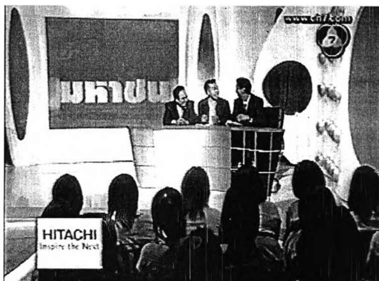
ภาพที่ 18 ช่วงรวมมิตรมหาชน