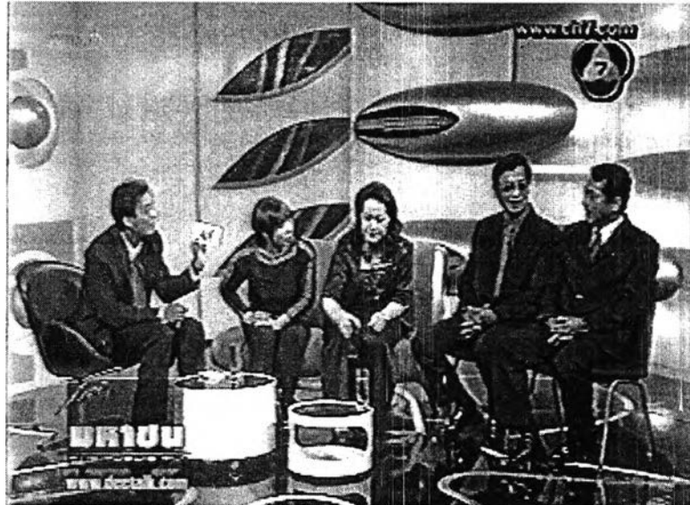
ภาพที่ 15 ฉากในรายการสัญญาณมหาชน

(2) แสง ใช้แสงสว่างธรรมดา ถ้าเป็นฉากโชว์ก็จะจัดให้มีแสงสีสดใส แพรพราวตามลักษณะของเพลง