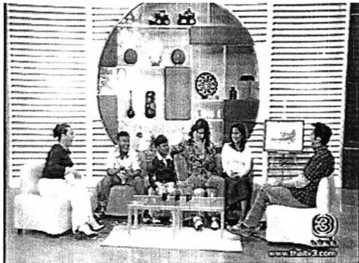
ภาพที่ 8 การจัดฉากของรายการหลังคาเดียวกัน

กลางไว้สำหรับวางดอกไม้หรือต้นไม้เล็กๆ บางครั้งจะมีการจัดโต๊ะเล็กๆ อีกด้านหนึ่งสำหรับเพื่อใช้ในการตั้งคำถาม อุปกรณ์ประกอบฉากที่เป็นที่วีนั้นมักจะเปิดโลโก้หรือสัญลักษณ์ของผู้สนับสนุนรายการ