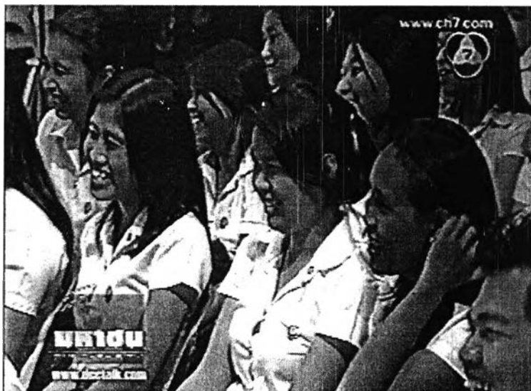
ภาพที่ 16 ผู้ชมในห้องส่ง