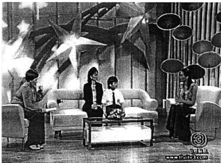
ภาพที่ 1 การจัดฉากหลักของรายการสมาคมชมดาว

คือ ดาวดวงใหญ่ๆพาดบนเส้นสีฟ้าเข้ม เข้ากับแนวคิดของรายการที่เปรียบเสมือนเส้นทางของ ดวงดาว