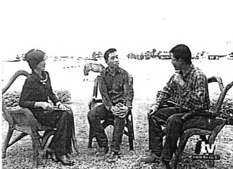
ภาพที่ 22 ฉากจากสถานที่จริง