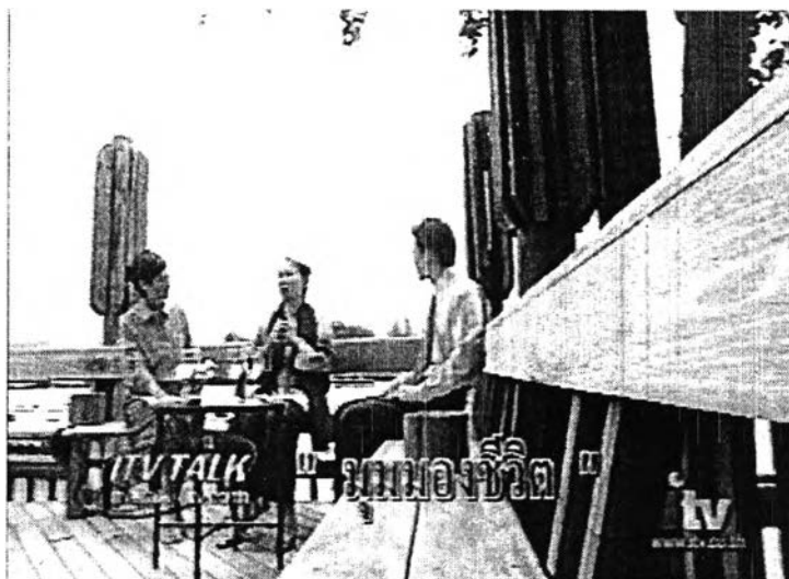
ภาพที่ 23 มุมกล้องในรายการไอทีวีทอล์ค

- ใช้การตั้งชื่อตอนในแต่ละสัปดาห์เพื่อสร้างความน่าสนใจ แกรับเชิญของรายการเจาะใจเป็นมีความหลากหลายในสาขาอาชีพ ทางทีมงานจึงพยายามตั้งชื่อในหัวข้อเรื่องที่จะพูดคุยกันในแต่ละสัปดาห์ให้เป็นคำสั้นๆ ง่ายๆ แต่ดูดี และง่ายแก่การเข้าใจซึ่งเมื่อผู้ชมเปิดผ่านมาก็จะสามารถเข้าใจได้ว่าวันนี้รายการไอทีวีทอล์คจะพูดคุยกันเกี่ยวกับเรื่องอะไร เช่น ตอนวิกฤตโอกาส ฝีมือและจินตนาการ (คุณโชค บูลกุล ออกอากาศ 27 สิงหาคม 2545) , ตอนความน่าจะเป็นที่ "คุณ" คิด (คุณปราบดา หยุ่น ออกอากาศ 10 กันยายน 2545) , ตอนชีวิตที่เปลี่ยนไป (ร.ต.ต.วิจารณ์ พลฤทธิ์ ออกอากาศ 8 ตุลาคม 2545)