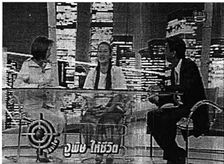
ภาพที่ 12 ฉากของรายการเจาะใจ

(1) ฉากธรรมชาติเข้ากับแนวคิดหลักของรายการ เป็นฉากแบบธรรมชาติโดยเลือกที่จะจำลองเวที ที่มีเก้าอี้และโต๊ะสำหรับสัมภาษณ์เท่านั้น โดยมีได้บ่งบอกว่าเป็นสถานที่ใด แต่เวทีแห่งนี้จะนำเสนอเรื่องราวต่างๆ ของบุคคลและเหตุการณ์ต่างๆที่เกิดขึ้นในสังคม เพื่อสร้างเอกลักษณ์ของรายการว่าเป็นเวทีแห่งการนำเสนออย่างละเอียด และเจาะลึกมากกว่าการนำเสนอผ่านการสัมภาษณ์จากสถานที่จริงที่เกิดเหตุการณ์ โดยให้พิธีกรและแขกรับเชิญนั่งเก้าอี้แบบธรรมชาติตรงกลางมีโต๊ะคล้ายโต๊ะผู้ประกาศข่าว เพื่อสะดวกในการวางบทและอุปกรณ์ประกอบการสัมภาษณ์อื่นๆ โดยมีฉากด้านหลังเป็นภาพย่อส่วนตึกสูงที่มีแสงไฟเปิดสว่าง บอกให้รู้ว่าเป็นเวลากลางคืน