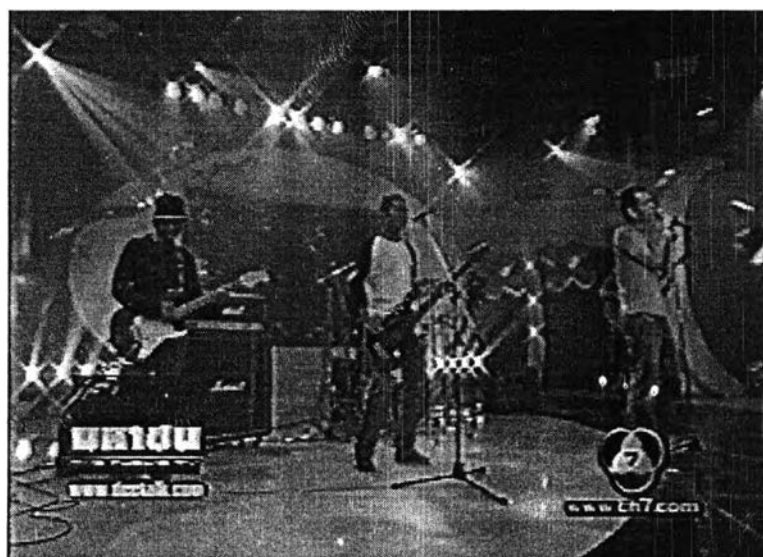
ภาพที่ 17 ช่วงโชว์ในรายการสัญญามหาชน

จะเป็นการร้องเพลง 1 เพลง จากนักร้องที่กำลังมีผลงานออกอัลบั้มอยู่ในขณะนั้น จบแล้วพิธีกรหลักคือคุณสัญญา คุณากร จะออกมาพูดคุยทักทายกับนักร้องผู้นั้น และทักทายผู้ชมทางบ้านและในห้องส่ง เกริ่นนำตัวอย่างรายการในช่วงต่างๆ