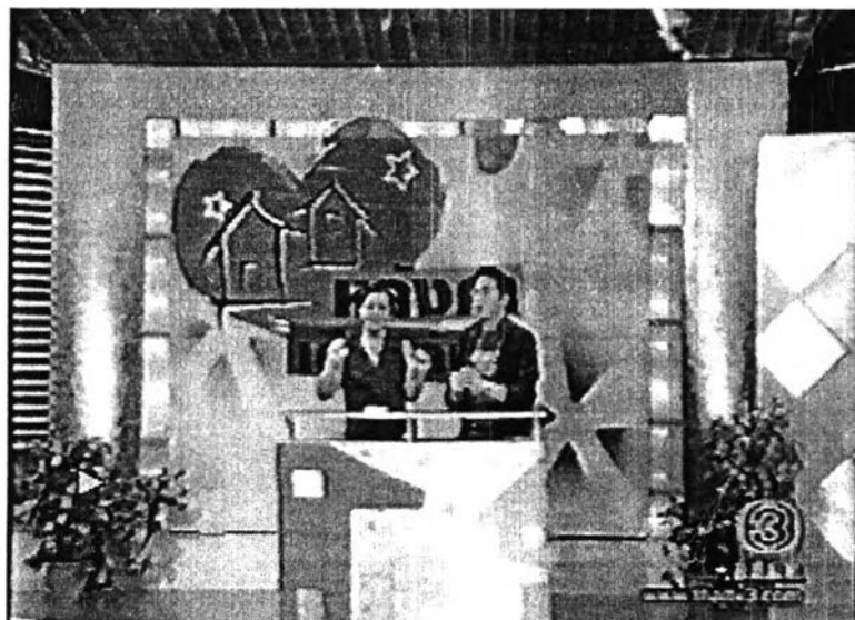
ภาพที่ 9 ฉากสำหรับเล่นเกม

- มีฉากเล่นเกม ในช่วงทำรายการจะมีฉากอีกด้านหนึ่งสำหรับให้แขกรับเชิญเล่นเกม โดยการชม VTR และเปิดแผ่นป้ายผู้สนับสนุน ฉากหลังพิธีกรมีโลโก้รายการหลังคาเดียวกัน แผ่นใหญ่ สีสดใส อยู่หลังโพเดียมที่พิธีกรยืน เพื่อให้ผู้ชมได้เห็นชื่อรายการอย่างชัดเจน