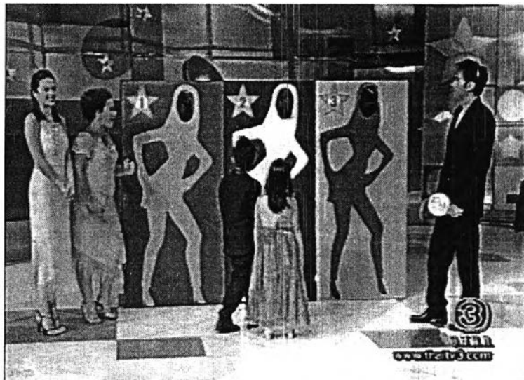
ภาพที่ 6 การนำความสนุกสนานของรายการอื่นมาผสม

VTR คำถามจากคุณตุ๊ก ญาณี : สวัสดีค่ะ ดิฉัน นัท มีเรีย มีคำถามมาถามว่า ผมบนศีรษะไหนเป็นของภรรยาคุณคะ