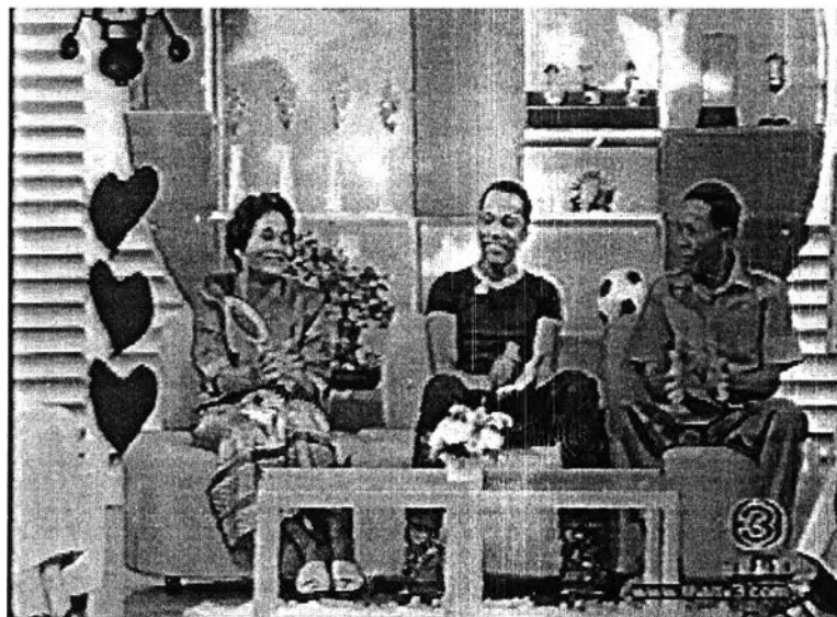
ภาพที่ 11 การใช้กราฟิกต่างๆ

- การใช้กราฟิกต่างๆ เข้ามาช่วยให้เกิดความรัก สนุกสนาน โดยใช้สีสัน สดใส เช่น ใช้กราฟฟิกปล่อยรูปวาดหัวใจออกมา แทนการเปลี่ยนภาพจากภาพหนึ่งไปอีกภาพหนึ่งโดยการ Cut , การใช้กราฟฟิกปล่อยรูปหัวใจแทนการให้คะแนนครอบครัวที่ตอบคำถามได้ถูกต้อง , การใช้กราฟฟิกวาดรูปโลโก้รายการที่มุ่มจ้อ . การใช้กราฟฟิกขึ้นคำถามและชื่อแขกรับเชิญ ฯลฯ