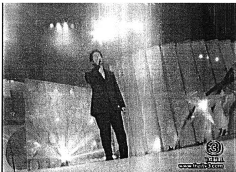
ภาพที่ 3 การใช้แสงสีเพื่อสร้างบรรยากาศ

- การจัดแสงแบบพิเศษ (Special Lighting Application) แบบ Reflected Shapes คือการนำกระดาษหรือพลาสติกมาเจาะเป็นรูต่างๆ แล้วฉายไฟไปที่กระดาษหรือพลาสติกนั้น ให้เงาไปตกอยู่ในฉากที่ต้องการ โดยเจาะเป็นรูโลโก้รายการสมาคมชมดาวเคลื่อนไหวไปมา ส่วนฉากที่โชว์การร้องเพลงของแขกรับเชิญก็จะมีการจัดแสงสีให้เหมาะสมกับฉากนั้น โดยอาจมีการใช้ไฟสี ไฟกระพริบ วูบวาบ หรือหวา เพื่อสร้างบรรยากาศให้คึกคัก สดชื่น แจ่มใสไปด้วย