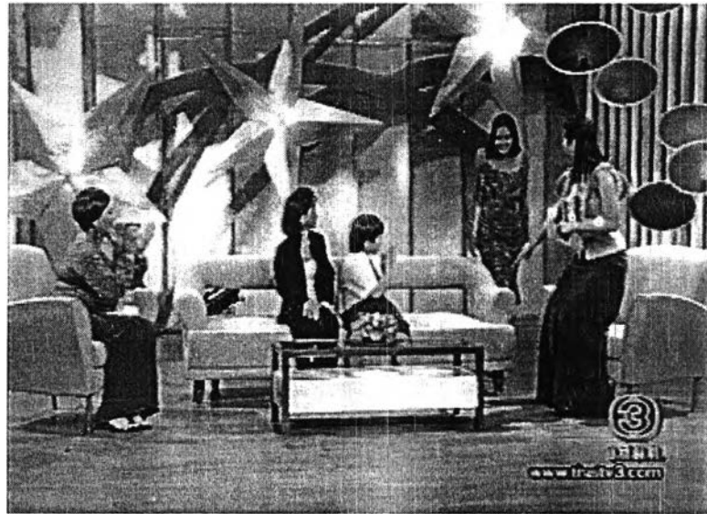
ภาพที่ 5 การนำบุคคลมาสร้างความประหลาดใจ

ระหว่างการสัมภาษณ์จะมีการเตรียมสิ่งของ เครื่องใช้หรือของส่วนตัวของบุคคลนั้นมา ซ่อนไว้ก่อน เมื่อถึงจังหวะและเวลาเหมาะสมก็จะหยิบมาให้แขกรับเชิญดู ซึ่งของเหล่านั้นจะเป็น สิ่งของที่แขกรับเชิญเองก็คาดไม่ถึงว่าพิธีกรจะเอามาเสนอในเวลานั้น เช่น ตุ๊กตาของพี่สาวที่น้อง พลับชอบมาก หรือการเชิญเต๋ยา โจเจอร์ออกมาเพื่อสร้างความประหลาดใจให้น้องพลับ , ให้คน ฆ่ายก้วยเดี่ยวใส่หน้ากากคุณติว - แฟนของคุณใหม่ออกมาเสิร์ฟก้วยเดี่ยว เป็นต้น