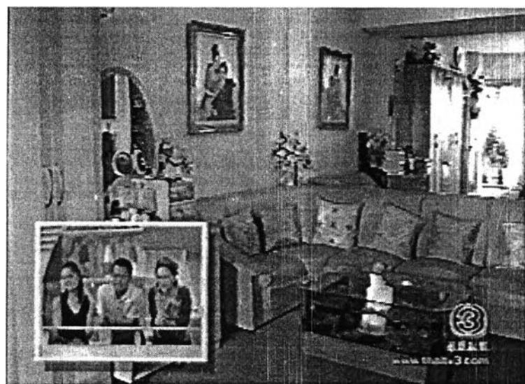
ภาพที่ 10 การทำ VTR คำถามซ่อนของ

- การทำคำถาม และ VTR คำถามซ่อนของที่บ้านแซกรับเชิญในแต่ละสัปดาห์ ซึ่งทำให้ผู้ชมได้ทราบเรื่องราว และสร้างความสนุกสนานในการลองตอบคำถาม และยังได้ชมบ้านที่พักอาศัยของดาราคณโปรด เกิดความรู้สึกได้รู้จักและใกล้ชิดดาราคณโปรดมากยิ่งขึ้นด้วย เช่น บ้านของคุณบ๊ิก ดีทูบี (ออกอากาศ 8 กันยายน 2545) , บ้านอัน - สรวุฒิ (ออกอากาศ 15 กันยายน 2545) , บ้านคุณยิ่งยง ยอดบัวงาม (ออกอากาศ 25 สิงหาคม 2545) เป็นต้น