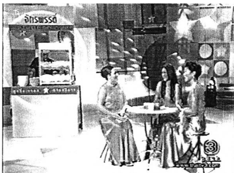
ภาพที่ 2 การจัดฉากประกอบ

- การจัดฉากประกอบเป็นแบบเหมือนจริง ช่วยให้เห็นวัตถุประสงค์และเนื้อหาของ รายการที่พูดคุยกันในวันนั้นได้ชัดเจนยิ่งขึ้น เช่น สัปดาห์ที่เชิญคุณใหม่ เจริญปุระมาเป็นแขกรับ เชิญ มีการจัดฉากเล็กๆจำลองเป็นร้านก๋วยเตี๋ยวจักรพรรดิ มีรถเข็นขายก๋วยเตี๋ยว มีโต๊ะ เก้าอี้ และอุปกรณ์ประกอบในการปรุงรส