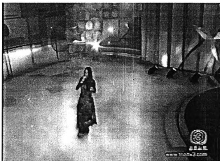
ภาพที่ 4 การใช้หมอกควัน

มีการใช้ในรายการสมาคมชมดาวน้อย จะมีบ้างในช่วงการร้องเพลงของแขกรับเชิญ