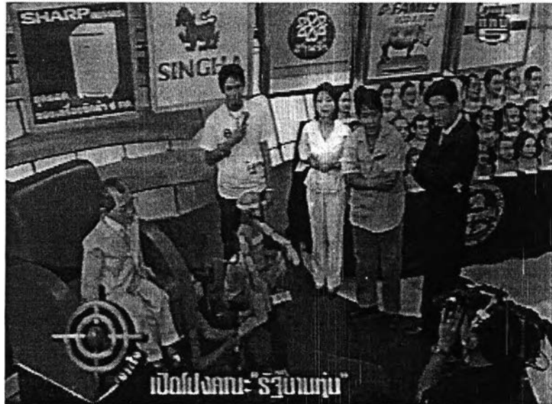
ภาพที่ 14 การนำอุปกรณ์ที่เกี่ยวข้องในการพูดคุยมาเสนอในรายการ