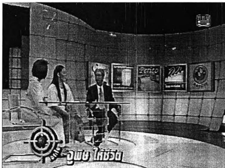
ภาพที่ 13 การจัดวางแผ่นป้ายโฆษณาในฉาก

นอกจากนั้นแล้วจากด้านข้างของผู้ดำเนินรายการทั้งสองท่านจะมีแผ่นป้ายผู้สนับสนุนรายการวางเรียงอยู่เป็นจำนวนมาก ซึ่งกล้องก็มักจะจับภาพการสนทนาด้านข้างเพื่อให้เห็นป้ายผู้สนับสนุนเหล่านั้นบ่อยครั้งอย่างชัดเจน