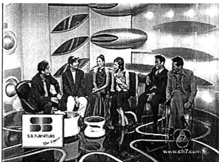
ภาพที่ 19 ช่วงทอล์คในสตูดิโอ