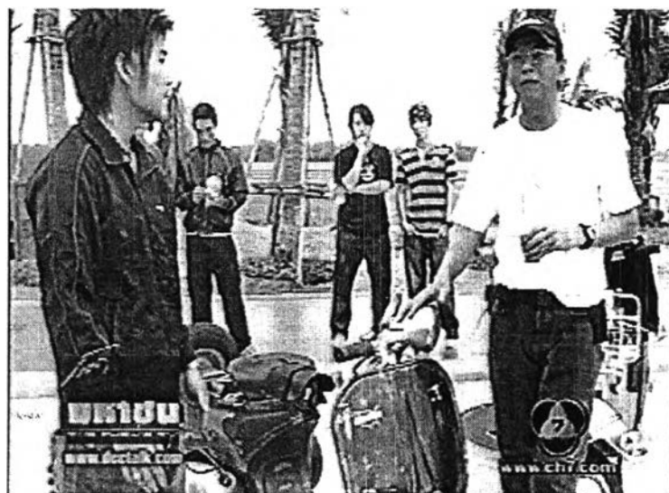
ภาพที่ 20 ช่วง Outdoor

พิธีกรหลักจะพาแขกรับเชิญไปทำกิจกรรมต่างๆ ที่แขกรับเชิญชื่นชอบ หรือพาไปเยี่ยมชม เยือนบ้านของแขกรับเชิญ