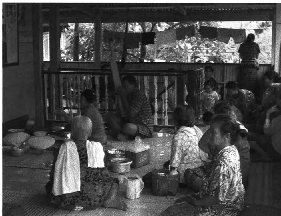
รูปที่ ๓ : แสดงบรรยากาศในการประกอบพิธี

ในขณะนั้นบรรดาเพื่อนบ้านก็มานั่งอยู่ด้านหลังของผู้ที่เป็นผู้ประกอบพิธีเพื่อมารอดูและ รอฟังคำทำนายของผู้ประกอบพิธี