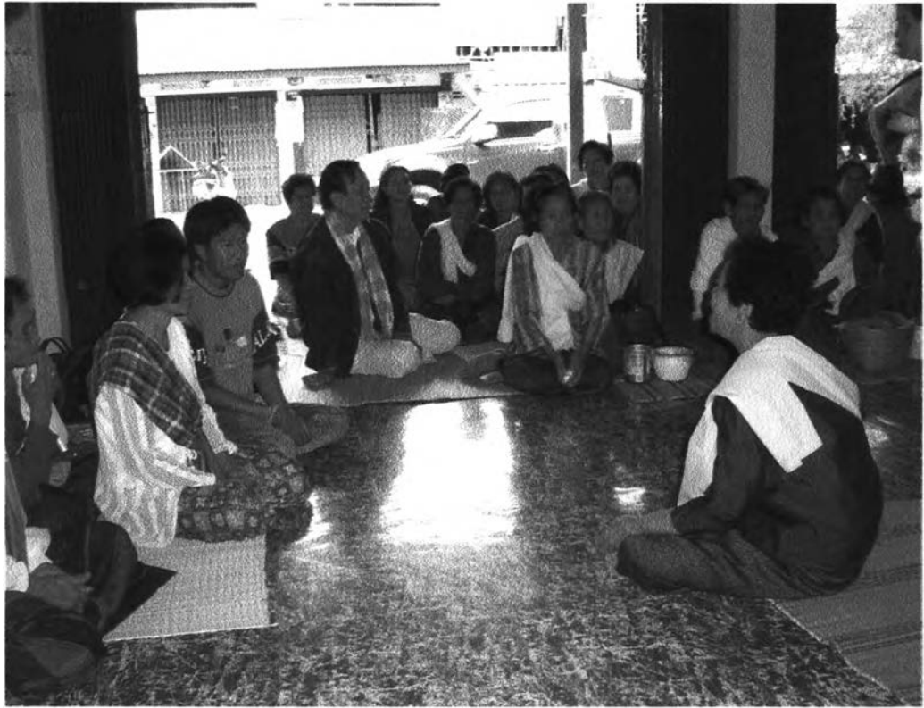
รูปที่ ๒๕ : แสดงบรรยากาศในพิธีขณะบอกกล่าวกับญาติของผู้ป่วย

เพื่อน บัวเงิน บัวทอง พันงา นางนาด คำฝน ปทุมมา เกสร ไกรธร บุสดี โสภา สัสดี สีโห เสมียนทอง เสมียนดา จุมพล สายนต์ ขุนกัน ขุนเจียง ขุนไกร จำปาแก้ว ม้าอานคำโต ม้ามิ่ง ม้าบักหิ้งห้าว สมรแก้ว ขอเชิญทุกท่านลงมาเล่น รับเครื่องบูชาด้วยเถิด