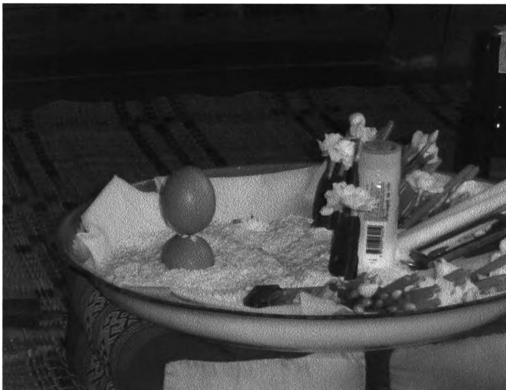
รูปที่ ๑๒ : แสดงการตั้งไข่