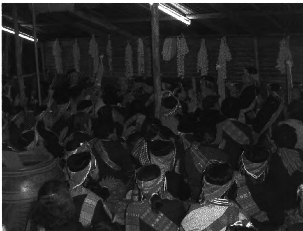
รูปที่ ๒๐ : แสดงบรรยากาศในพิธี