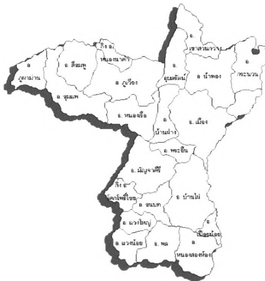
รูปที่ ๒๕ : แสดงแผนที่จังหวัดขอนแก่น

ผู้วิจัยได้ทำการเก็บข้อมูลพิธีกรรมผีฟ้าของจังหวัดขอนแก่นในวันอังคารที่ ๒๗ มกราคม ๒๕๕๗ ตั้งแต่เวลา ๐๘.๐๐ น. เป็นต้นไป ณ บ้านเลขที่ ๒๓ หมู่ ๘ บ้านป่าหม้อ ตำบลพระยืน อำเภอพระยืน จังหวัดขอนแก่น ซึ่งในวันนั้นมีผู้ที่มาร่วมพิธีเป็นจำนวนมากเนื่องจากในหมู่บ้านนั้นมีลูกศิษย์ของผู้ที่เป็นผู้ประกอบพิธีที่เคยรักษาหายมาก่อนมาร่วมพิธีด้วยเพื่อแสดงความเคารพแก่ผู้ที่เป็นผู้ประกอบพิธีและผีที่อยู่ในร่าง