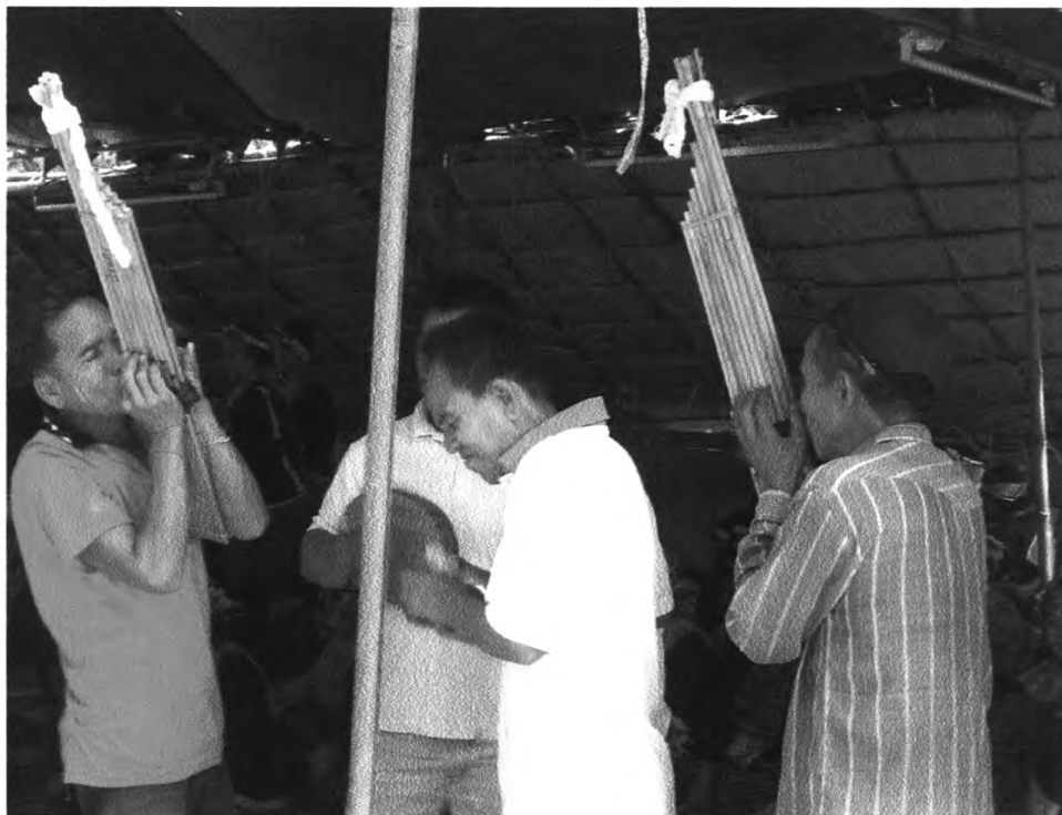
รูปที่ ๒๒ : แสดงเครื่องดนตรีประเภท แคน

เครื่องดนตรีที่ใช้ในการบรรเลงในพิธีกรรมนี้ได้แก่ แคน พิณ ฉิ่ง ฉาบ หม้อ