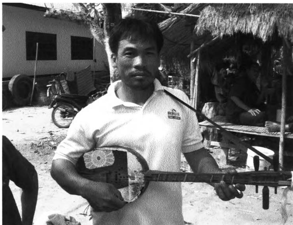
รูปที่ ๒๓ : แสดงเครื่องดนตรีประเภทพิณ