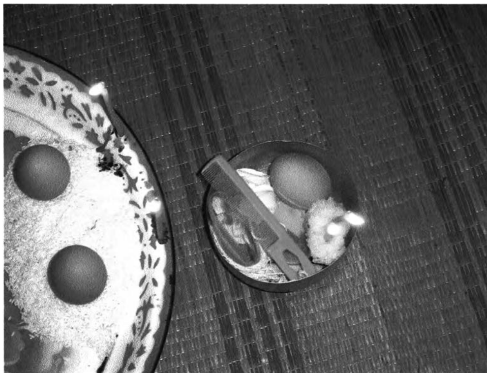
รูปที่ ๒๘ : แสดงขันที่ใช้ในการรับขวัญ

ดอกจำปาขาว เครื่องใช้ของผู้ป่วย และฝ้ายผูกแขน ซึ่งของทั้งหมดนี้จะอยู่ในขัน ดังรูปต่อไปนี้