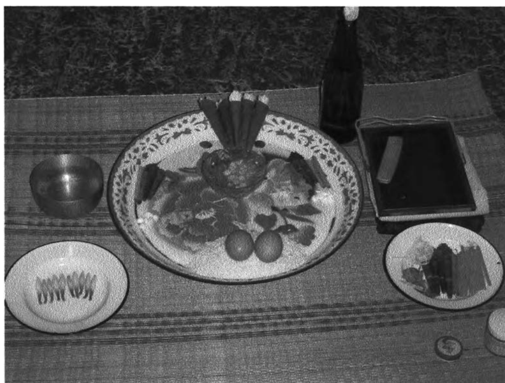
รูปที่ ๒๖ : การวางเครื่องประกอบพิธีกรรมผีฟ้าของจังหวัดขอนแก่น

คินสอพองมาวางไว้ทั้งสองฝั่งเช่นเดียวกัน จากนั้นนำกระดาษเปล่าตัดเป็นสี่เหลี่ยมเล็กพอสมควร จำนวนสี่แผ่นแล้วเอาขี้ผึ้งและนวดทาปาก มาวางบนกระดาษนำมาวางทั้งสองข้างเช่นเดียวกัน ส่วนเงินเหรียญนั้นให้แบ่งข้างละ ๒ บาท โดยวางไว้ข้างกรวยทั้งสองข้าง ขันใส่น้ำคั้นนั้นจะวางไว้ข้างซ้ายของถาดข้าว กระจก หวี ผ้าจั้น และผ้าขาวจะวางไว้ด้านบนขวาของถาด งานขันแปด วางไว้ด้านล่างขวาของถาด งานใส่ดอกไม้ นั้นจะวางไว้ตรงกลางซ้ายของถาด และสุดท้ายคือเหล้าขาว จะวางไว้เหนือถาดเล็กน้อย ส่วนแป้งคินสอพองที่เหลือและขี้ผึ้งที่เหลือก็จะวางไว้ใกล้กับผู้ที่ เป็นผู้ประกอบพิธีเพื่อเอาไว้ทาก่อนที่จะทำพิธี และบุคคลอื่นที่มาร่วมพิธีก็จะสามารถนำแป้งหรือขี้ผึ้งนี้มาทาได้ เมื่อจัดเสร็จจะได้ดังรูปต่อไปนี้