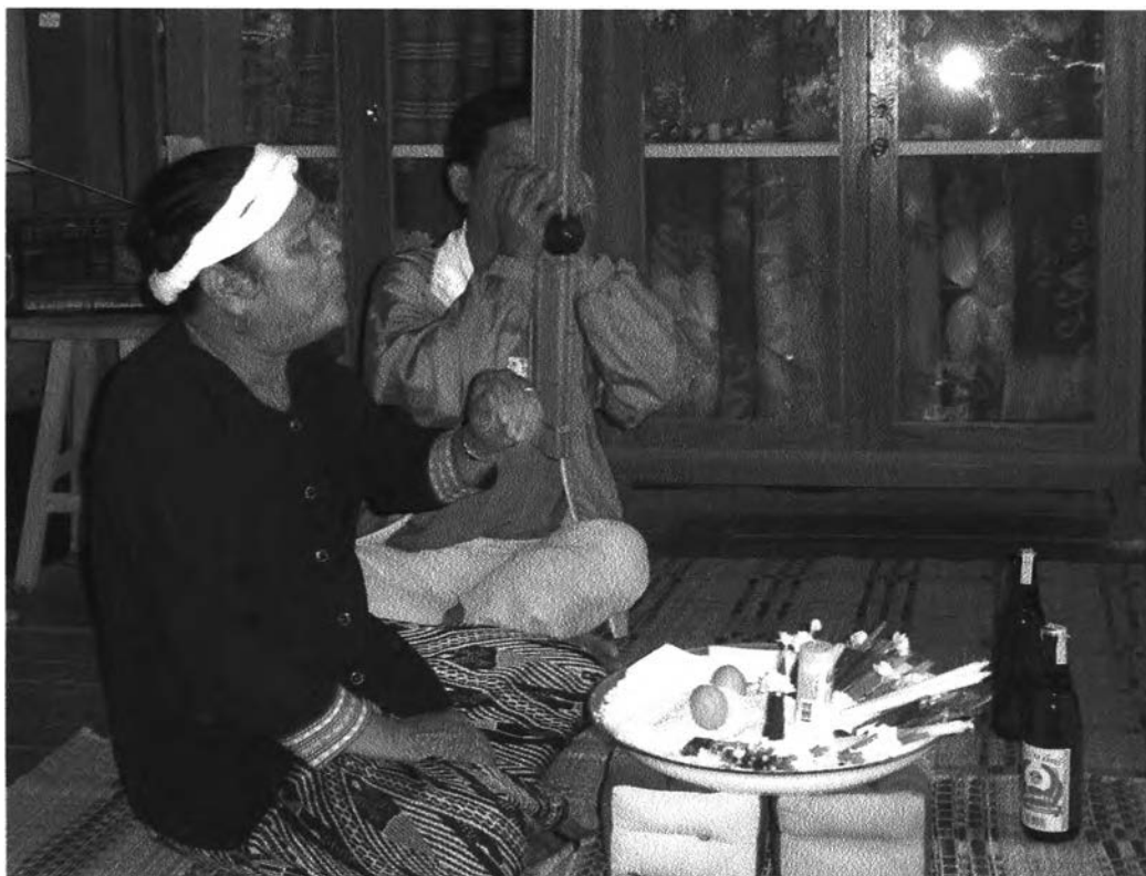
รูปที่ ๑๑ : แสดงขณะที่ลำเพื่อประกอบพิธีกรรม

เมื่ออัญเชิญเสร็จแล้วอาการของผู้ที่เป็นผู้ประกอบพิธีนั้นก็จะเป็นอาการของคนปกติไม่มี การเปลี่ยนแปลงใดๆ แล้วผู้ประกอบพิธีก็จะเริ่ม ทำการถามกับเทพ เทวดา หรือผี ว่าคนผู้ เป็นอะไรซึ่งจะนำไปสู่ขั้นตอนต่อไป