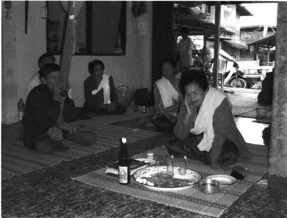
รูปที่ ๒๗ : แสดงการค้าเชิงอุปโภคบริโภค เทวคาหรือผี