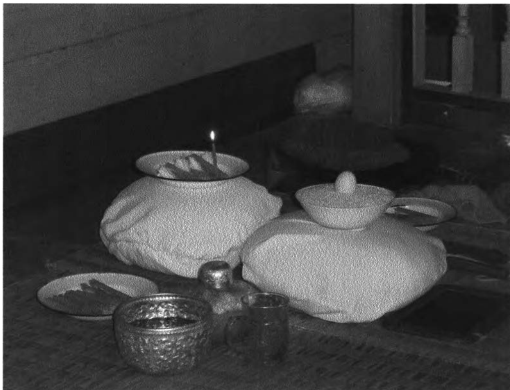
รูปที่ ๒ : แสดงการจัดวางเครื่องประกอบพิธีผีฟ้าจังหวัดสกลนคร