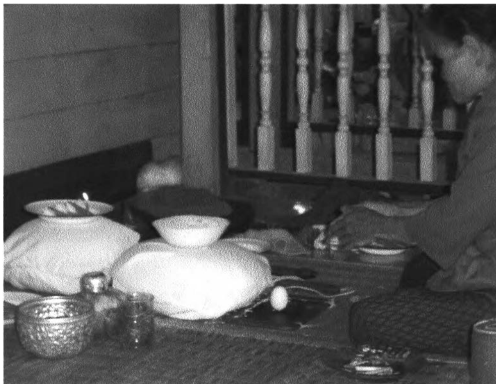
รูปที่ ๔ : แสดงการตั้งใจเพื่อทำนาย

การส่องดูภายในร่างกายของผู้ป่วยนั้นกระทำโดย ผู้ประกอบพิธีจะหันหน้าหาผู้ป่วยแล้วเอา ใจไก่ฟองเดียวกันกับที่ใช้ทำนายเสียงทาย แล้วนำเอาใจไก่มาส่องดูผู้ป่วย โดยประหนึ่งว่าใจไก่นั้น เป็นกล้องส่องภายในร่างกาย