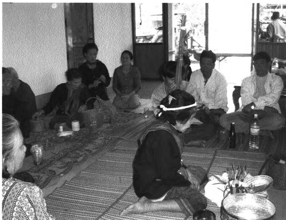
รูปที่ ๑๕ : แสดงบรรยากาศในพิธีกรรม