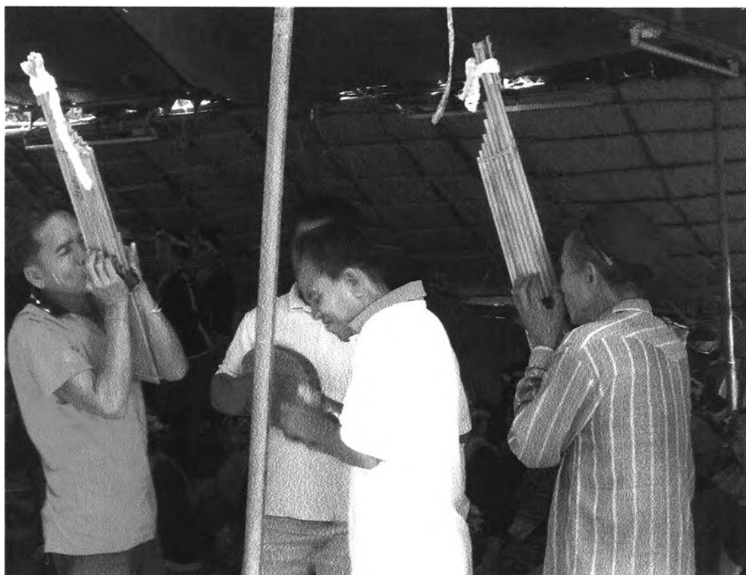
รูปที่ ๓๔ : แสดงการเล่นดนตรีพื้นบ้านอีสาน