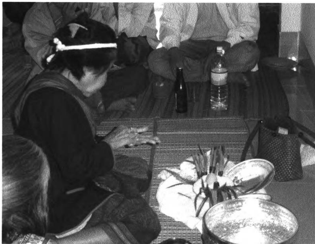
รูปที่ ๑๖ : แสดงการทำนายโดยการนับเมล็ดข้าวสาร