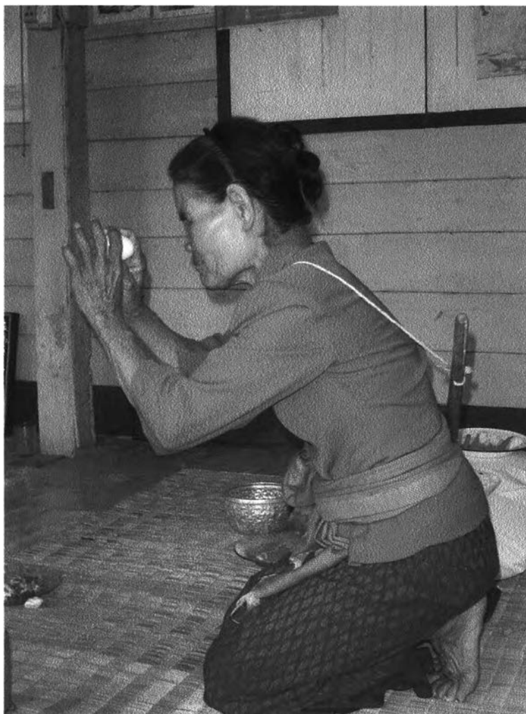
รูปที่ ๕ : แสดงการเอาใจส่งดูภายในร่างกายผู้ป่วยของผู้ที่เป็นผู้ประกอบพิธี

ในขั้นตอนการทำนาย เสี่ยงทายนี้ ผู้ประกอบพิธีใช้กลอนลำต่อไปนี้