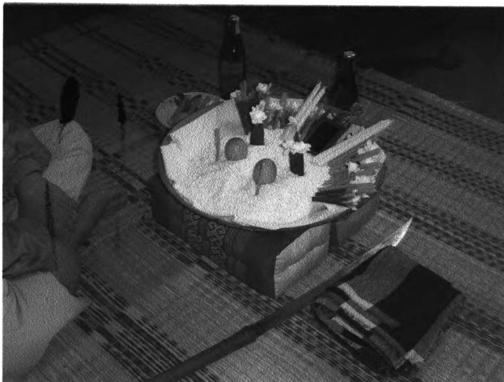
รูปที่ ๑๐ : แสดงการจัดวางเครื่องประกอบพิธีผีฟ้าของจังหวัดนครพนม