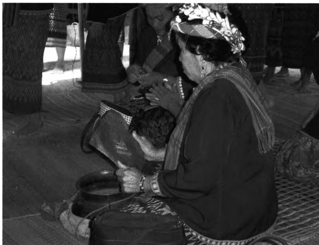
รูปที่ ๒๔ : แสดงเครื่องดนตรีประเภทหม้อ

เครื่องดนตรีประเภทหม้อนี้ มีลักษณะเป็นหม้อก้นตื้น ทำด้วยโลหะ เวลาที่จะบรรเลงจะมีแผ่นสังกะสีที่ทำจากฝาปิ๊บที่ตัดออกจากปิ๊บ แล้วใช้ตีกับหม้อ โดยการตีนั้นจะตีในจังหวะฉีก ซึ่งเครื่องดนตรีประเภทนี้สามารถเล่นได้ทุกคน และผู้ที่เข้าร่วมพิธีก็สามารถตีได้