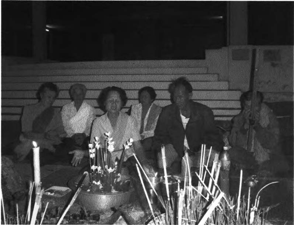
รูปที่ ๓๓ : แสดงบรรยากาศขณะประกอบพิธีกรรม

กลอนลำนี้ใจความว่า ขอเชิญท่านฤทธิศาไฟ ปู่ ย่า อาจารย์ด้วง ท่านที่มีฤทธิเดช ลงมา ให้ข้าพเจ้าได้เปิดอ่านคัมภีร์ของท่านด้วย