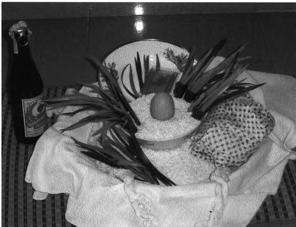
รูปที่ ๑๔ : แสดงการจัดวางเครื่องประกอบพิธีกรรมผีฟ้าจังหวัดอุดรธานี