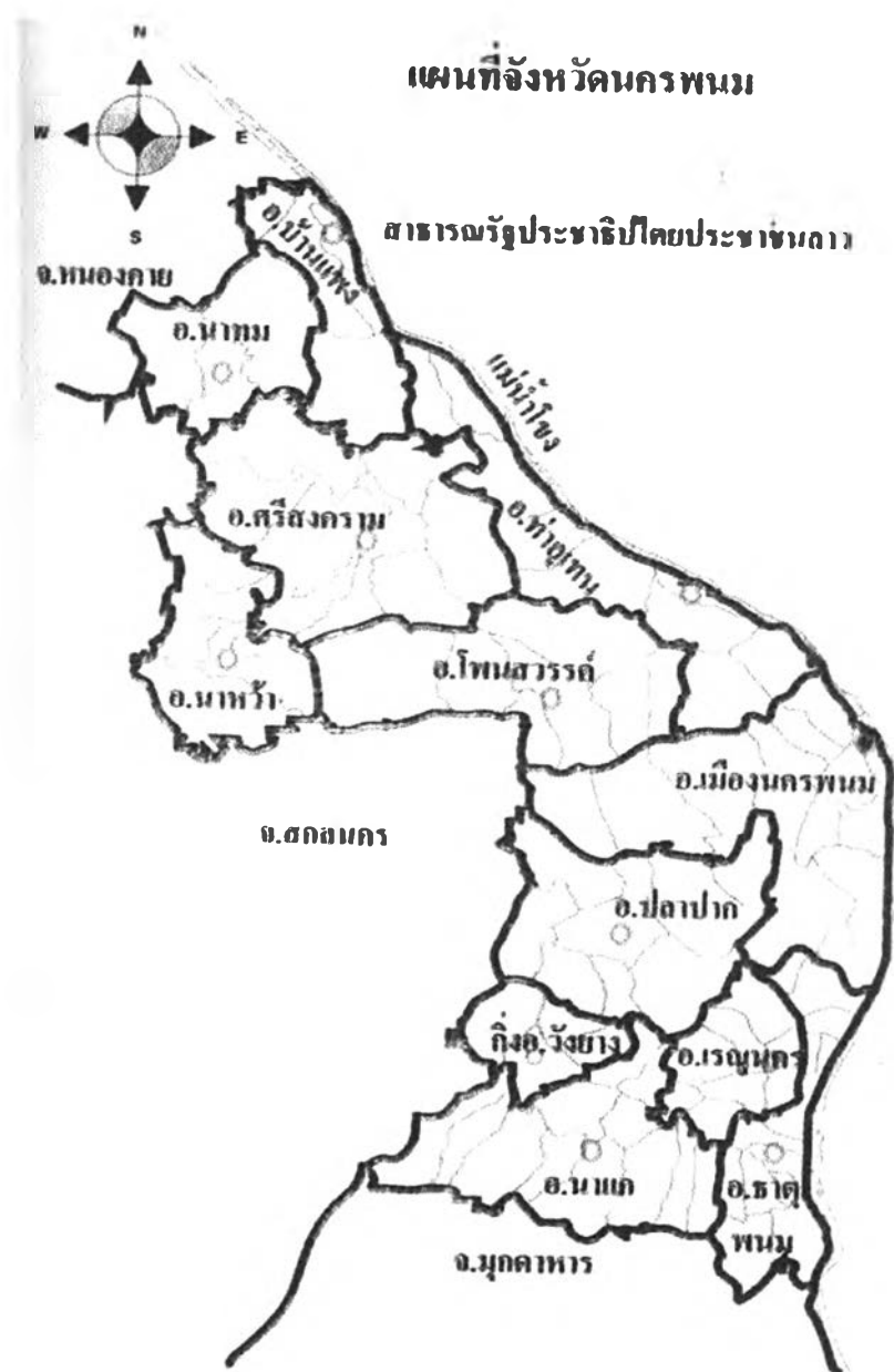
รูปที่ ๕ : แสดงแผนที่จังหวัดนครพนม

ผู้วิจัยได้ทำการเก็บข้อมูลโดยการเข้าร่วมสังเกตการณ์การประกอบพิธีกรรมผีฟ้า วันเสาร์ที่ ๓ เมษายน ๒๕๔๗ ณ บ้านเลขที่ ๕๐ หมู่ ๒ บ้านโนนสังข์ ตำบลโนนสังข์ อำเภอเรณูนคร จังหวัดนครพนม พิธีเริ่มตั้งแต่ ๑๐.๐๐ น. เป็นต้นไป โดยบรรยากาศในขณะนั้นเป็นบรรยากาศของคนในครอบครัวที่กำลังเตรียมเครื่องใช้ที่จะประกอบพิธี และมีผู้ที่เป็นผู้ประกอบพิธีนั้นเข้าไปช่วยอีกแรงเนื่องจากไม่มีใครรู้เรื่องการเตรียมมากนัก