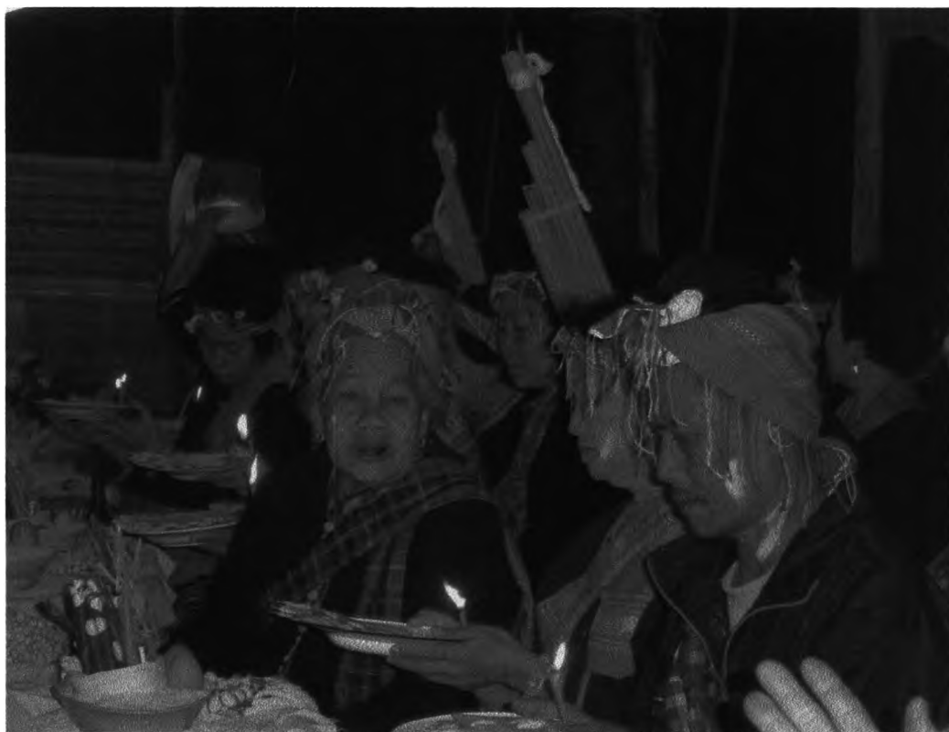
รูปที่ ๒๑ : แสดงการเรียกผีให้มาลงมา

กลอนลำที่ใช้ในพิธีกรรมผีฟ้าของจังหวัดกาฬสินธุ์นั้น ในพิธีกรรมลงวงเลี้ยงผีนี้ จะใช้กลอนลำหรือการลำน้อยมาก ส่วนมากนั้นจะเป็นการฟ้อนรำมากกว่า จึงไม่ค่อยที่จะมีกลอนลำปรากฏในพิธีนี้ แต่พอจะอยู่บ้างก็เป็นการสนทนาระหว่างผีที่อยู่ในผู้ประกอบพิธี ซึ่งเป็นการลำที่เรียกว่า ลำล่อง ซึ่งผู้วิจัยได้กล่าวไว้แล้วในบทที่ ๒