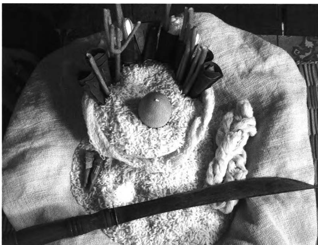
รูปที่ ๗ : แสดงการจัดวางเครื่องประกอบพิธีกรรมผีฟ้าจังหวัดมุกดาหาร

แบ่งนั้นจะใช้เงินโบราณปักไว้ตรงกลางแล้วค่อยปักขวยทั้ง ๔ อัน จากนั้นนำขวยอีก ๔ อันซึ่งภายในประกอบไปด้วยคำหามาแบ่งปักข้างละ ๒ อันอีกเช่นกัน และเอาเทียนอีก ๔ คู่ มาปักไว้ตรงหน้าขวยทั้ง ๔ อัน แล้วเอาเทียนง่า มาปักทางด้านซ้ายของถ้วย และเทียนเกรียวมาปักไว้ทางด้านขวาของถ้วยแล้วนำไข่มาวางตรงกลางถ้วยอีกที ต่อจากนั้นก็นำคำหามาก ๒ คำ มาวางบนขันโตกซึ่งมีข้าวอยู่ข้างใน แล้วเอาฝ้ายมาวางรอบถ้วย ส่วนฝ้ายที่เหลือเอาไว้สำหรับสวมที่ศีรษะของผู้ที่เป็นผู้ประกอบพิธี และสุดท้ายก็เอาคานมาวางบนโตก ส่วนเหล้าขาวและขันใส่น้ำคั้นนั้นตั้งไว้ข้างใดข้างหนึ่งของผู้ที่เป็นผู้ประกอบพิธี ซึ่งเมื่อจัดวางเสร็จแล้วจะออกมาเป็นดังรูปต่อไปนี้