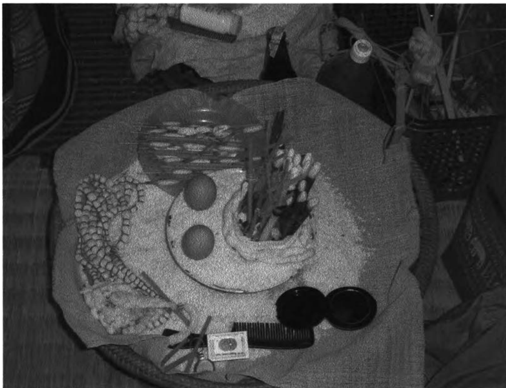
รูปที่ ๑๙ : แสดงการจัดวางเครื่องมือใช้ประกอบพิธี