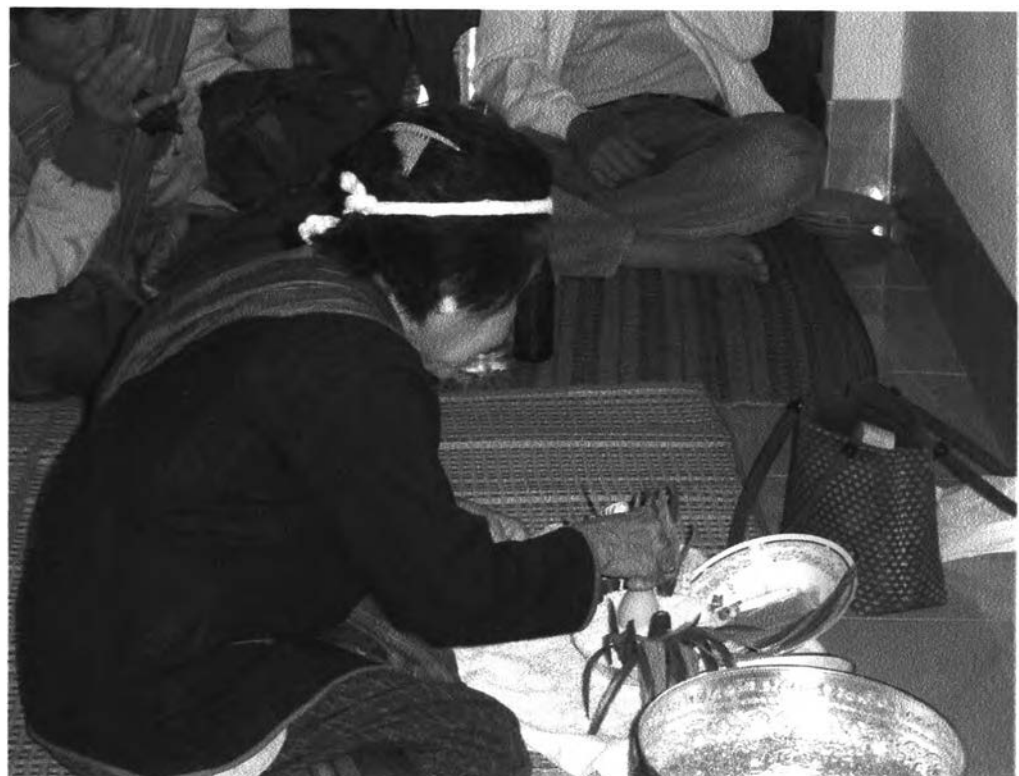
รูปที่ ๑๗ : แสดงการทำนายโดยใช้ข้าวสารวางบนใจ