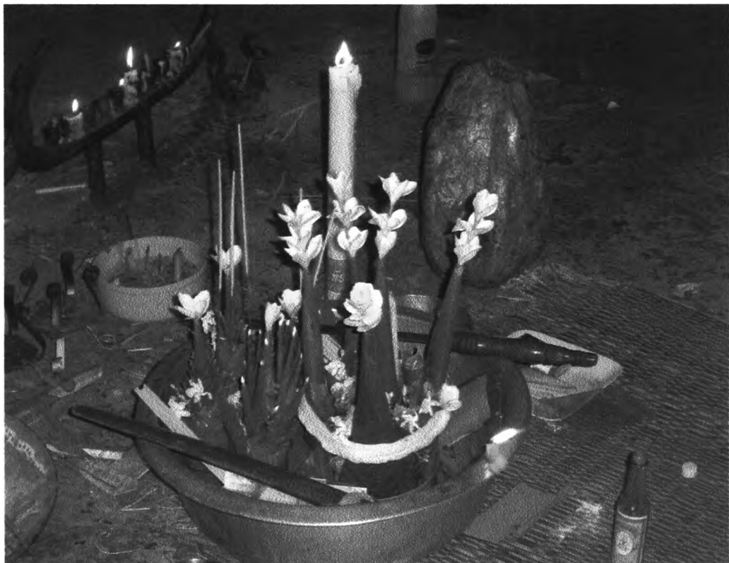
รูปที่ ๓๒ : แสดงการจัดวางเครื่องประกอบพิธีกรรมผีฟ้าจังหวัดชัยภูมิ

การจัดเครื่องคายนั้นจะเอาบายศรีทั้งชุดใหญ่และชุดเล็กใส่ในกาละมังแล้วเอาฝ้ายขาวมาครอบบายศรีชุดใหญ่ ส่วนขันห้า ขันแปด ขันใส่ขาสีฟันและดอกไม้ จานยาสูบนั้นจะวางรอบๆ กาละมังที่ใส่บายศรี ส่วนคาบ ก็จะวางในกาละมัง ดังจะแสดงให้เห็นในรูปต่อไปนี้