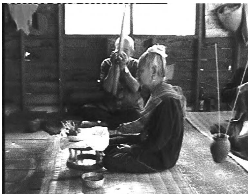
รูปที่ ๘ : แสดงขณะประกอบพิธีกรรม

การเป่าแคนในการประกอบพิธีกรรมดังกล่าว หมอแคนจะเป่าแคนนำไปก่อน ต่อจากนั้นผู้ประกอบพิธีก็จะเริ่มล่าในลำดับถัดไป ทำเช่นนี้ไปเรื่อยๆ จนกว่าพิธีกรรมจะเสร็จสิ้น หรือจนกว่าผู้ประกอบพิธีนั้นจะบอกให้หมอแคนหยุดเป่า จึงจะสามารถหยุดเป่าได้