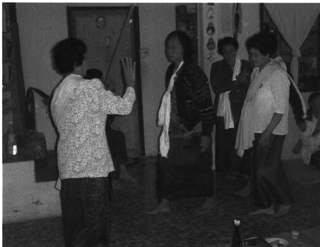
รูปที่ ๓๐ : แสดงบรรยากาศในงานขณะที่ผีลงมาเพื่อนรำ