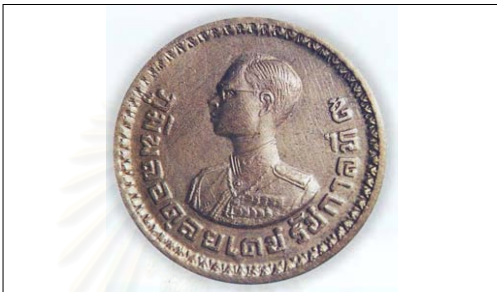
เหรียญชาวเขาด้านหลัง