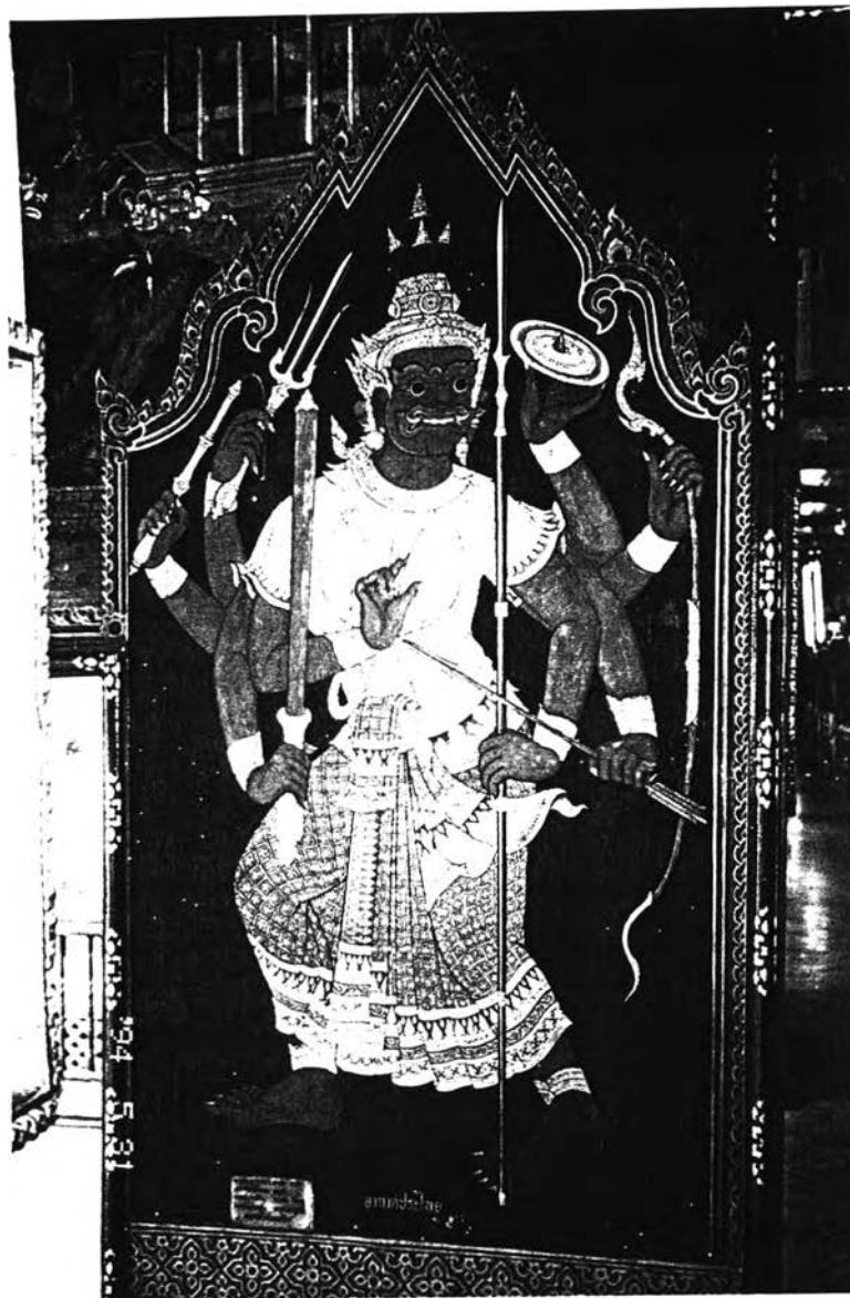
ภาพที่ 2 : ลักษณะรูปร่างจากภาพจิตรกรรมฝาผนัง "อากาศประไลย"

ที่มา : ถ่ายภาพโดย นายอนุชา บุญยัง ณ ระเบียงคต วัดพระศรีรัตนศาสดาราม กรุงเทพมหานคร, วันที่ 26 เมษายน 2544.