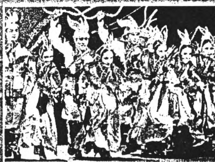
Thailand welcomes the Korea National Dance Company