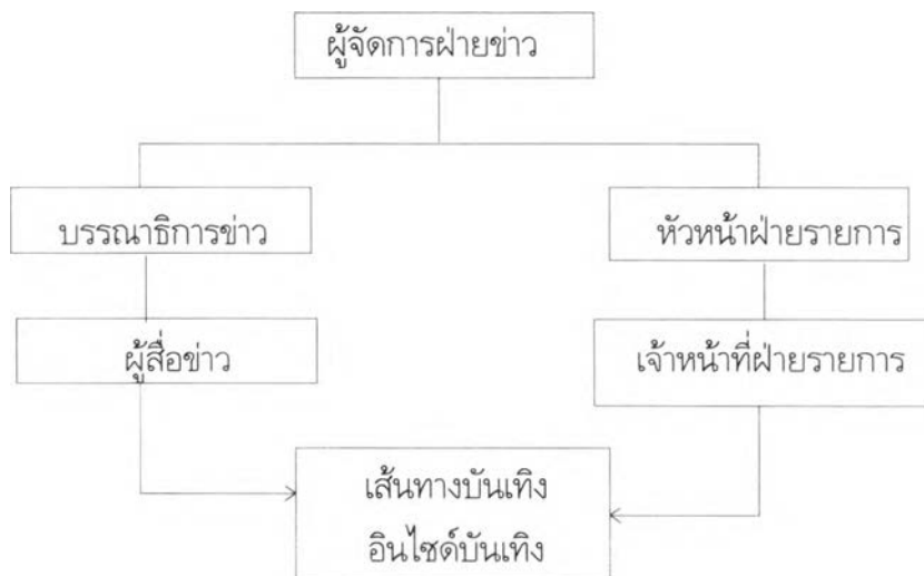
แผนภาพ 5 : การทำงานข่าวบันเทิงของสถานีโทรทัศน์สีกองทัพบกช่อง 7

ทีมงานผลิตรายการข่าวบันเทิงของช่อง 7 จะมีบรรณาธิการควบคุมดูแลคือ คุณสัต์ตกมล วรกุล ทำหน้าที่ในการคัดเลือกและมอบหมายให้ผู้สื่อข่าวออกไปเก็บภาพข่าว โดยบรรณาธิการจะมีอิสระในการคัดเลือกข่าวประจำวัน แต่ถ้าเป็นสัปดาห์พิเศษจะได้รับการแนะนำแนวทางจากผู้บริหาร