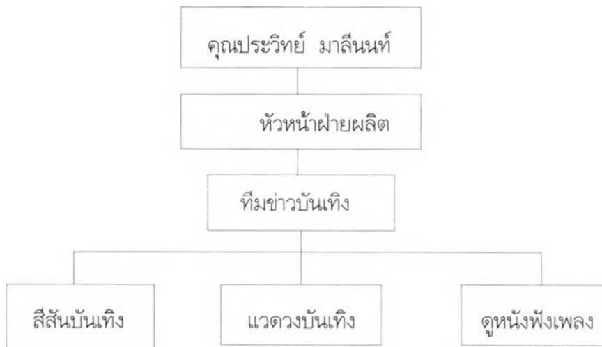
แผนภาพ 3 : การทำงานข่าวบันเทิงของสถานีวิทยุโทรทัศน์ไทยทีวีสีช่อง 3 อ.ส.ม.ท.

การปฏิบัติงานในการผลิตรายการข่าวบันเทิงนั้น ดำเนินตามนโยบายของสถานี ทางผู้บริหารได้มองว่าฝ่ายผลิตจะรู้ความเคลื่อนไหวในแวดวงบันเทิงได้ดีกว่าฝ่ายข่าว จึงได้มอบหมายให้ฝ่ายผลิตเป็นผู้รับผิดชอบในการผลิตรายการข่าวบันเทิงของช่อง 3 ซึ่งเป็นพนักงานของสถานีเอง โดยลักษณะการบริหารงานนั้นเป็นลักษณะการกระจายอำนาจไปยังส่วนต่างๆ ตามสายการบังคับบัญชาตามลำดับชั้น ซึ่งสามารถแสดงออกมาในรูปแบบภาพการทำงานได้ดังนี้