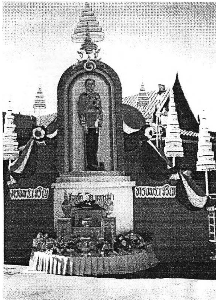
ภาพการจัดกิจกรรมเนื่องในวันเฉลิมพระชนมพรรษาของพระบาทสมเด็จพระเจ้าอยู่หัวฯ