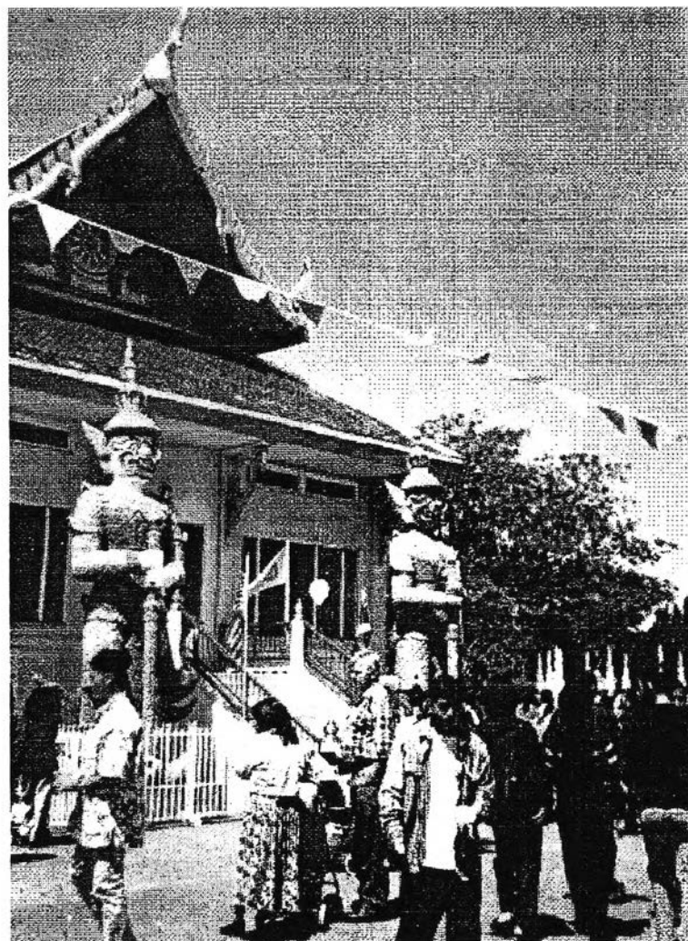
ภาพแสดงบรรยากาศการจัดกิจกรรมเนื่องในวันสงกรานต์ที่วัดไทยลอสแอนเจลิส