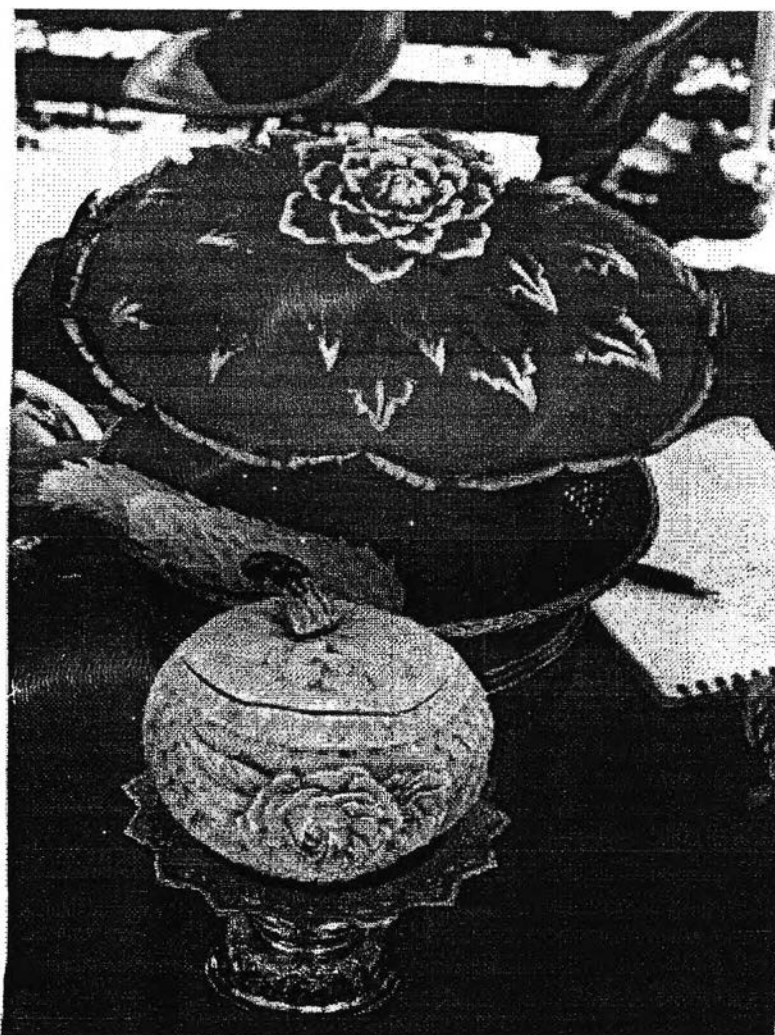
ภาพแสดงฝีมือการแกะสลักของนักเรียนโรงเรียนวัดไทยลอสแอนเจลิส