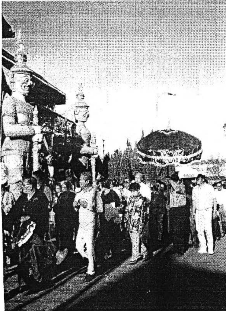
ภาพแสดงพิธีการแห่傘ที่วัดไทยลอนแองเจลีส์