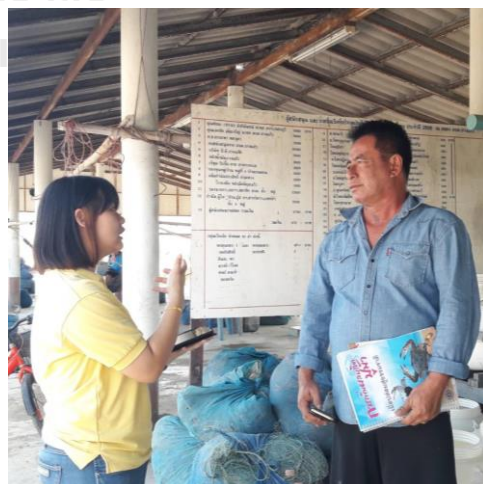
ภาพประมวผลในการสัมภาษณ์ผู้ที่เกี่ยวข้องกับธนาคารปูม้า