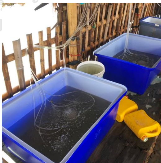
ภาพประมวผลการทำงานของธนาคารปูม้า