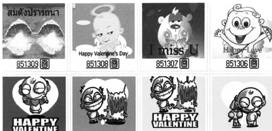
ภาพประกอบที่ 8 ตัวอย่างของข้อความภาพ (MMS)

เด็กชาย ประพทธี บุญชู อายุ 13 ปี ให้เหตุผลว่า “ส่วนใหญ่จะส่งแค่ SMS เนื่องจากว่ามันส่งง่ายและเร็วดี”