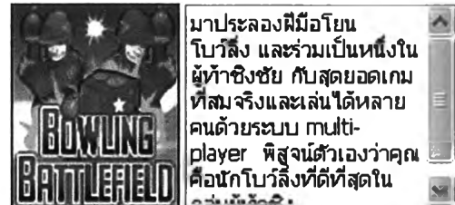
Bowling Battlefield (870600)