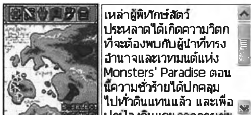
Monsters' Paradise (870599)