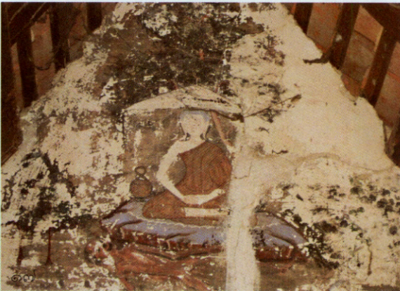
รูปที่ ๑๖ พระพุทธรูปวิมา ปางปาลิไลยก์ รูปที่ ๑๗ อุกฤษฏมาตกอกอศกกรรมฐาน ซากศพที่พองขึ้นอีก นับแต่สิ้นลม