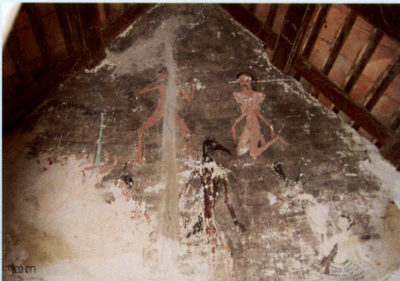
รูปที่ ๒๑ สุนัขจิ้งจอก รูปที่ ๒๒ มหาตปนรก รูปที่ ๒๓ เปรตวิสัยภูมิ