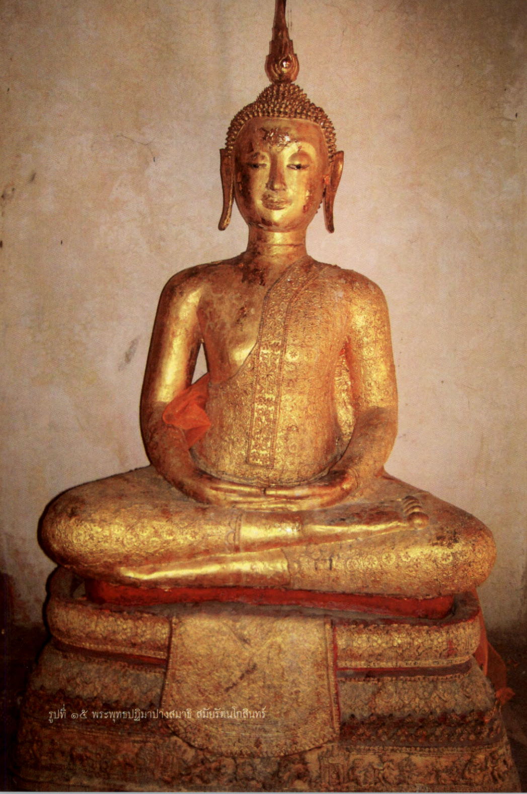
รูปที่ ๑๕ พระพุทธปฐิมาปางสมาธิ สมัยรัตนโกสินทร์