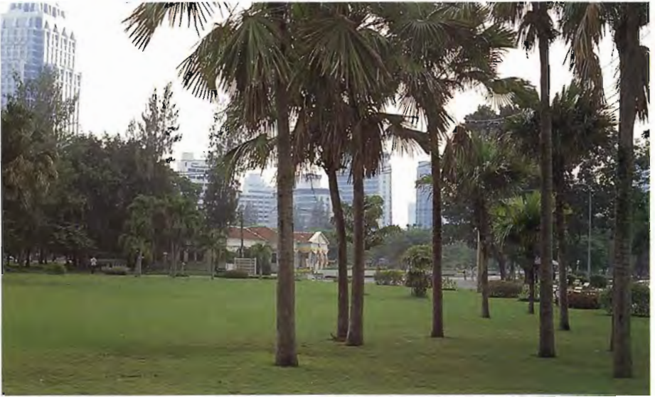
บริเวณส่วนหนึ่งของสวนลุมพินี ปัจจุบันสวนสาธารณะแห่งนี้กำลังถูกล้อมล้อมด้วยอาคารสูงเกือบทุกด้าน