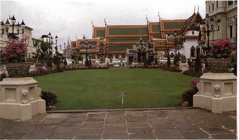
สนามหญ้าหน้าพระที่นั่งจักรีมหาปราสาท ในพระบรมมหาราชวัง ซึ่งเป็นสนามหญ้าแห่งแรกในประเทศไทย