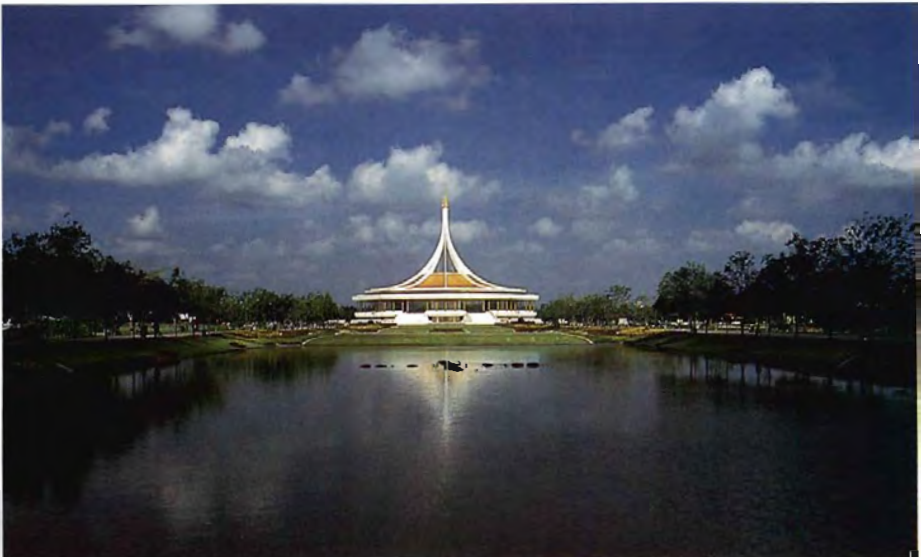
หอรัชมงคลในสวนหลวง ร.๙ สว่างไสวด้วยลำแสงสุดท้ายของดวงอาทิตย์ก่อนจะพลบค่ำ