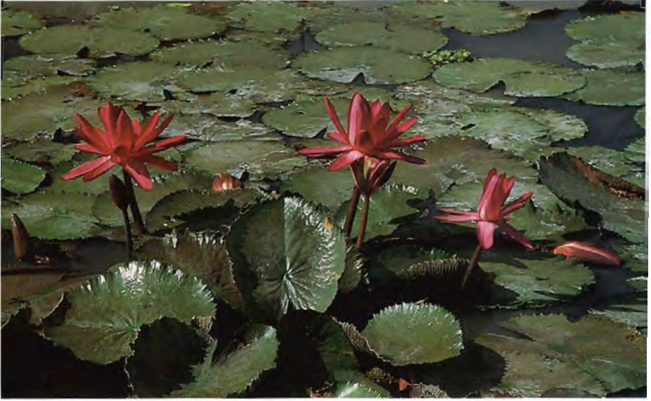
“อุบลชาติ” หรือ “บัวสาย” (water lily/ Nymphaea sp. )