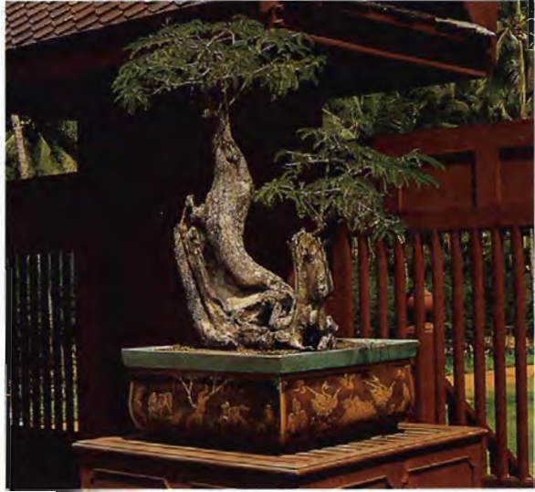
“มะขามโพรงโค้งคู้เป็นข้อศอก ฝักกรอกแห้งเกราะกะเทาะล่อน”