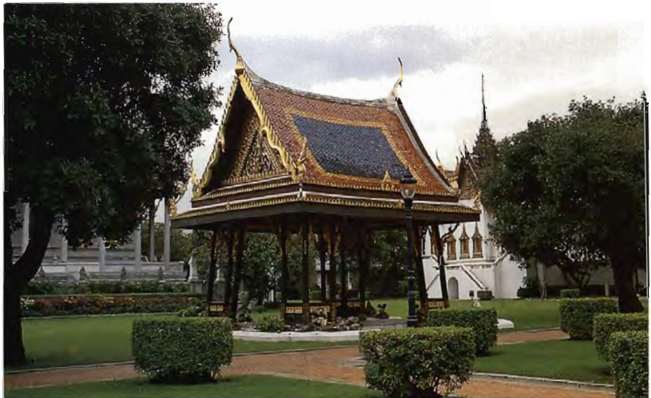
พระที่นั่งสี่ศาลาภิรมย์ ภายในสวนศิवालย์ ในพระบรมมหาราชวัง