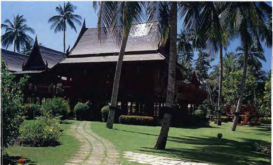
อุทยานพระบรมราชานุสรณ์รัชกาลที่ ๒ ที่อำเภออัมพวา จังหวัดสมุทรสงคราม

“วนาศรม” ภาพฝีพระหัตถ์สมเด็จพระเทพรัตนราชสุดาฯ สยามบรมราชกุมารี เป็นภาพศาลาของนักพรต อยู่ท่ามกลางธรรมชาติอันงดงาม ร่มรื่น และภาพนี้ยังแสดงให้เห็นประจักษ์ว่าสวนไทยเป็นสวนที่สามารถให้สัตว์ ต่างๆ เข้ามาอยู่ร่วมกับคนได้ เป็นที่เอื้อต่อการหนีร้อนมาพึ่งเย็นโดยแท้