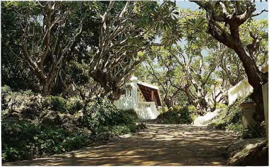
พระนครคีรี จังหวัดเพชรบุรี ได้รับการตกแต่งบริเวณให้เป็น “สวนหิน” ท่ามกลางตงต้นลำทมอันร่มรื่น