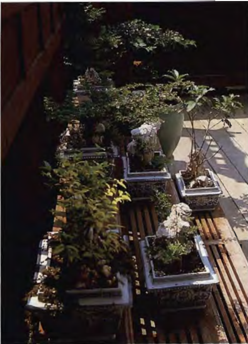
“สวนแคร์” บนนอกชานเรือนที่อุทยาน พระบรมราชานุสรณ์รัชกาลที่ ๒ อัมพวา