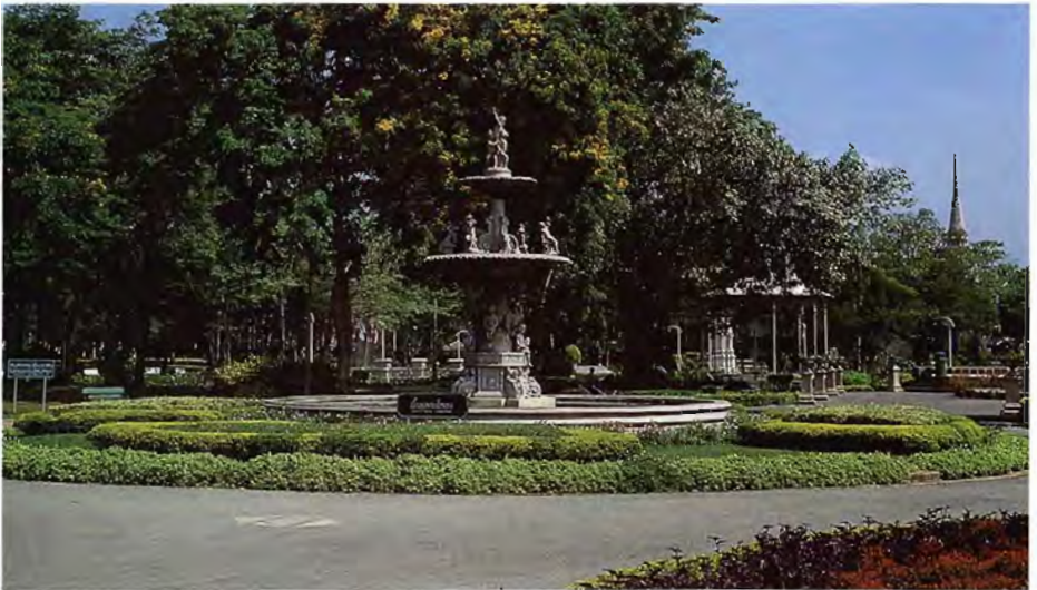
พระราชอุทยานสราญรมย์ ซึ่งเคยมีชื่อเสียงเป็นที่รำลึกในสมัยรัชกาลที่ ๕ และรัชกาลที่ ๖ ปัจจุบันเป็นสวนสาธารณะอยู่ในความดูแลของกรุงเทพมหานคร