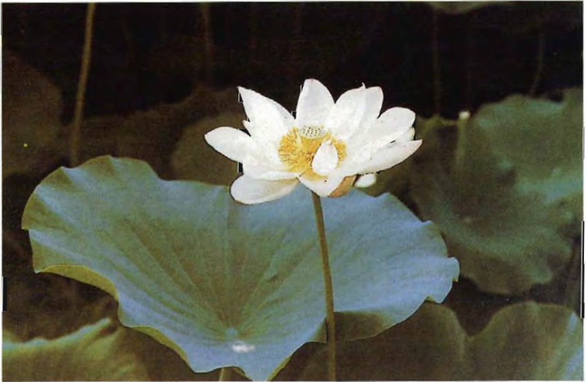
“ปทุมชาติ” หรือ “บัวหลวง” (lotus/ Nelumbo nucifera ) บัวหลวงสีขาวนี้มีชื่อว่า “บุณทริก”