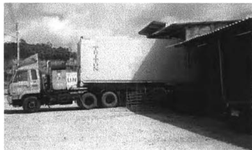
รถคอนเทนเนอร์ปรับอากาศขนทุเรียนไป ยังท่าเรือน้ำลึก