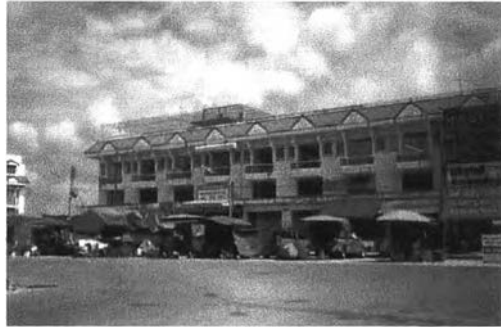
บริเวณหน้าตลาดอวยชัย 3