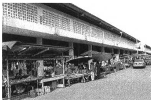
อาคารตลาดหลังใหม่ที่สร้างโดยเทศบาล