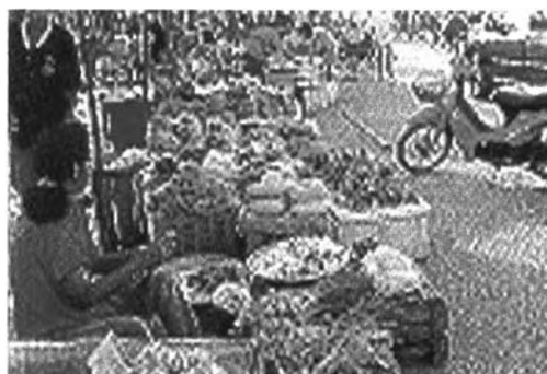
พืชผักที่วางขายปลีกส่วนใหญ่มาจาก แหล่งเพาะปลูกในจังหวัดอื่นๆ