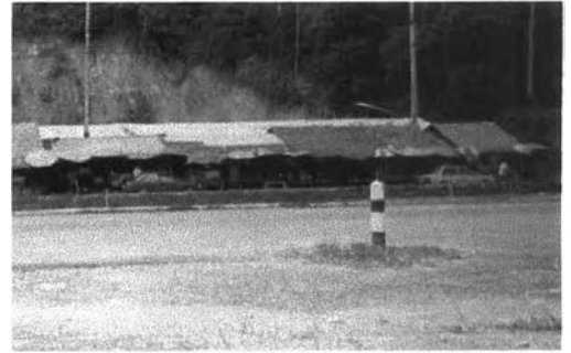
แผงขายผลไม้ริมทางหลวงตรงกันข้าม กับตลาดอวยชัย