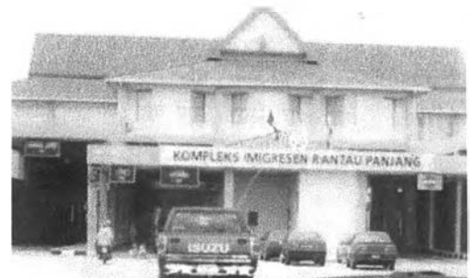
ด่านสุโขทัยที่ผักผลไม้ผ่านเข้า-ออกระหว่างประเทศ