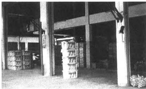
อาคารพาณิชย์ที่ผู้ค้าส่งใช้เป็นสถานที่รวบรวมและคัดขนาดผลผลิตก่อนส่งขาย