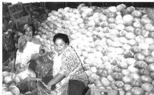
ผลผลิตจากภายนอกภูมิภาคที่ไม่สามารถปลูกได้ในภาค