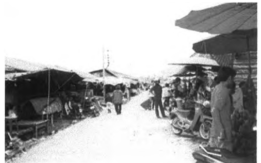
บริเวณตลาดท่ากลางจะยาวนานไปกับทางรถไฟ