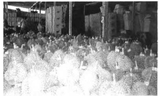
ทุเรียนส่งออกที่ผ่านการคัดขนาดแล้ว