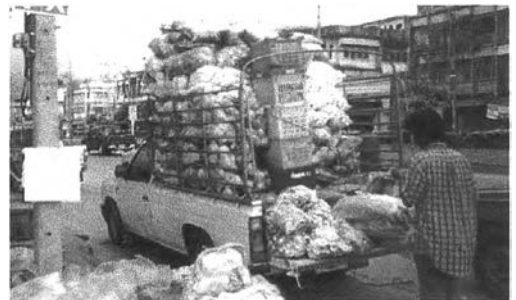
พ่อค้าปลีกนิยมมาซื้อสินค้าจากตลาดค้าส่งเพื่อกลับไปขายให้ผู้บริโภคในท้องที่ต่างๆ