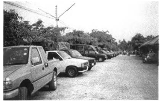
รถกระบะที่ใช้ขนส่งผลผลิตของเกษตรกรและพ่อค้า