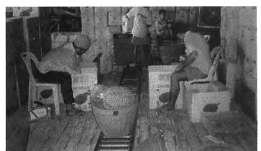
การบรรจุหีบห่อเพื่อส่งออก