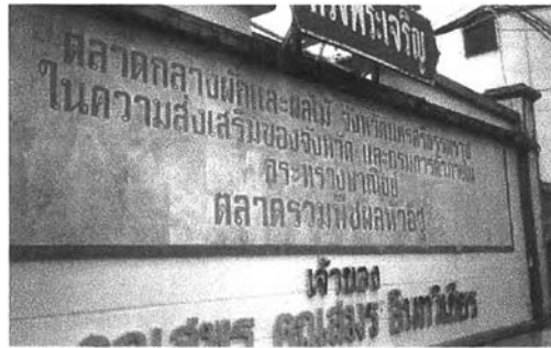
ตลาดได้รับความส่งเสริมจากกรมการค้าภายใน