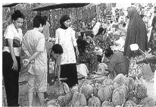
ริมถนนในตลาดเป็นอีกบริเวณหนึ่งที่มี การวางขายสินค้าอย่างหนาแน่น