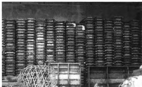
กองภาชนะใส่ผักผลไม้ที่เก็บรวบรวมไว้ใช้งาน