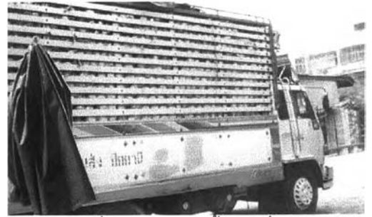
รถบรรทุกที่ผู้ค้าส่งใช้ไปรับซื้อกะหล่ำปลีจากภาคเหนือเพื่อส่งขายต่อให้มาเลเซียและในท้องถิ่น