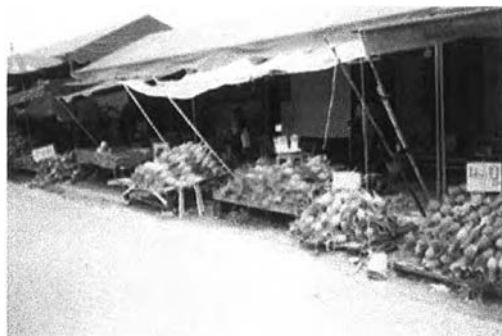
ผลผลิตภายในภาคที่วางขายปลีกและราคาถูก