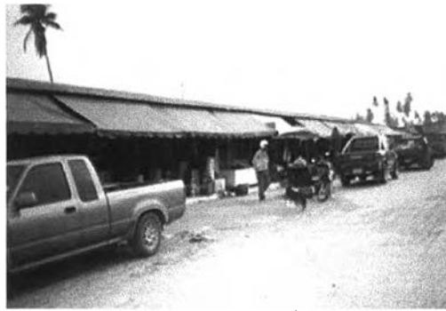
บริเวณถนนกลางตลาดและร้านซึ่งมีลักษณะเป็นห้องแบ่งให้เช่าขายสินค้า