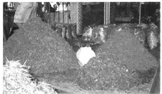
ผลผลิตที่มีความสำคัญเชิงเศรษฐกิจของภาคได้