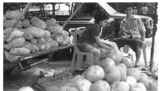
ผลไม้พื้นเมืองที่หาซื้อได้ในตลาดหาดใหญ่