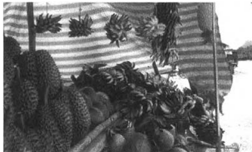
ผลไม้ในท้องถื่นวางขายบนแผงริมถนน