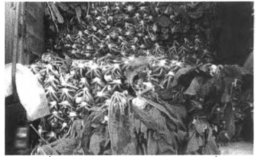
ผักที่บรรทุกมาขายไม่ได้บรรจุภาชนะที่ได้มาตรฐานทำให้เกิดความเสียหายแก่ผลผลิต