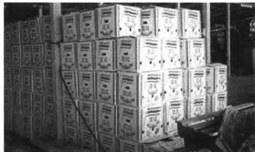
ทุเรียนที่บรรจุหีบห่อเรียบร้อยแล้ว