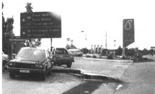
บริเวณด้านตุลการฝั่งมาเลเซีย