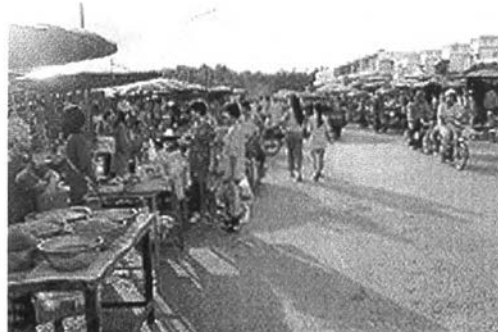
ตลาดเมืองใหม่ที่จับจ่ายสินค้าของประชาชน ในเขตเทศบาลนครยะลา