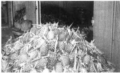
สับปะรดที่รอส่งให้กับพ่อค้าจากมาเลเซีย