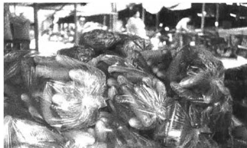
ผักอีกชนิดหนึ่งที่ปลูกกันทั่วไปในภาคได้