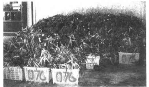
สินค้าที่ผ่านการคัดขนาดและบรรจุภาชนะแล้ว