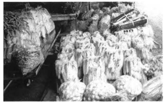
อีกส่วนหนึ่งพ่อค้าขายส่งขายให้กับพ่อค้าปลีก