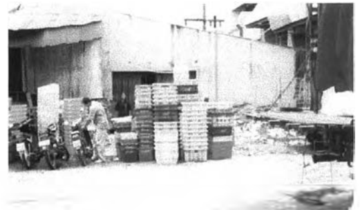
สภาพริมถนนบริเวณร้านค้าส่งที่ยังไม่ได้รับการทำความสะอาด