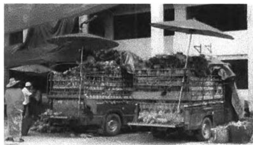
สับปะรดจากพื้นที่ปลูกทางตะวันตกของภาค