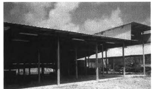
โรงคัดขนาดในช่วงนอกฤดูเก็บผลผลิต